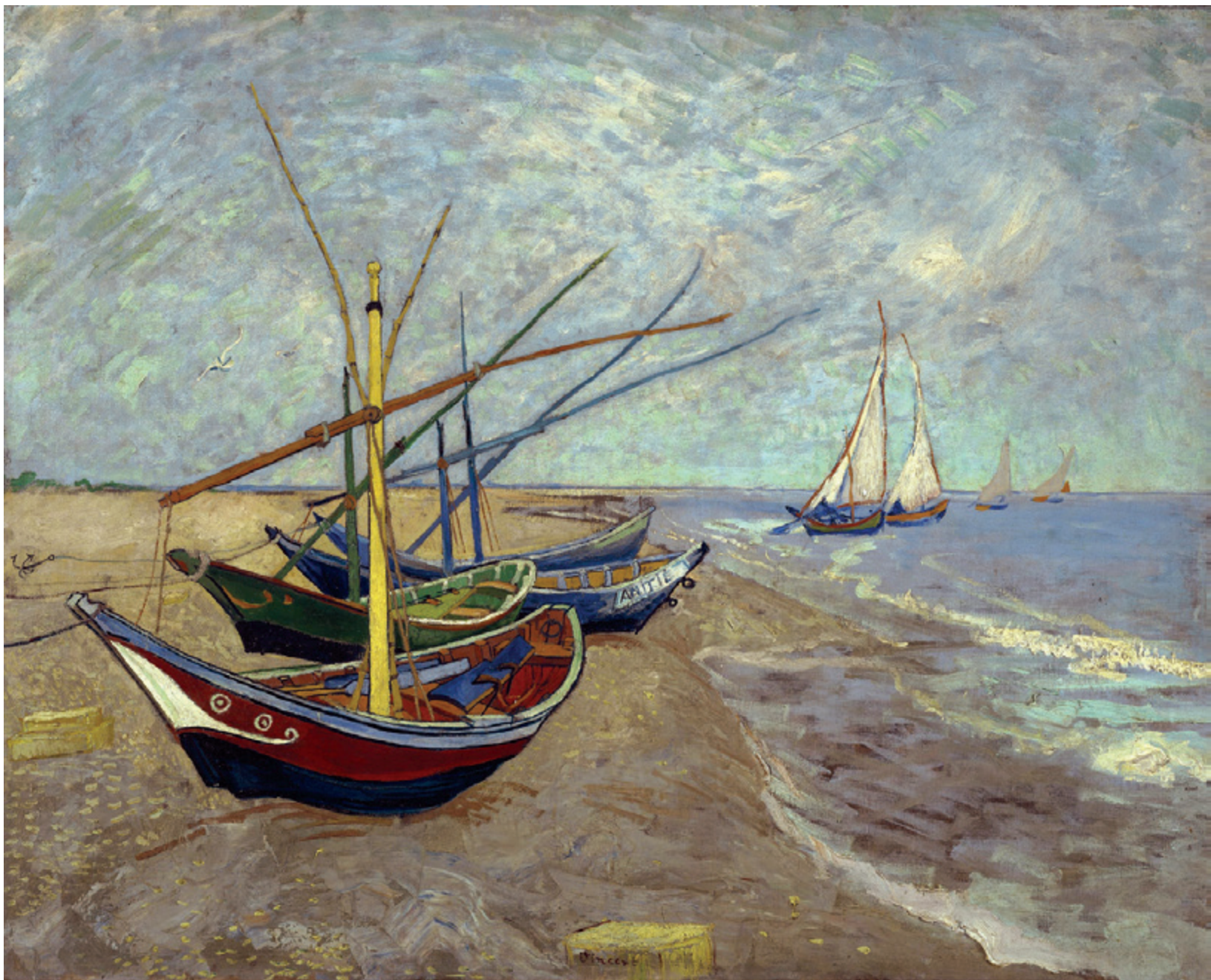
《在圣马迪拉莫海边的渔船》

1888年6月，凡·高完成了几幅以渔船为画题的作品。他把眼睛所捕获的色彩鲜丽的渔船，清晰地画在前景，省略其他部分来暗示远方，让人感到这是采用了日本版画中扩大空间的手法。在细部的省略与夸张的变形中，突出了空间上的深度。