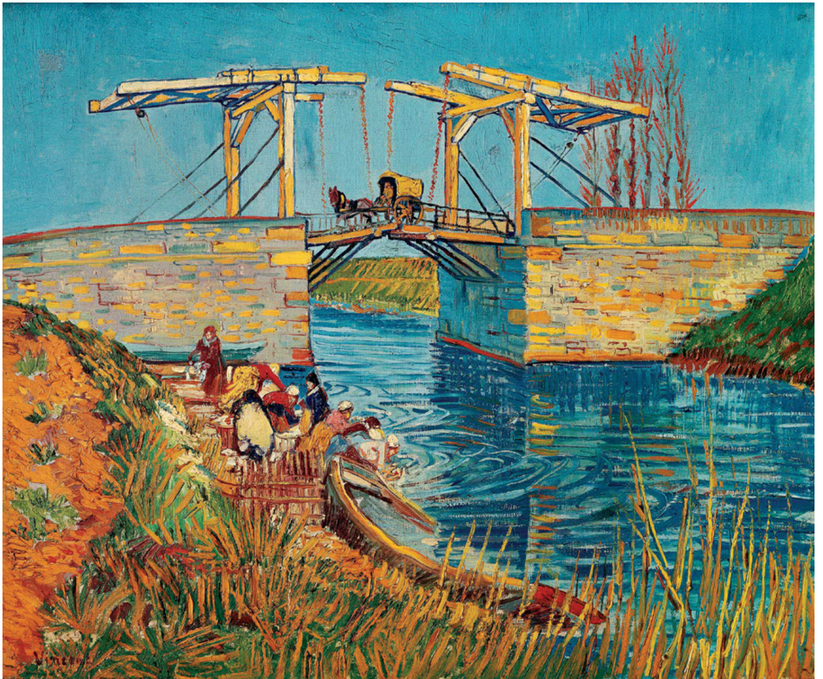
《阿尔勒吊桥边洗衣的妇人》

凡·高画了很多以桥为主题的作品，他仔细观察蓝天和四周生机盎然的景物在河水中的倒影，千方百计地表现河水的清澈透明。画家从河对岸描绘了这幅景致。这幅画可以说是凡·高的色彩实验，画家大量使用蓝、橙补色，整张画在三原色调的展现下，达到画面平衡和谐的效果。光影的感觉在画中不太明显，全然以颜色为主导。笔触纵横交错，细致入微，赋予作品浓郁的日本风格。