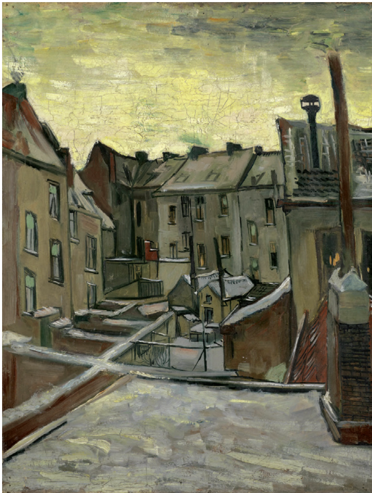
《安特卫普屋顶的雪景》