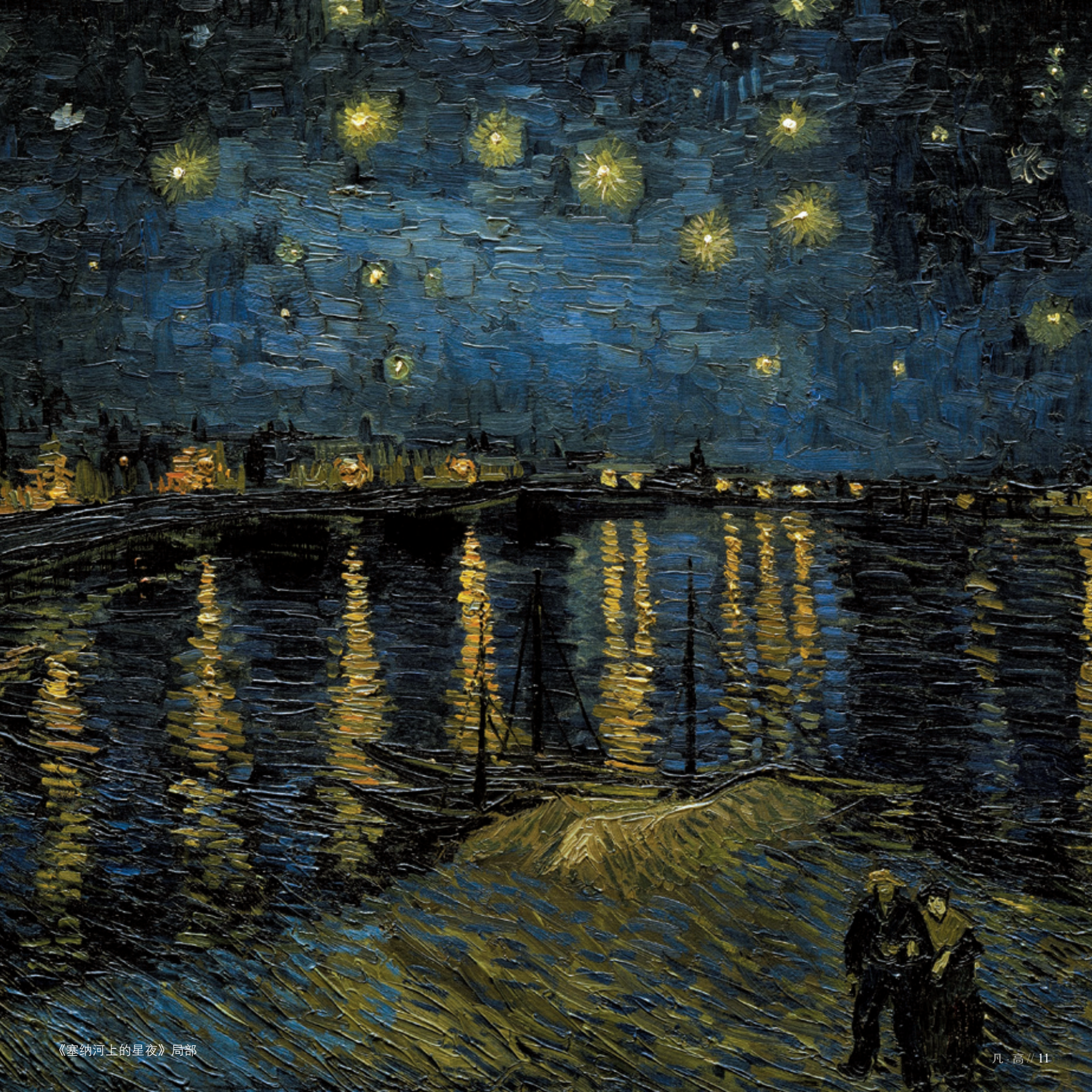
《塞纳河上的星夜》局部