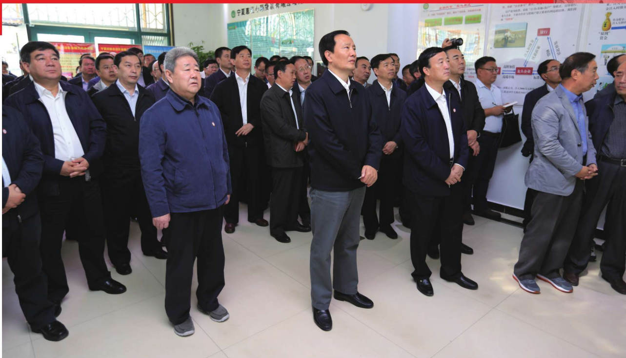
2015年9月19日，自治区党委书记李建华（前左二）到吴忠调研金融扶贫工作