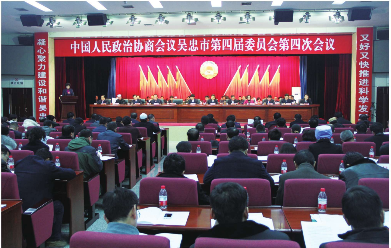
2016年1月18日，政协吴忠市第四届委员会第四次会议召开