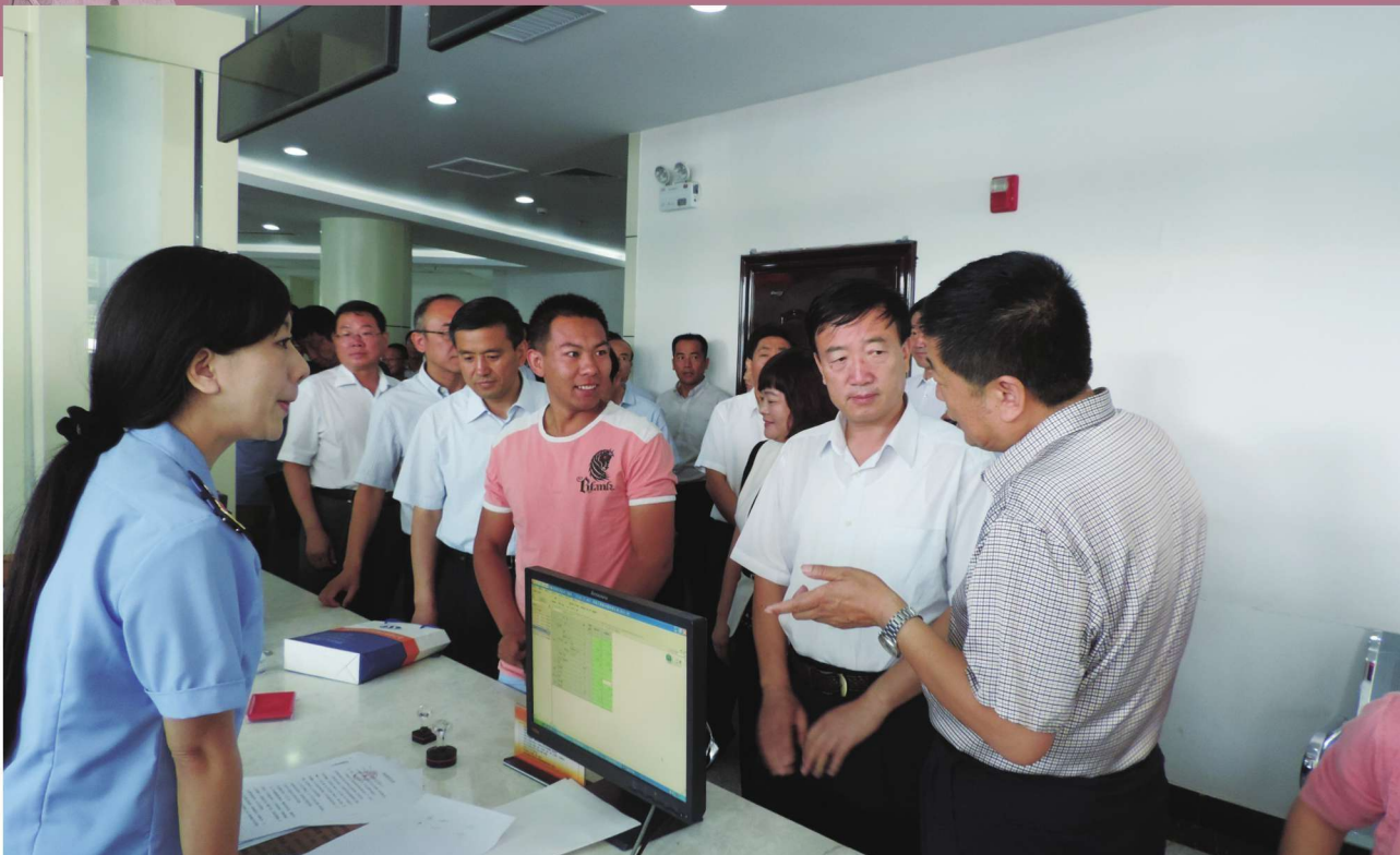
2015年7月10日，吴忠市委书记赵永清（右二）调研政务服务工作