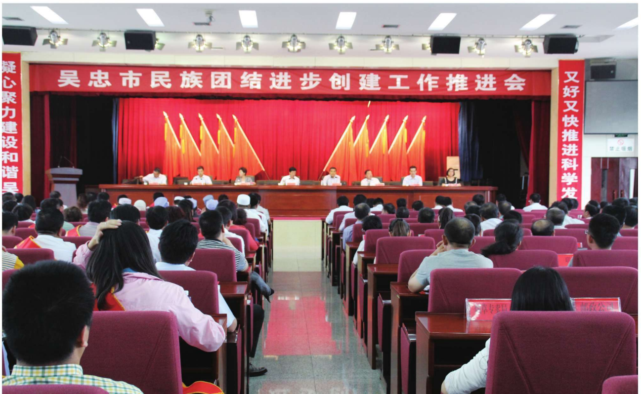
2015年6月23日，吴忠市召开民族团结进步创建工作推进会