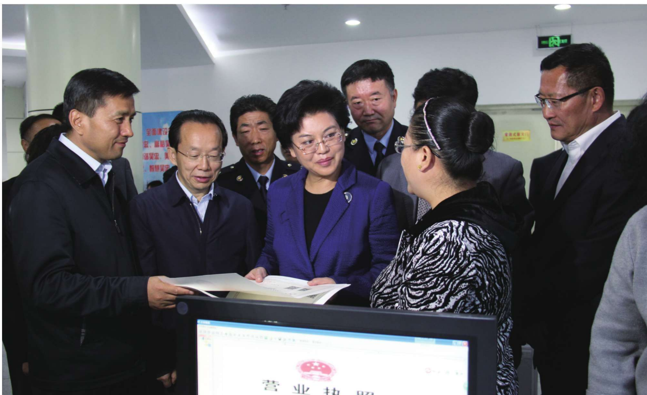
2015年10月14日，自治区主席刘慧（前左三）在吴忠市政务服务中心调研