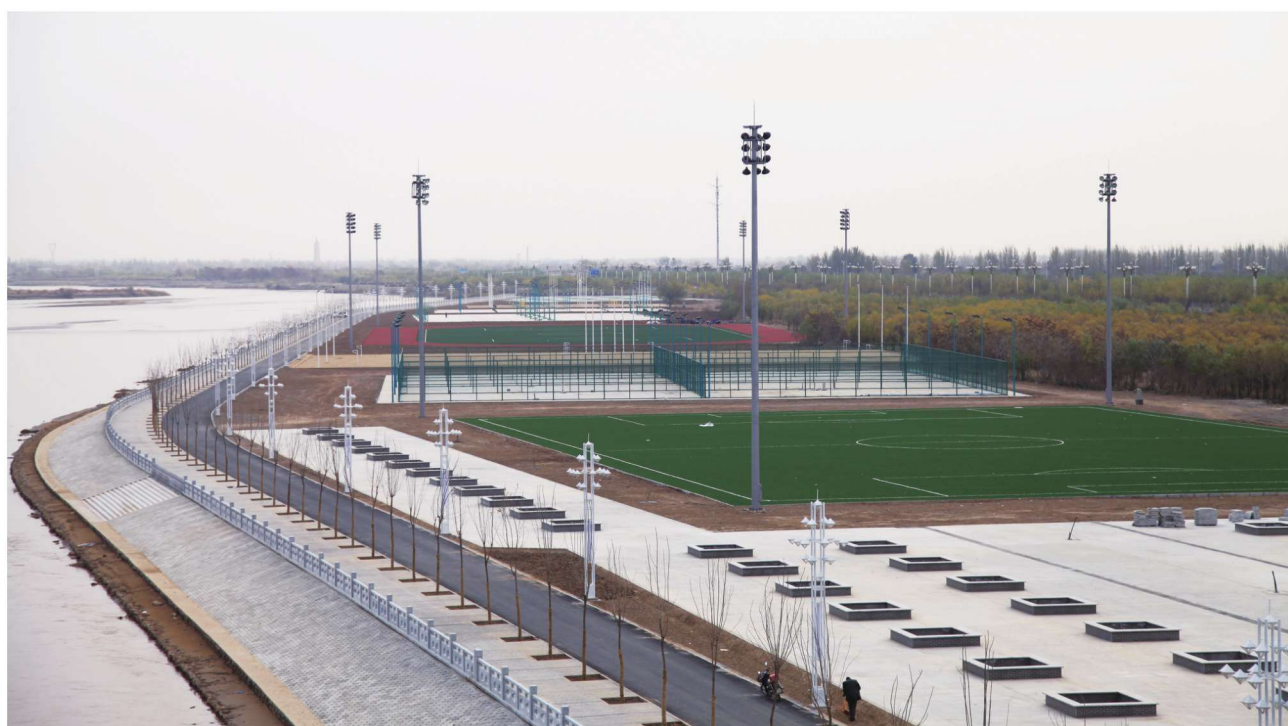
滨河体育运动公园