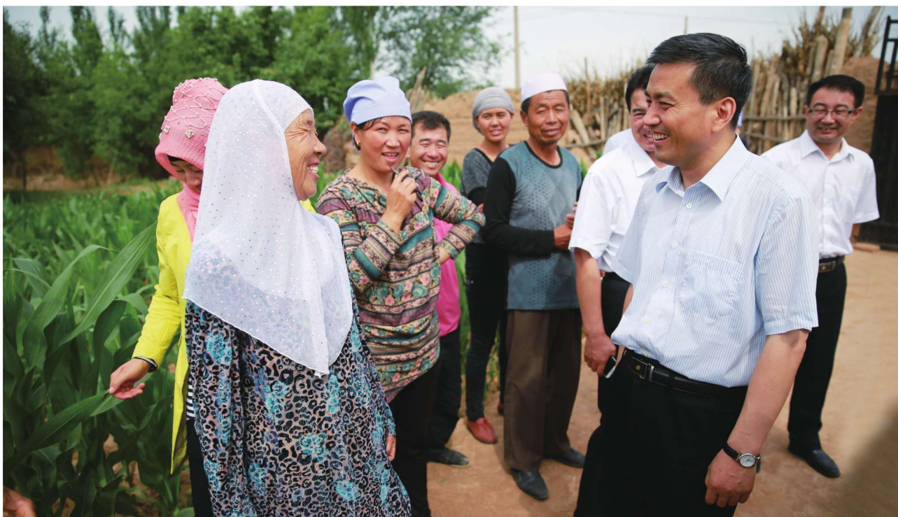
2015年6月29日，吴忠市市长喜清江（右二）调研扶贫工作