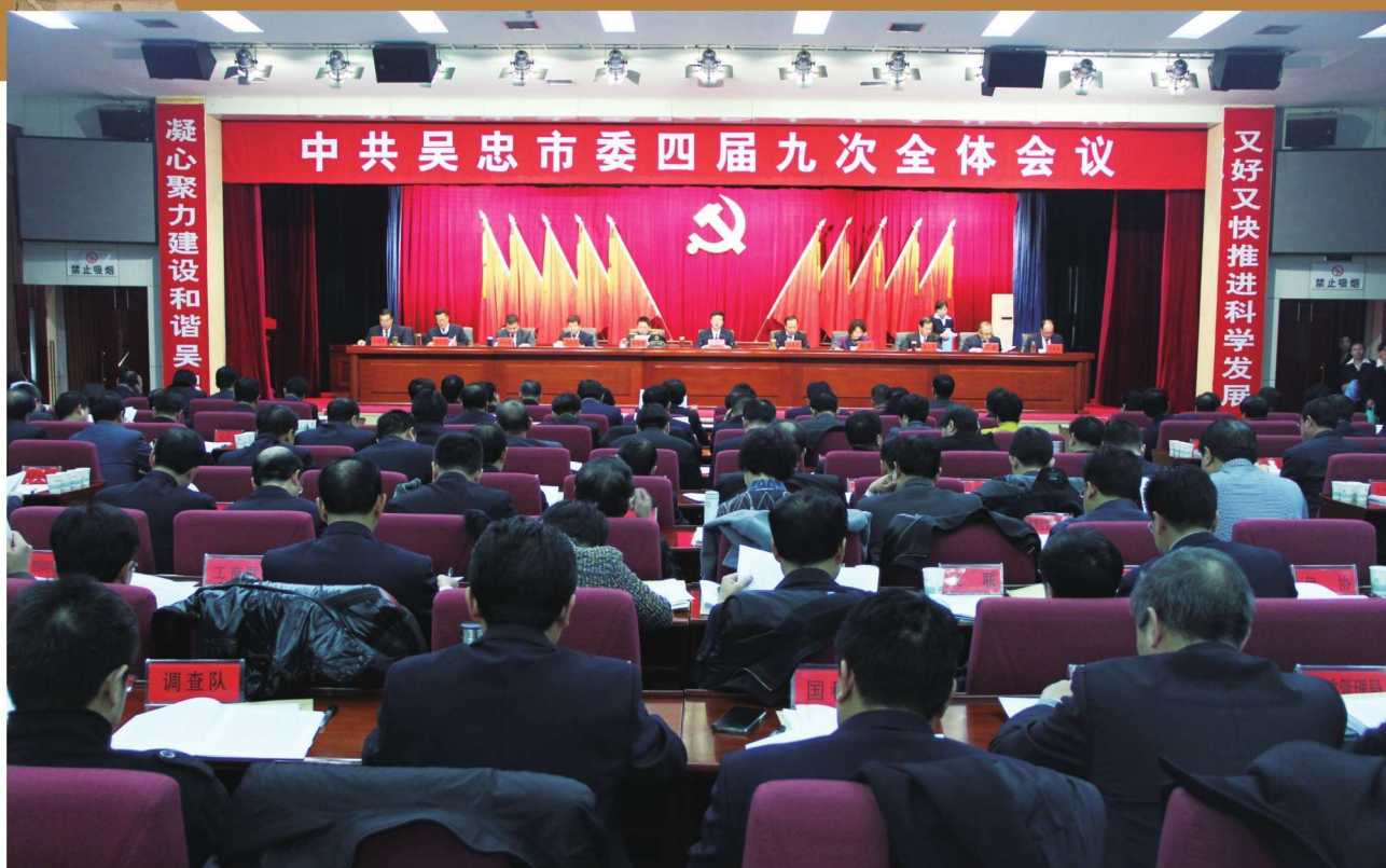
2016年1月4—5日，中共吴忠市委四届九次全体会议召开