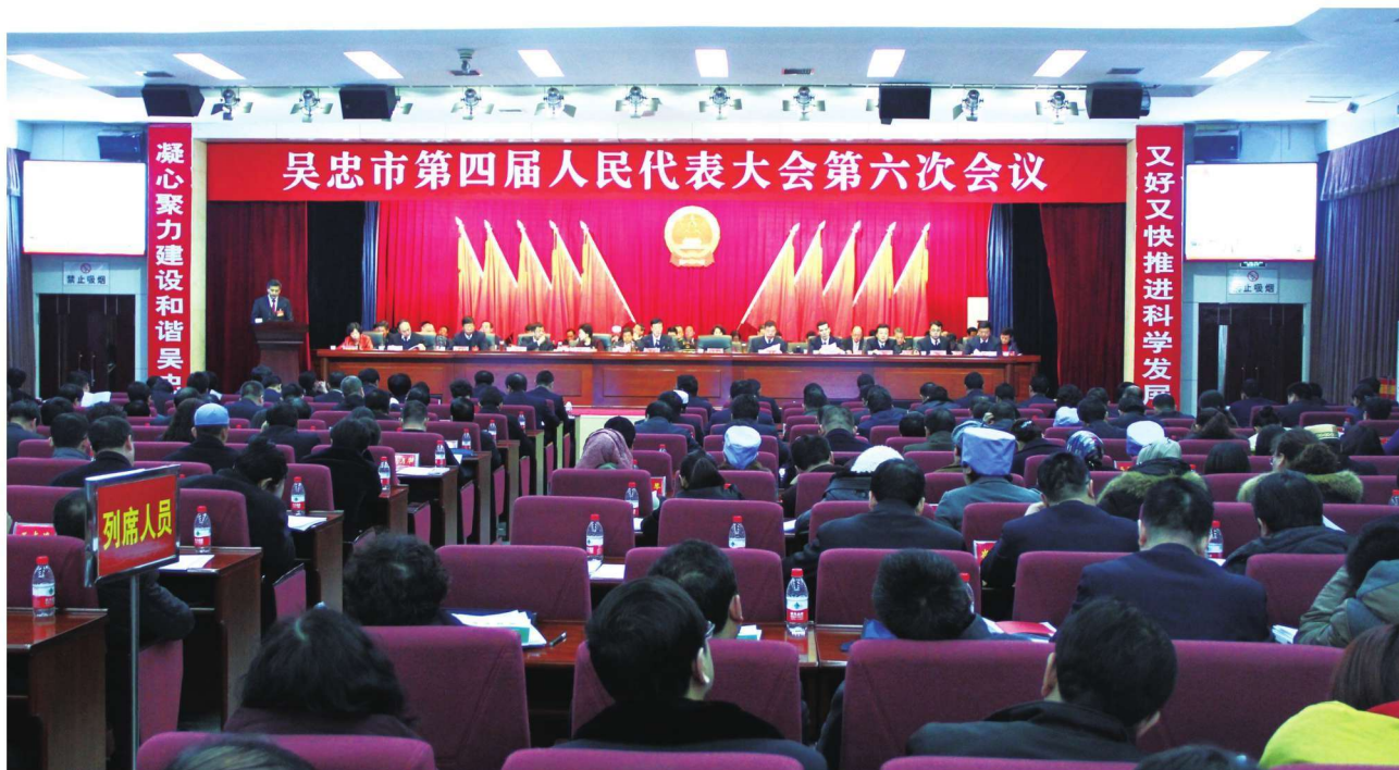
2016年1月19日，吴忠市第四届人民代表大会第六次会议召开