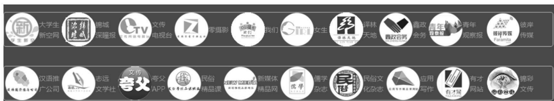
图 1-1 部分仿真实训平台 LOGO

年观察报》为代表的深度报道纸媒，以《文传电视台》为代表的广播电视媒体，以《夸父网》《四川民俗虚拟博物馆》为代表的网站媒体、以《零摄影》《儒学》为代表的电子杂志和以《锦彩文传》为代表的微信公众号等全媒体矩阵。部分仿真实训平台 LOGO 见图 1-1。