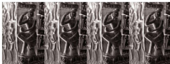
第 9 窟前室明窗东侧佛教因缘故事“髑髅仙因缘”（隔窗组合）