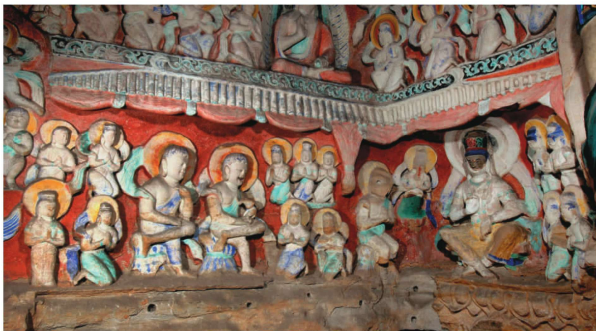
第9窟后室南壁及西壁中层佛教因缘故事“鬼子母寻子因缘”