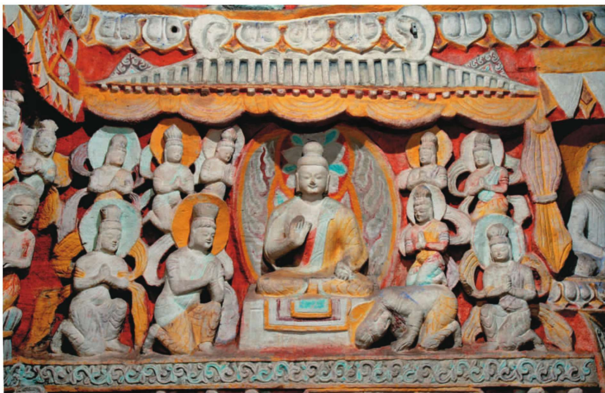
第 10 窟后室南壁东侧第三层佛教因缘故事“吉利鸟因缘”