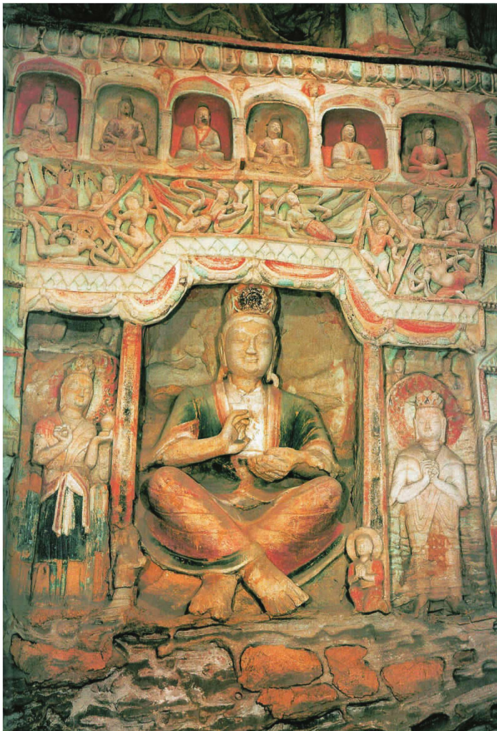
第6窟后室西壁南侧交脚菩萨盂形大龕造像