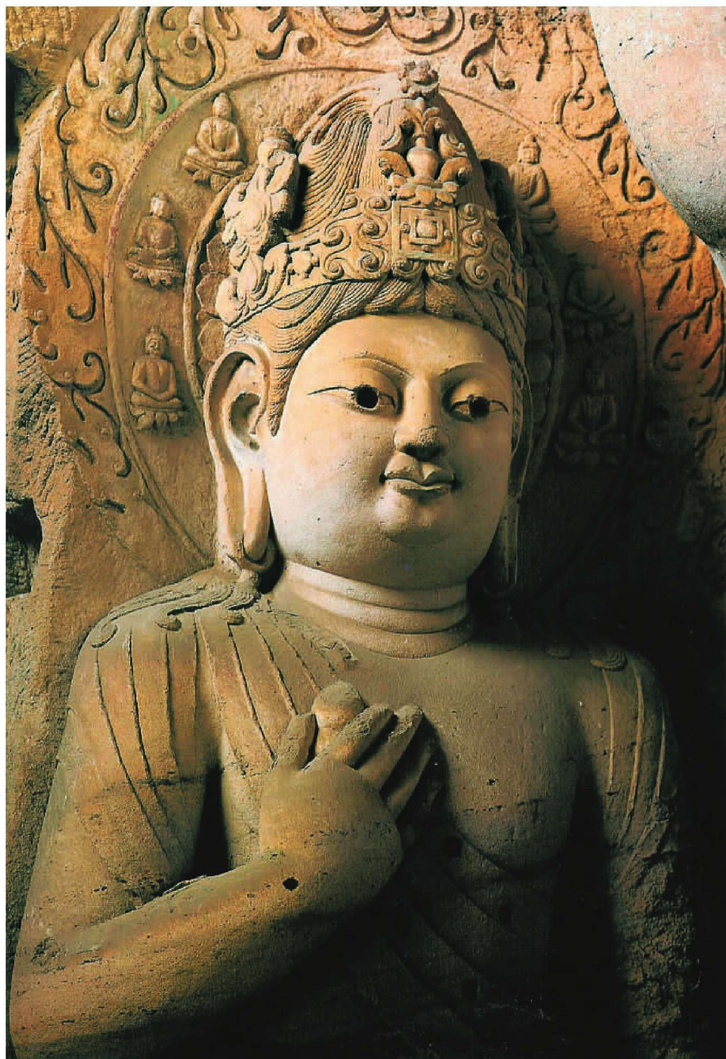
第3窟主室西侧“西方三圣”西侧观世音菩萨