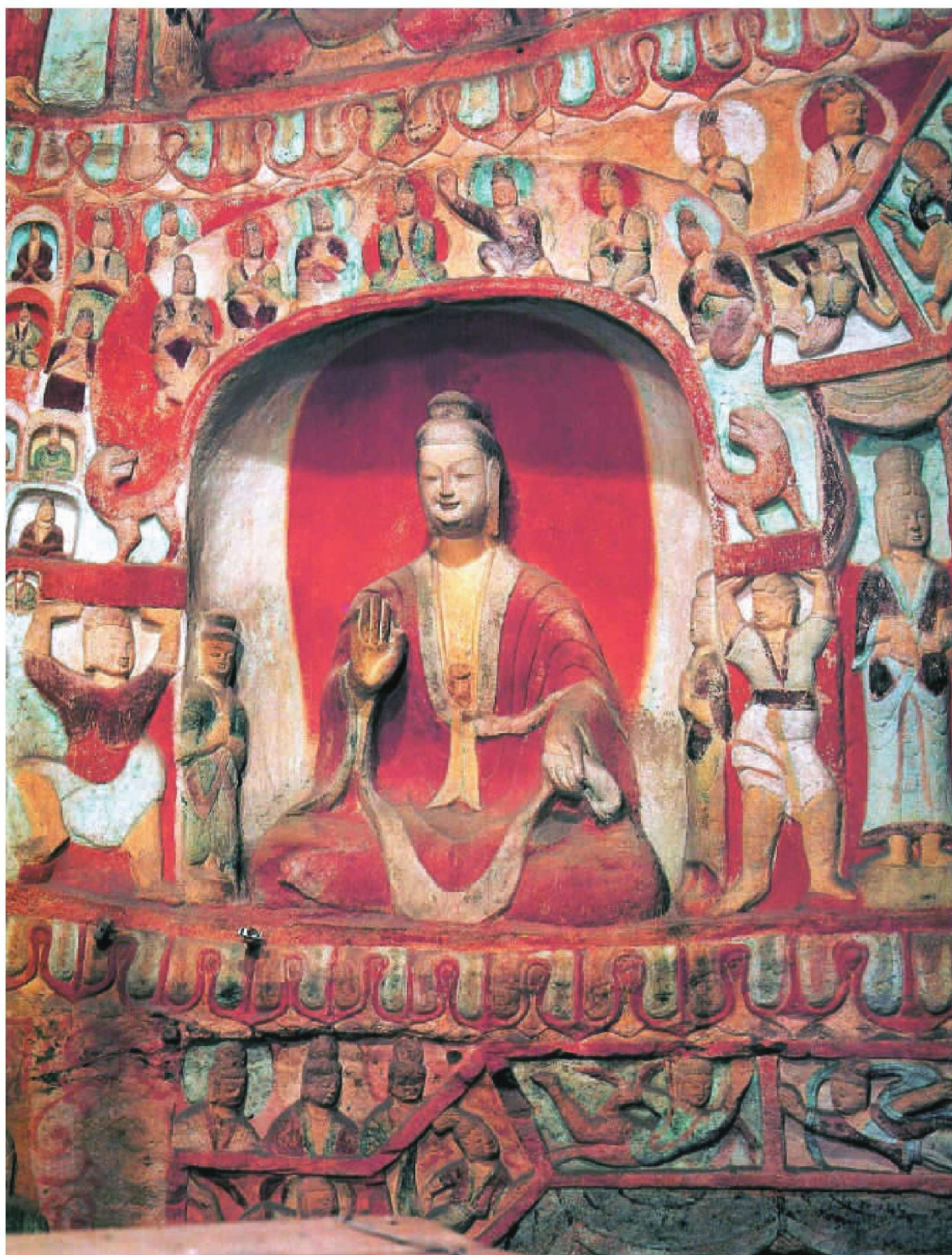
第5窟后室西壁上部“释迦说法”佛龕造像