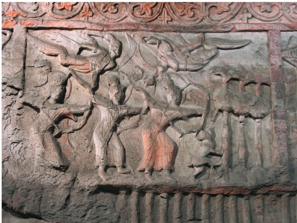
第6窟后室东壁北侧连环佛传故事浮雕“箭射铁鼓”