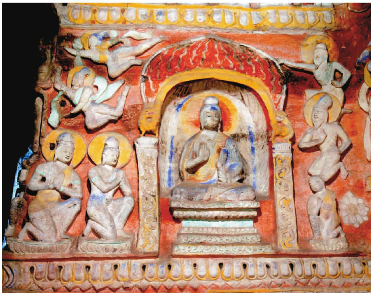
第9窟后室南部西侧上部第四层佛本生故事“尼乾子投火因缘”