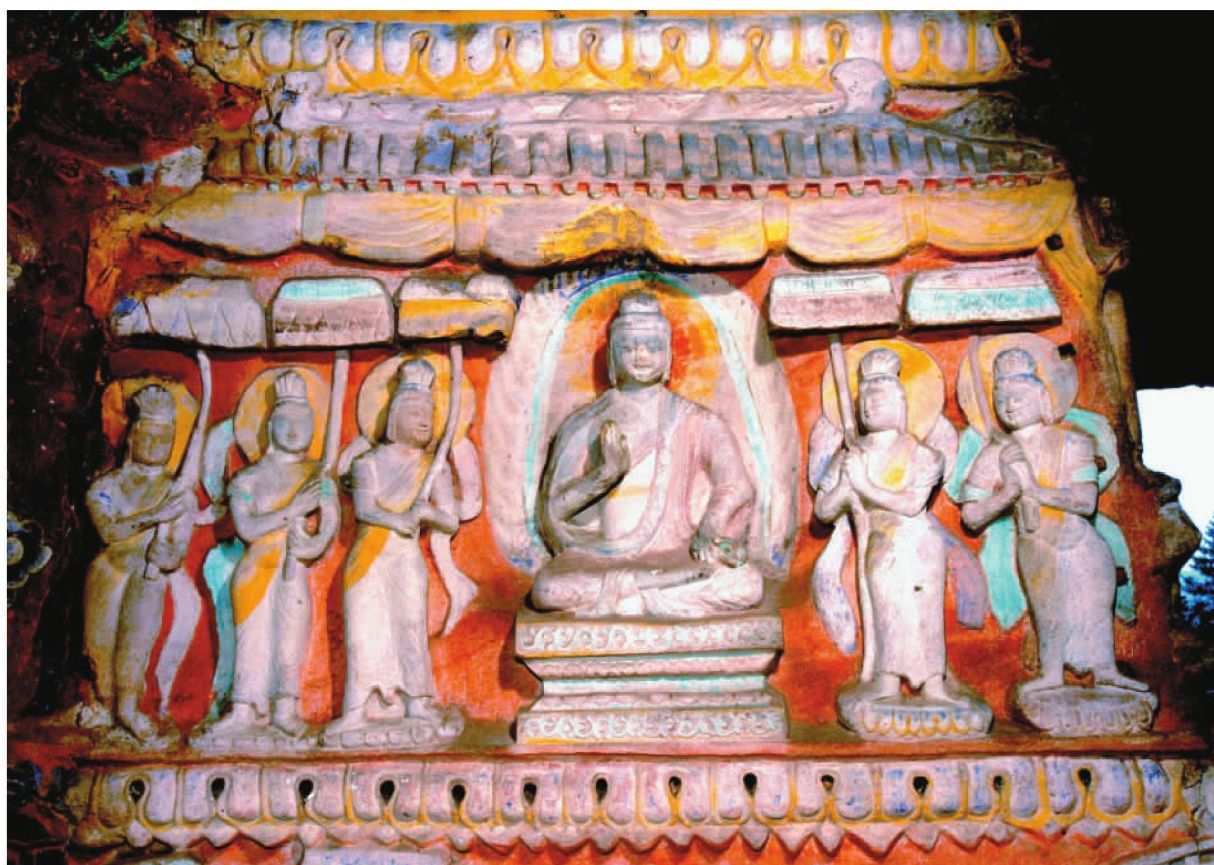
第9窟后室南壁拱门东侧上部第四层佛教因缘故事“天女华盖供养因缘”