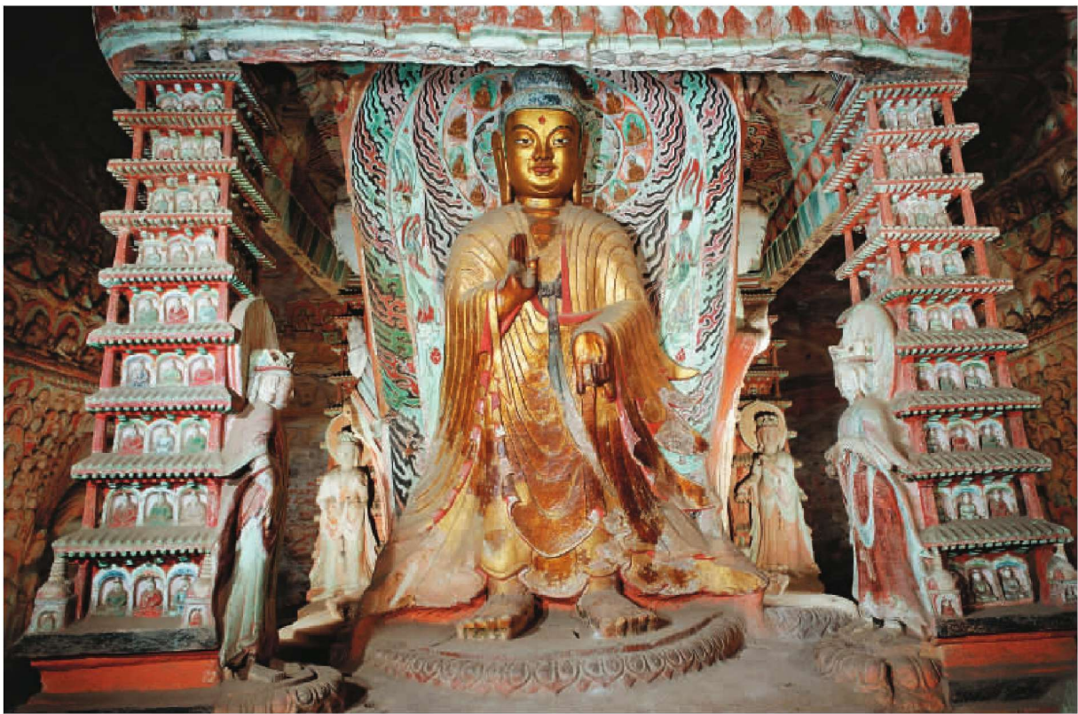
第 6 窟后室中心塔柱上层南侧雕刻