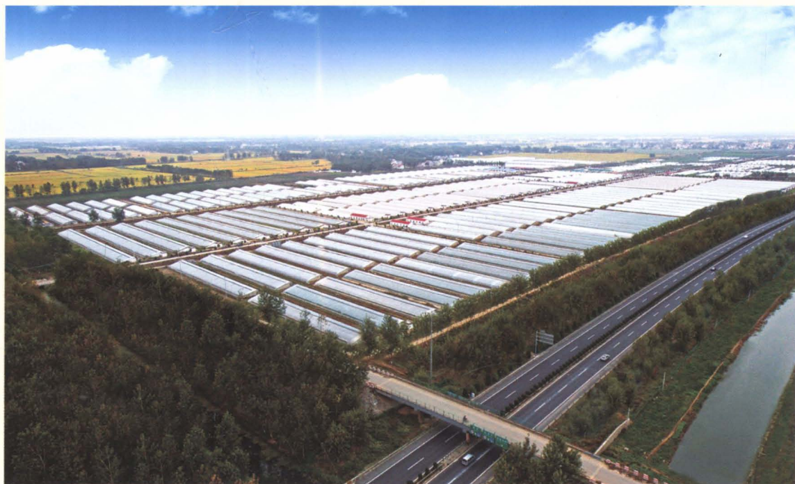
灌云现代农业产业园