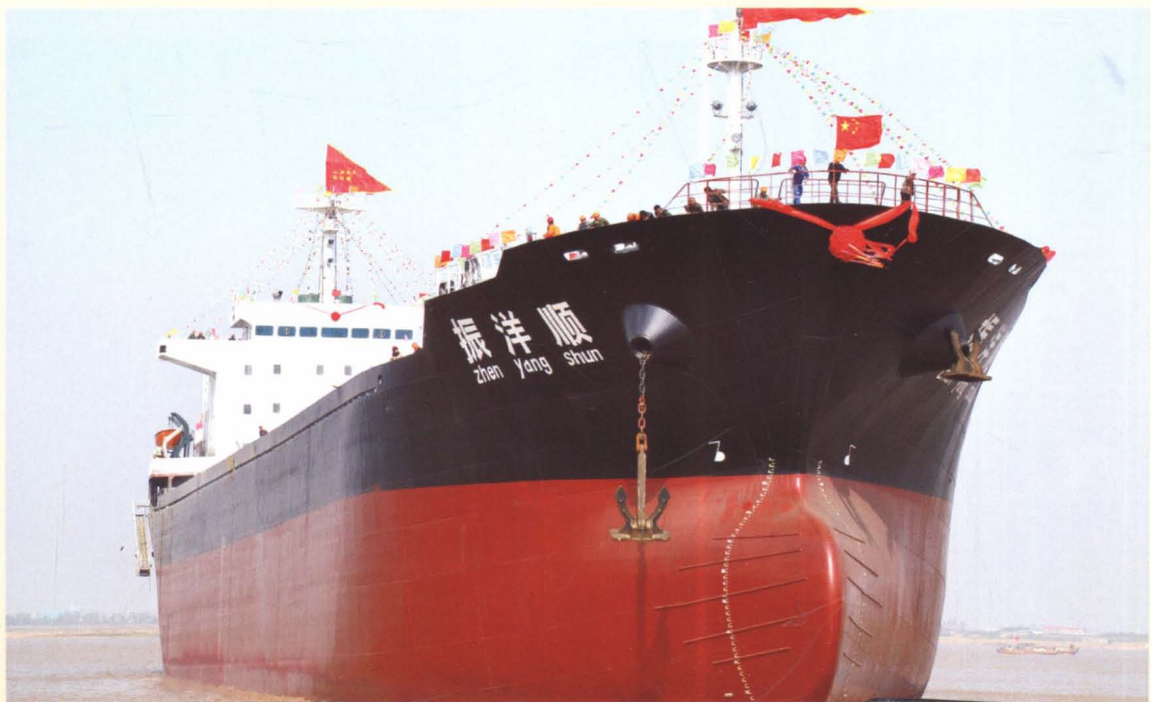
万吨远洋货轮振洋顺号下水试航