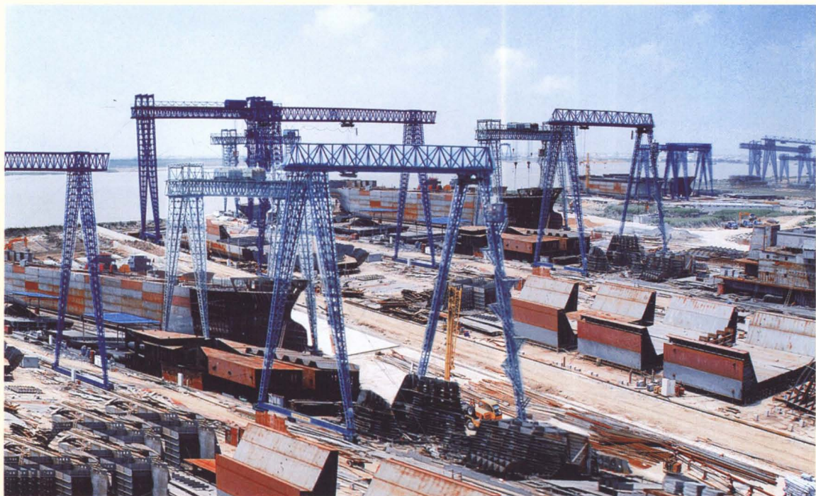
县临港产业区船舶工业园