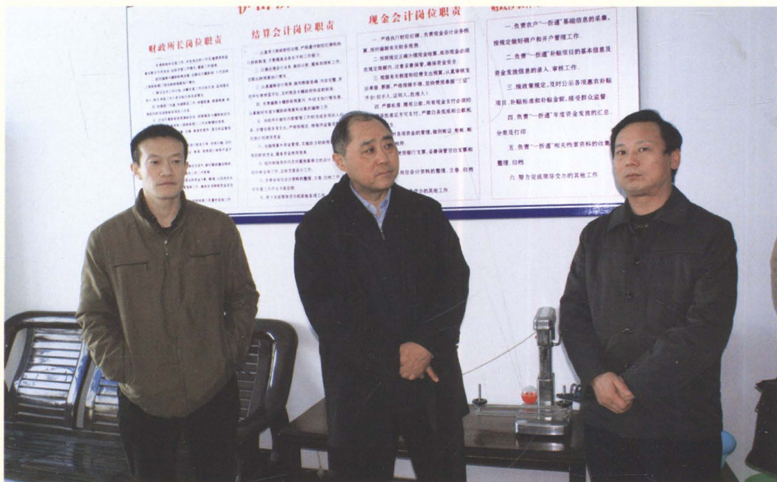
江苏省财政厅副厅长黄晓平(中)到灌云调研基层财政工作