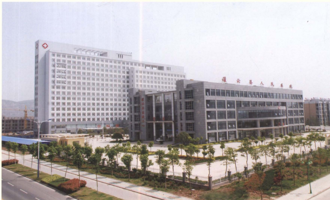
灌云县人民医院（新院址）