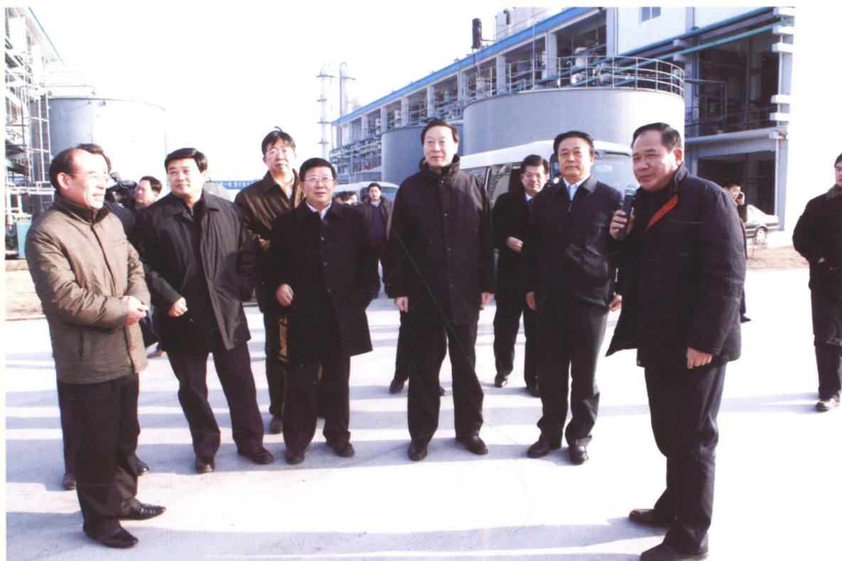
中共江苏省委书记罗志军(前右三)到灌云考察