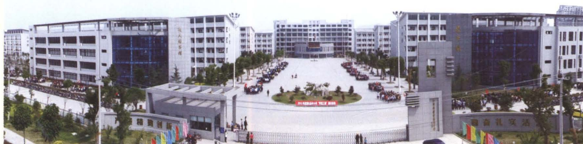
江苏省灌云高级中学（新校区）