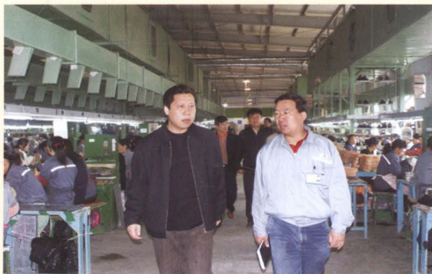
县财政局领导在开发区企业调研