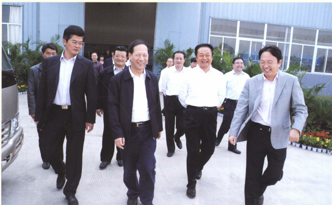
中共江苏省委副书记石泰峰(前左二)到灌云调研