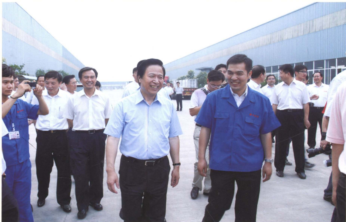
中共江苏省委原书记梁保华(前右二)到灌云县经济开发区调研