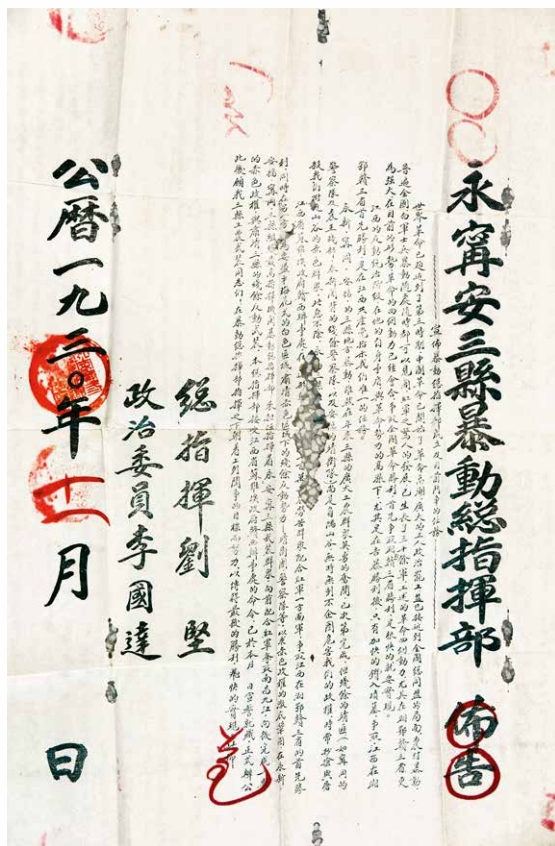
△永、宁、安三县暴动总指挥部布告。