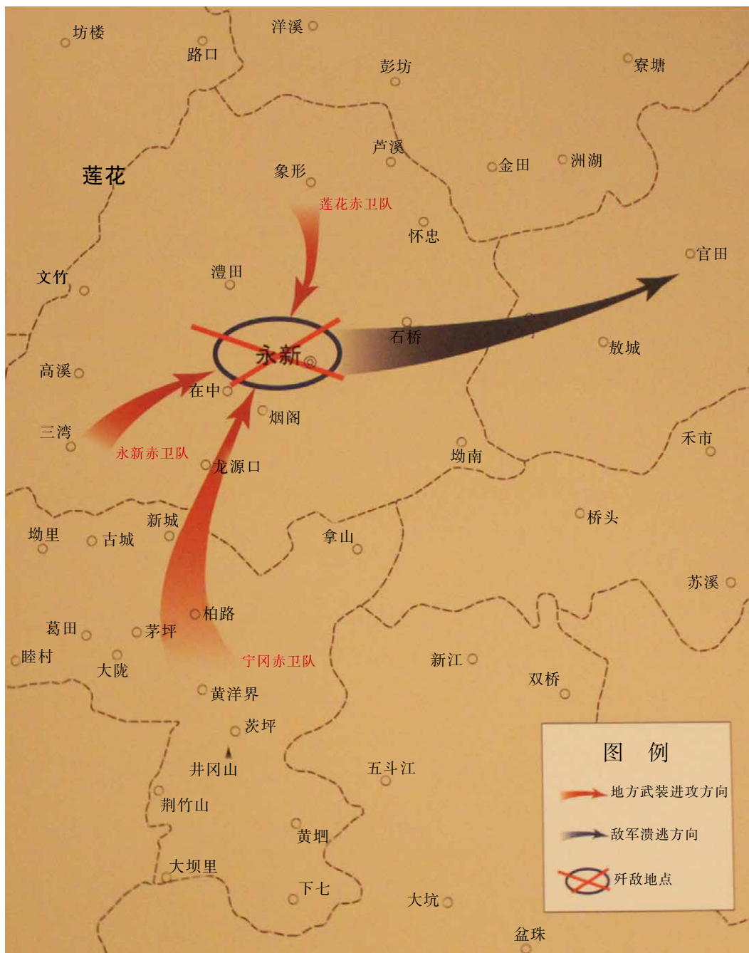
△攻克永新城示意图。