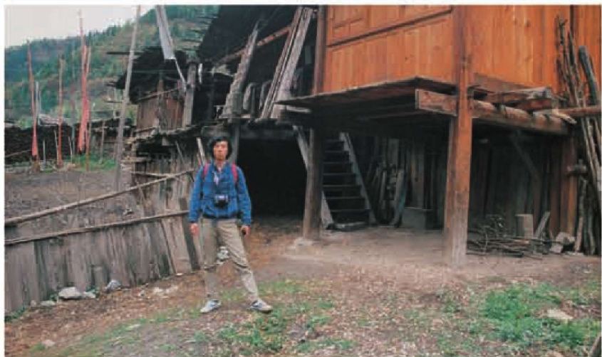
黄河考察于九寨沟