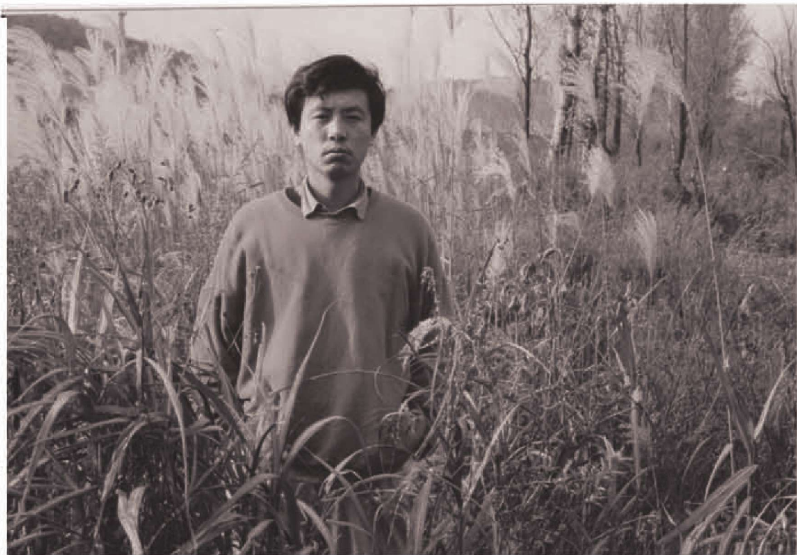
上山下乡插队落户农村期间