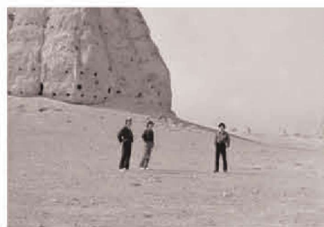
黄河考察于西夏王陵