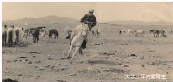
大学二年级内家写生