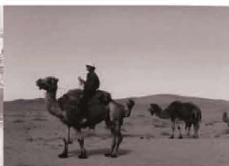
黄河考察于丝绸之路