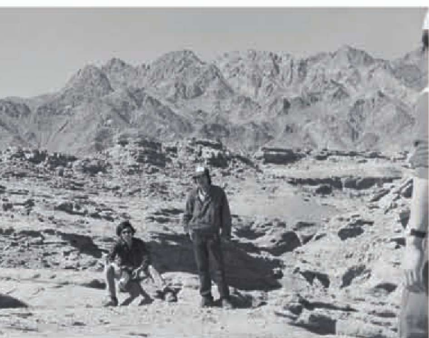
考察阴山狼山岩画