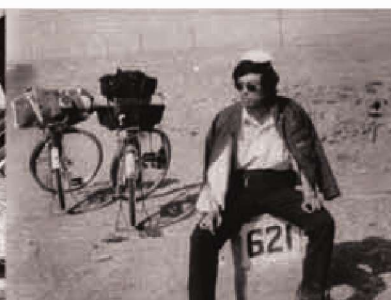
黄河考察丝绸之路