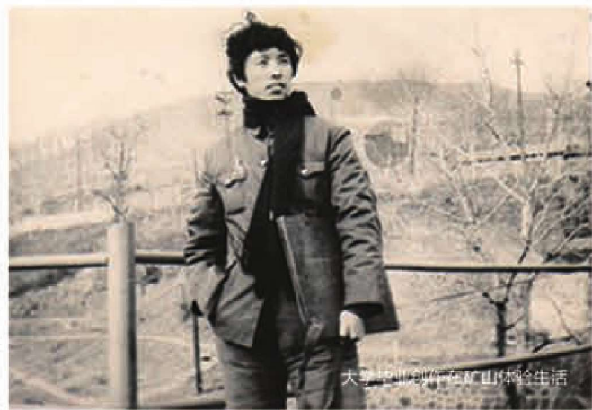
大三登山创作在祁山体验生活