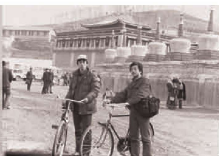
黄河考察于塔尔寺