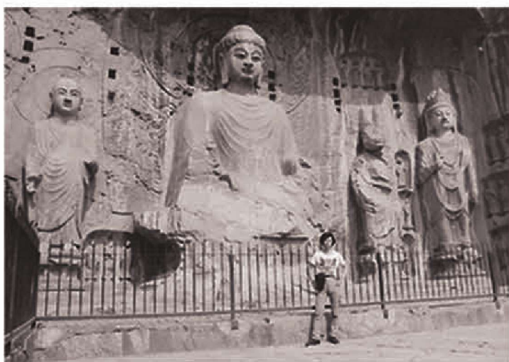
黄河考察龙门石窟