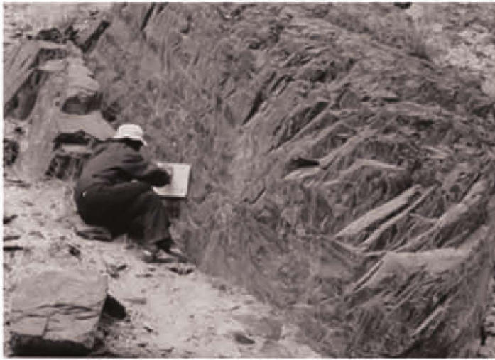
考察嘉峪关黑石峡岩画