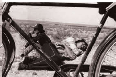
横穿乌兰布和沙漠