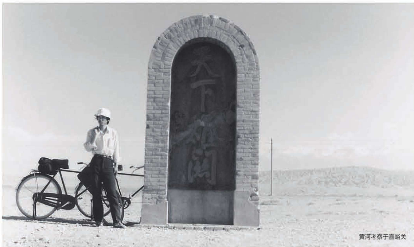
黄河考察于嘉峪关