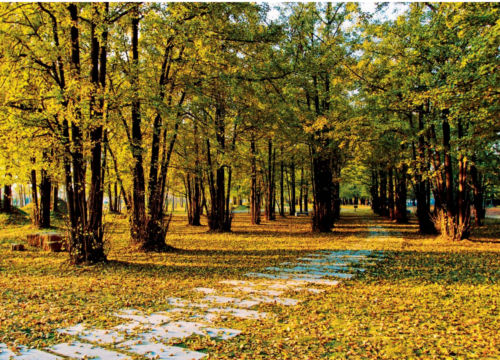
古银杏群落——生生园