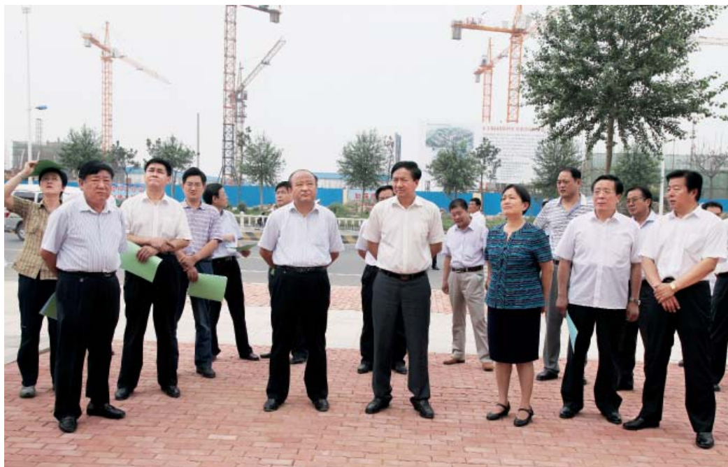
2011年7月14日，国家住房和城乡建设部副部长齐骥来临沂，就城乡建设、保障性住房等情况进行调研。省政府副秘书长张传亨，省住房和城乡建设厅厅长杨焕彩、副厅长吴英，市领导张少军、宋培杰、李作良等陪同。