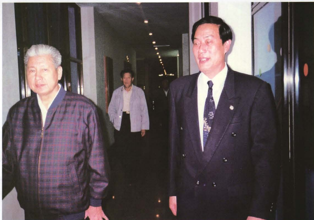
1998年11月，上海市副市长倪鸿福（左一）视察白玉兰度假村服务设施。