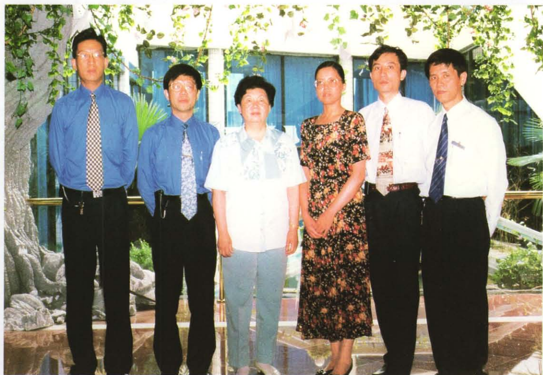
时任上海市人大常委会主任陈铁迪（左三）视察白玉兰度假村。