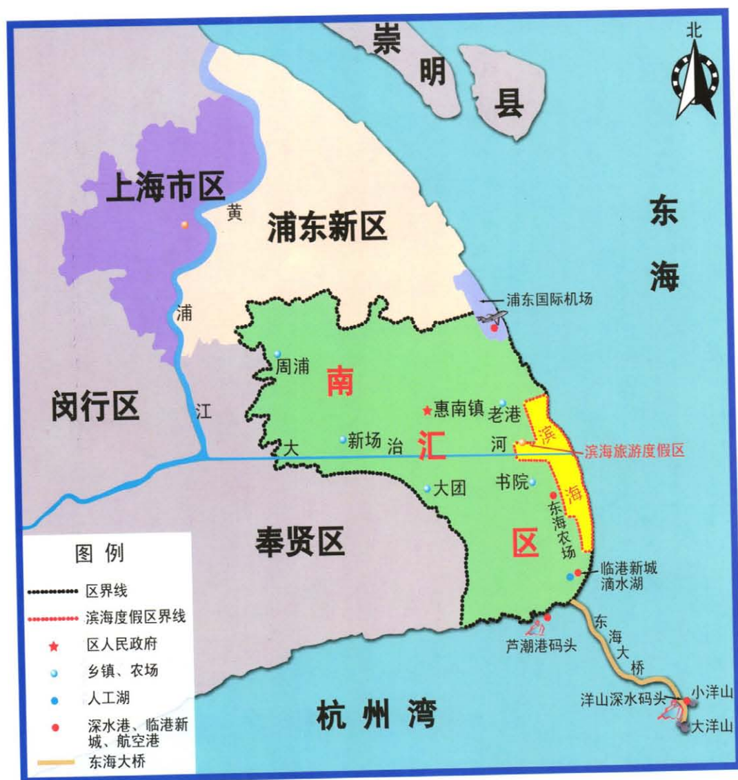
滨海旅游度假区位置图