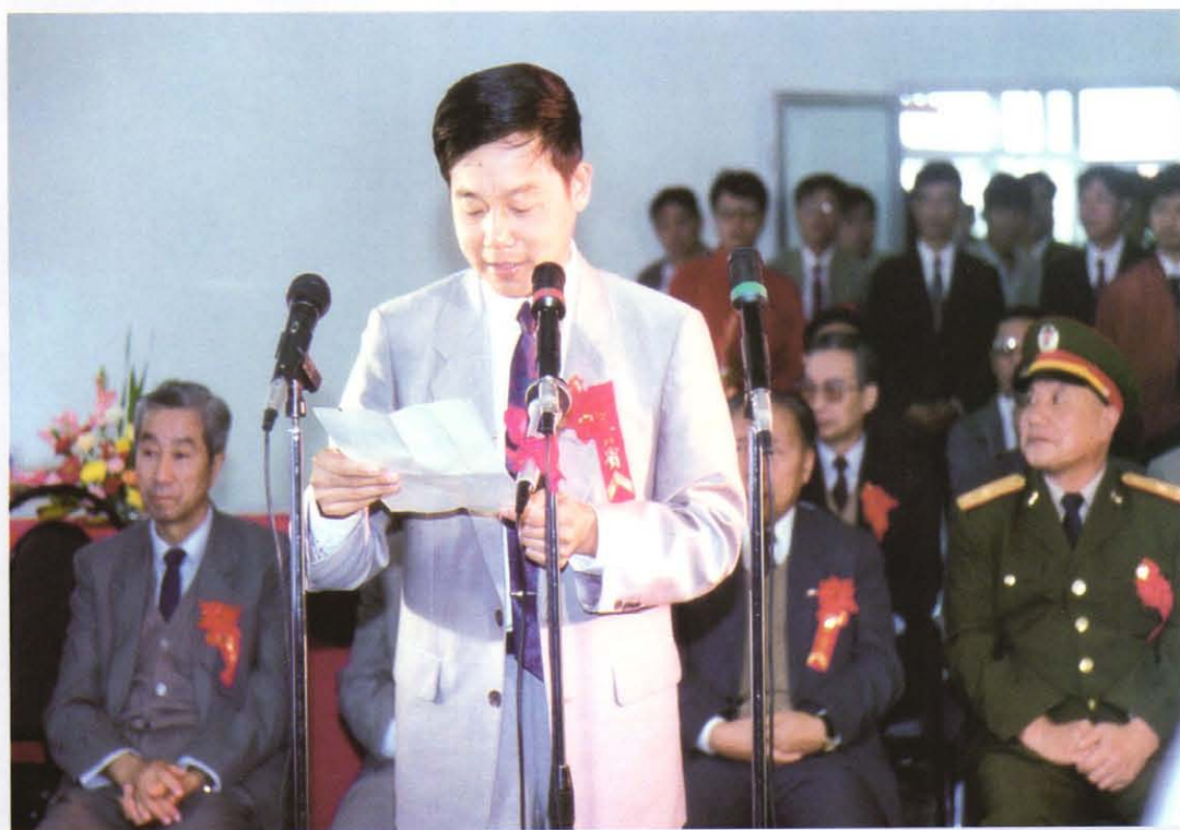
1993年10月，中共南汇县委书记许德明在滨海射击场开张仪式上讲话。