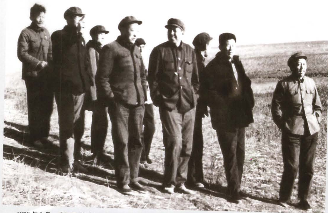
1978年2月，南汇县党政主要领导陪同市农委领导到滨海考察。