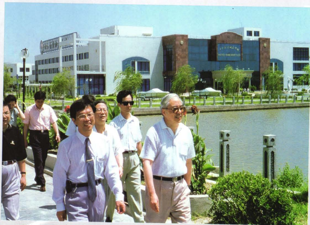
1994年，上海市人大常委会副主任叶公琦（右一）视察白玉兰度假村。