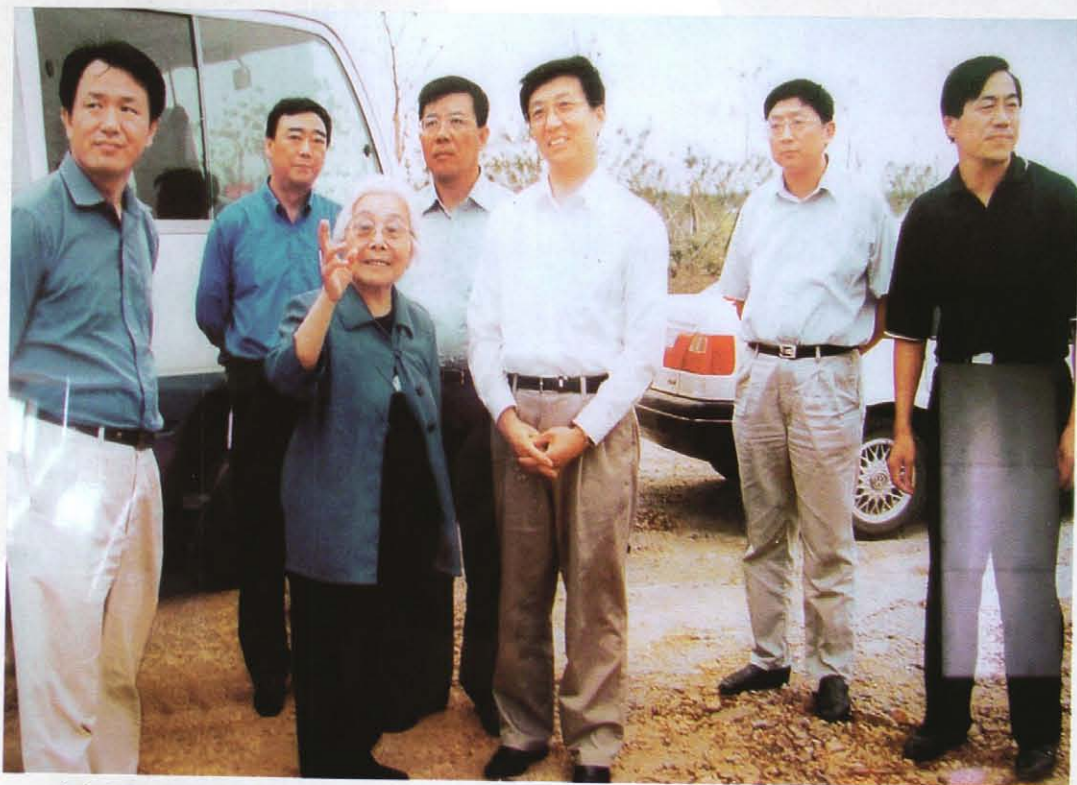
上海市市长韩正（右三）视察森林公园听取汇报。