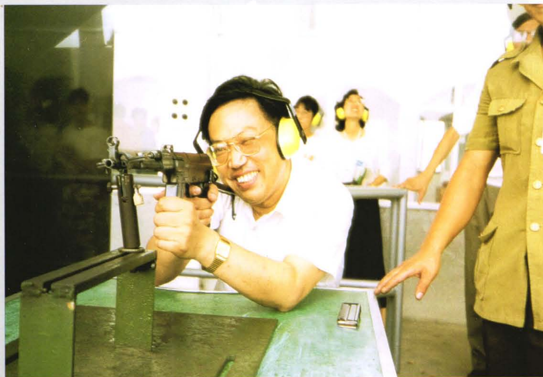
时任上海市副市长蒋以任视察射击场，并亲自试枪。