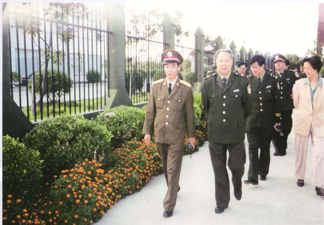
时任上海市公安局局长朱达人（左二）前往射击游乐场检查指导工作。