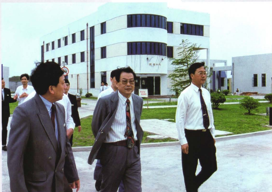
1995年6月，中共上海市委副书记王力平（中）视察白玉兰度假村。