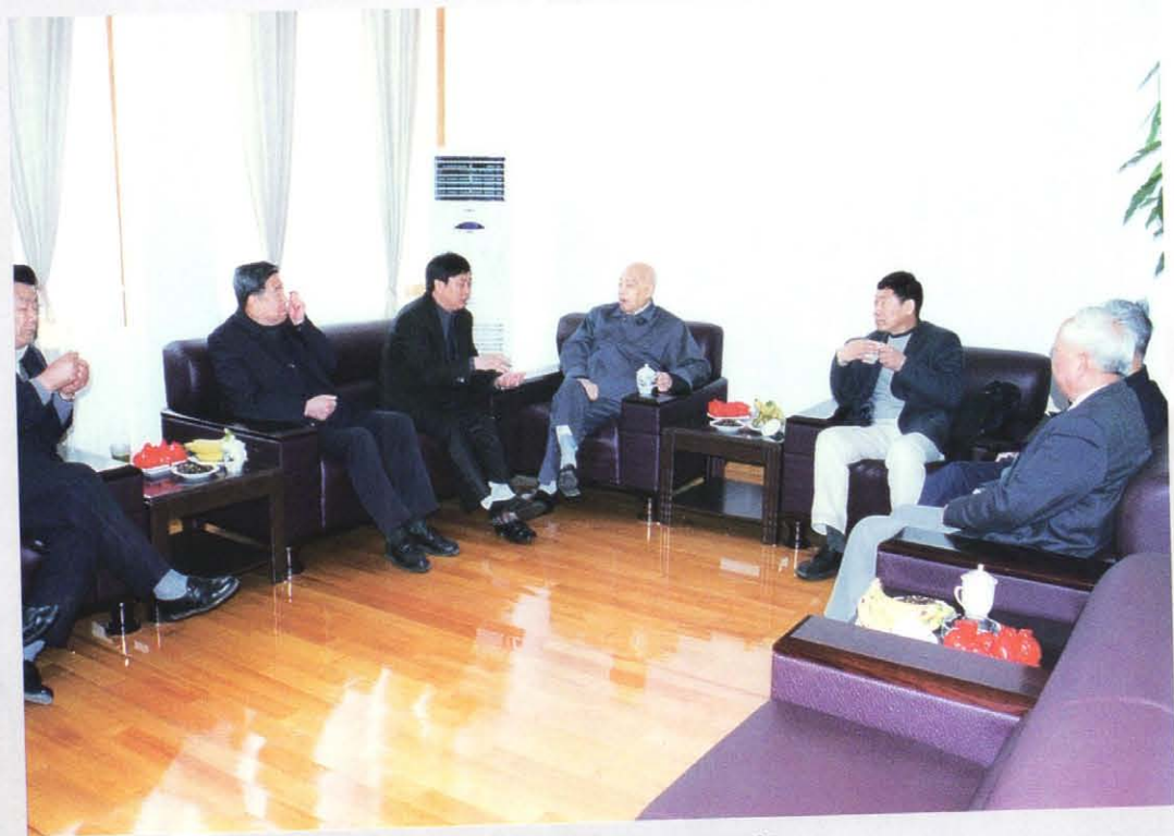
2004年6月，原上海市副市长裴先白（左四）在桃源基地听取汇报。