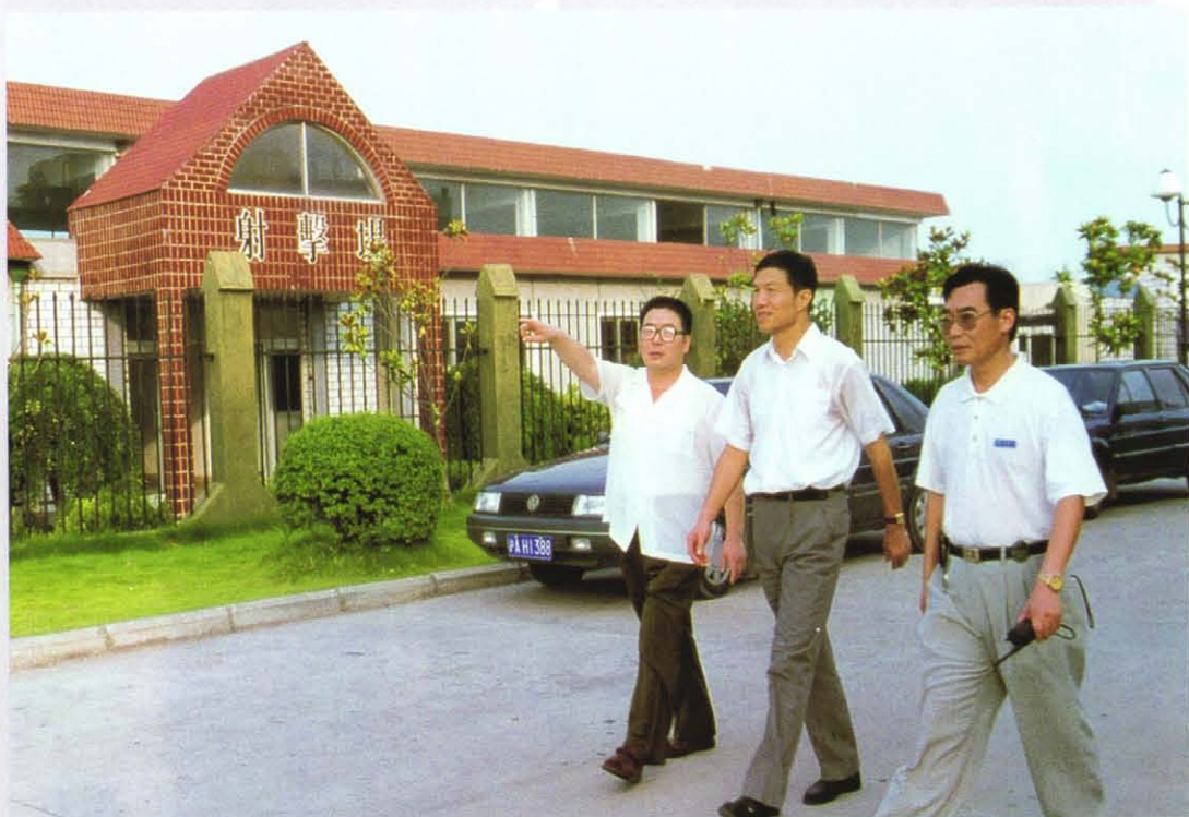
1997年8月，上海市副市长夏克强（中）视察射击游乐场。