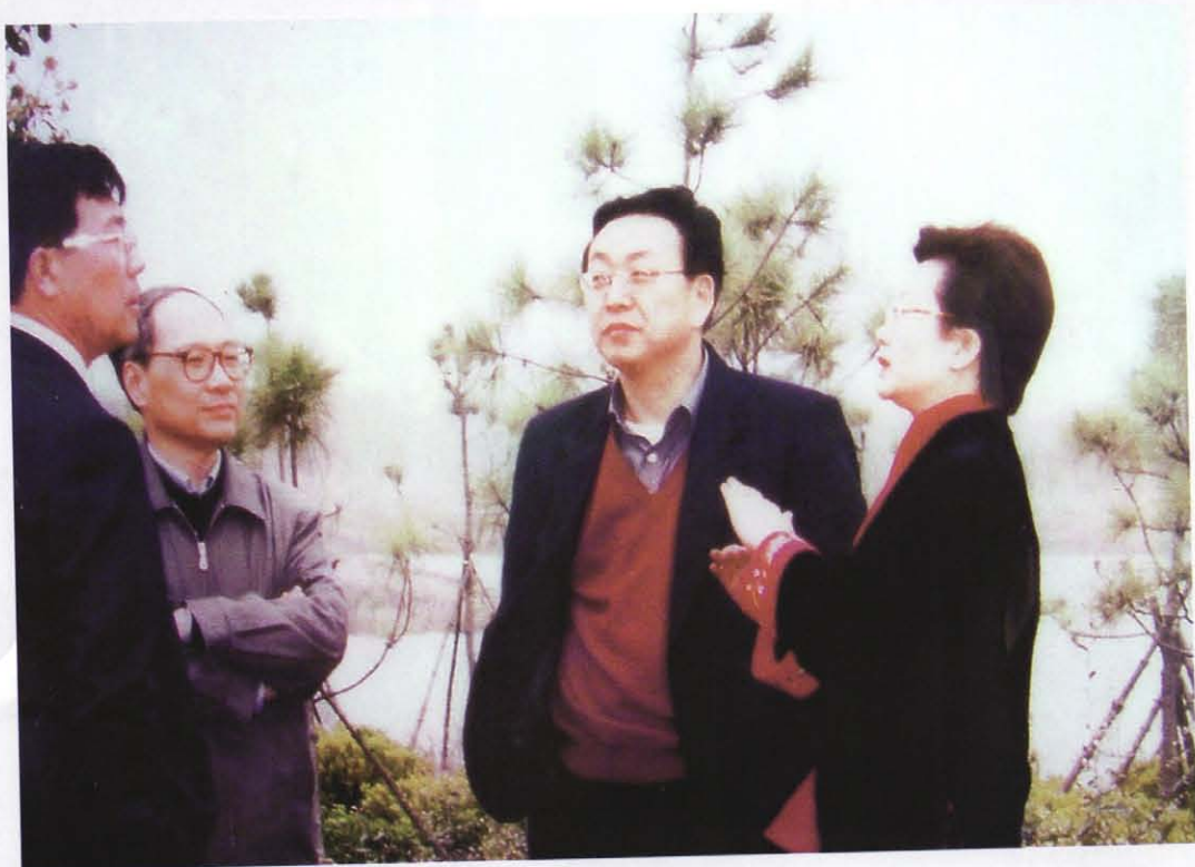
时任上海市委常委范德官（右二）视察森林公园听取汇报。