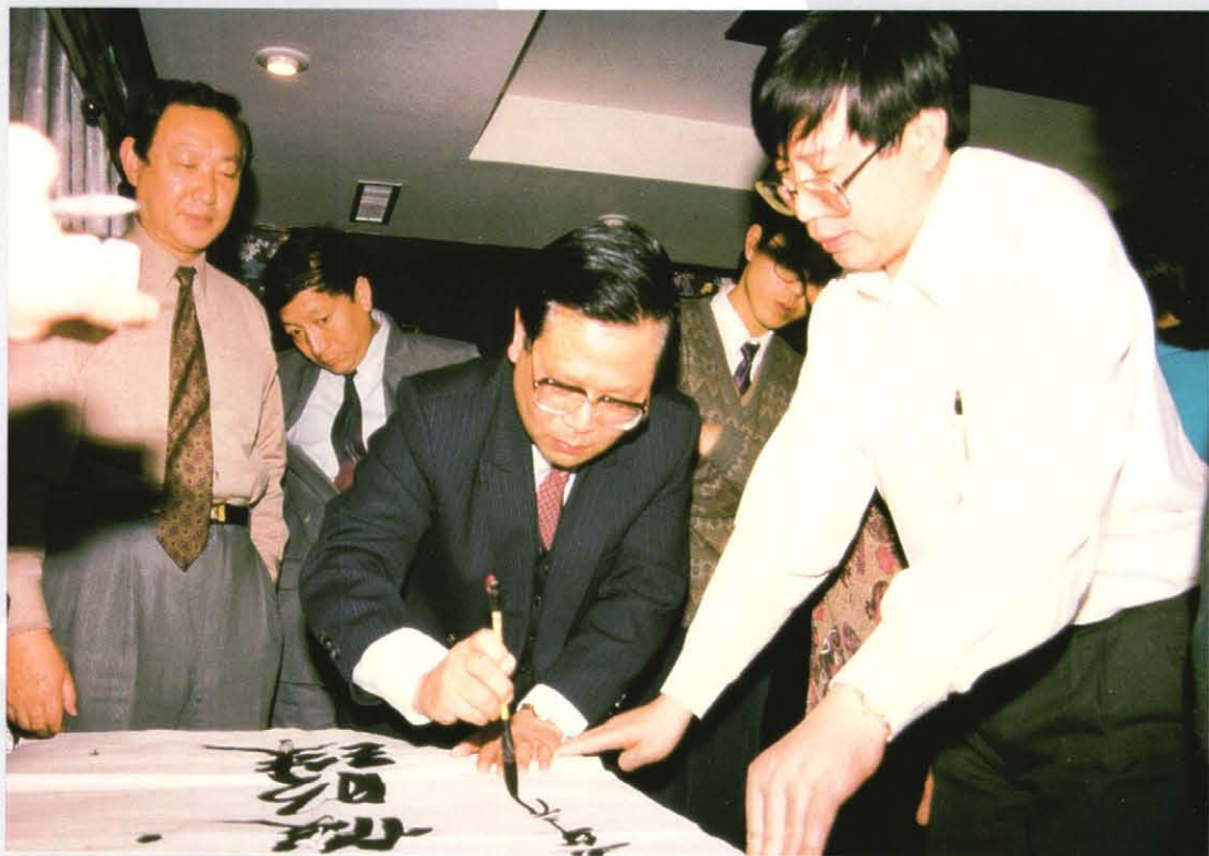
1995年，上海市副市长龚学平视察滨海白玉兰度假村并题字。