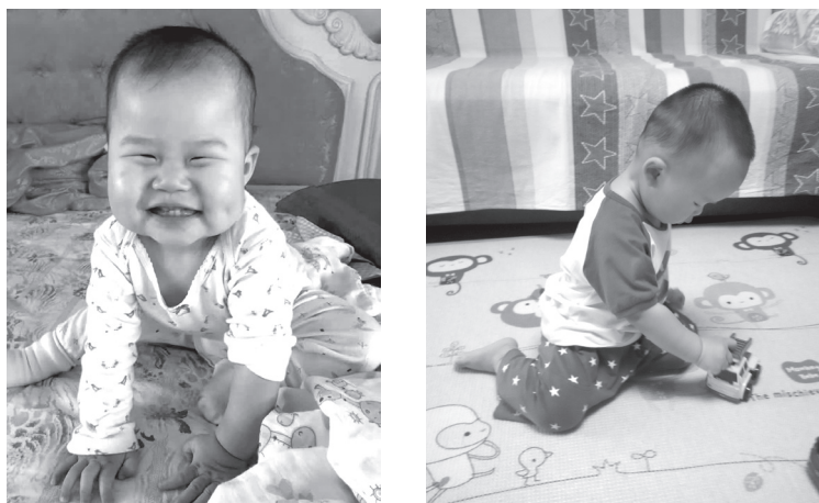
图 1-1 外显行为的表现

行为主义学派如华生、斯金纳等人认为：行为是可以观察、可以测量的外显反应或活动，如婴幼儿的表情、精细动作等（图 1-1），因此可以透过刺激与联结的方式有计划地培养婴幼儿行为。