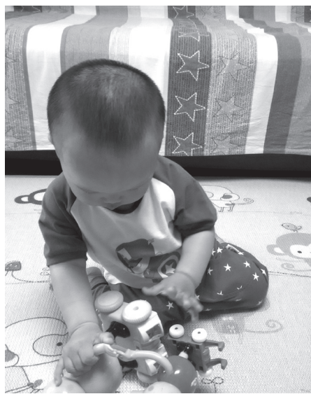
图 1-4 自主游戏中小肌肉的发展

从1岁起，幼儿进入了正式学习语言的阶段，基本规律是先听懂、后会说。1—1.5岁是单词句阶段，意义不明确，语音不清晰，词性也不明确，往往与动作紧密结合；1.5—2岁幼儿的语言形成属于电报句阶段，语句简略，结构不完整。