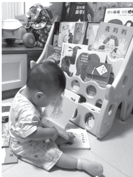
图 1-5 自主阅读中认知的发展

1.5—2岁的幼儿对主要抚养者表现出较强的依恋,当与主要抚养者分离时会感到沮丧,并会较长地延续这种情绪状态;自我意识逐步增强,开始表现出独立行为倾向,喜欢自己独立完成某一动作,开始意识到自己的性别角色;喜欢与其他幼儿共同参与游戏活动;模仿性强,喜欢模仿成人动作,如学着收拾玩具,喜欢帮忙做事。