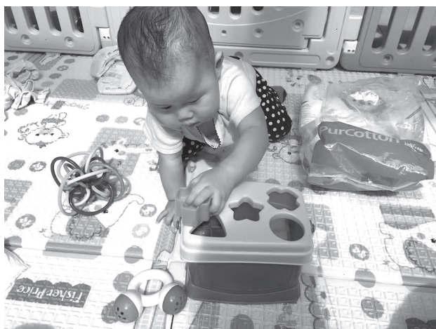
图 1-3 形状积木游戏中的手眼协调

吃和睡，并且已经具备觅食、吮吸、吞咽等生理反射。2—3个月的婴儿仰卧时头已经可随着看到的物品或听到的声音转动，两手能在胸前相互接触和抓握，逐渐学会从仰卧位变为侧卧位，且俯卧时能将头抬高至45°，并尝试伸手触摸眼前的东西。4—6个月的婴儿俯卧时能用两只小手支撑独坐片刻，手部动作也逐渐增加，如撕纸、扒脚、拿起眼前的玩具时会将其放入口中等。7—9个月的婴儿能很稳地独