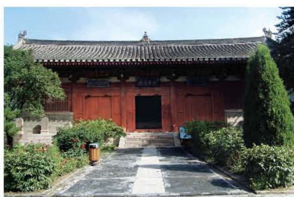
[明代·五台山·佛光寺] 五五