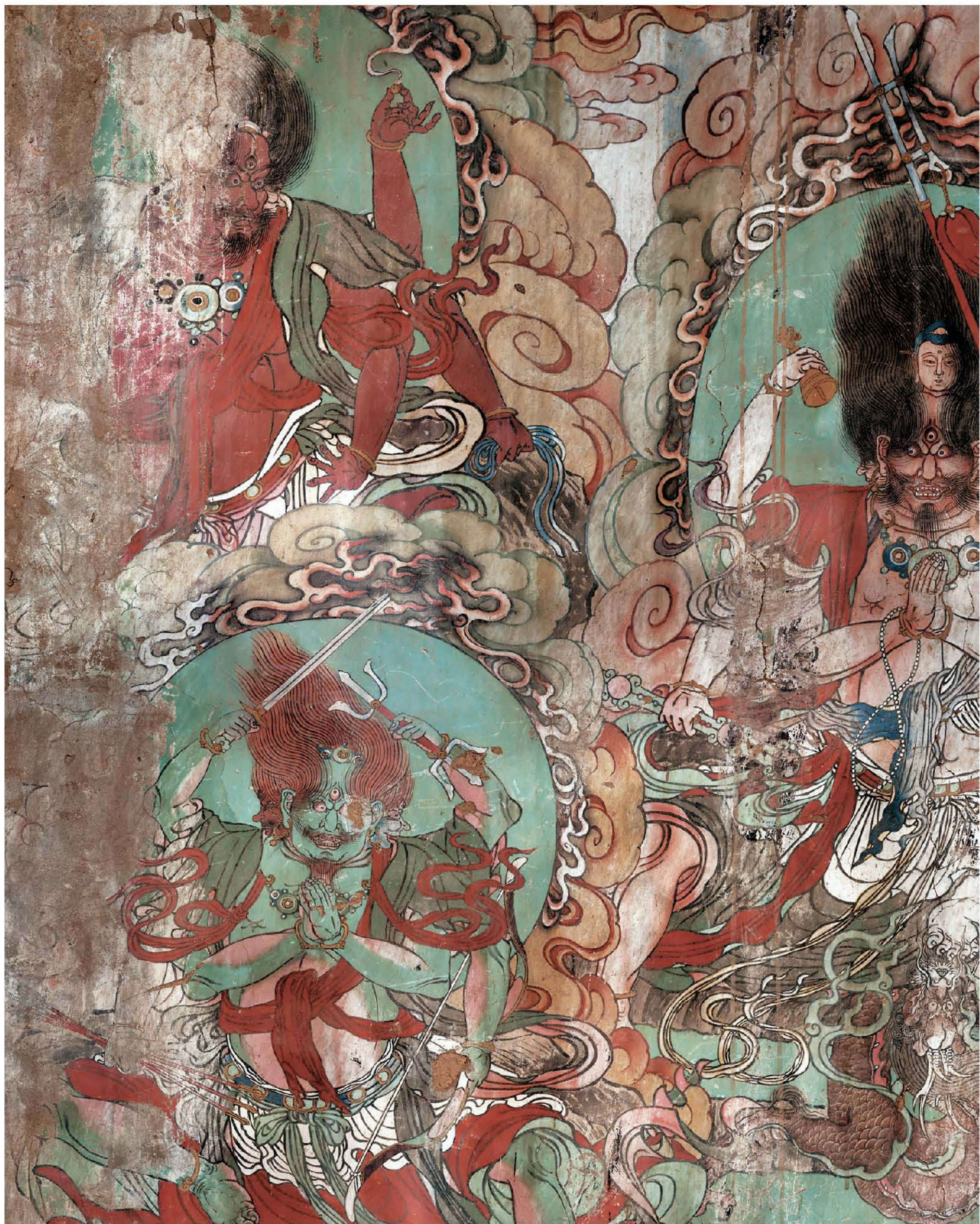
图1 | 北墙壁画东

北壁明间两侧和两次间绘阿弥陀佛、不空成就佛及八大菩萨的正法轮身显现的十大明王像。各明王上隅书有榜题，依次为不动尊明王除业障菩萨、马首明王观世音菩萨、露军比利明王阿弥陀佛、大威德明王妙吉祥文殊菩萨、秽足迹