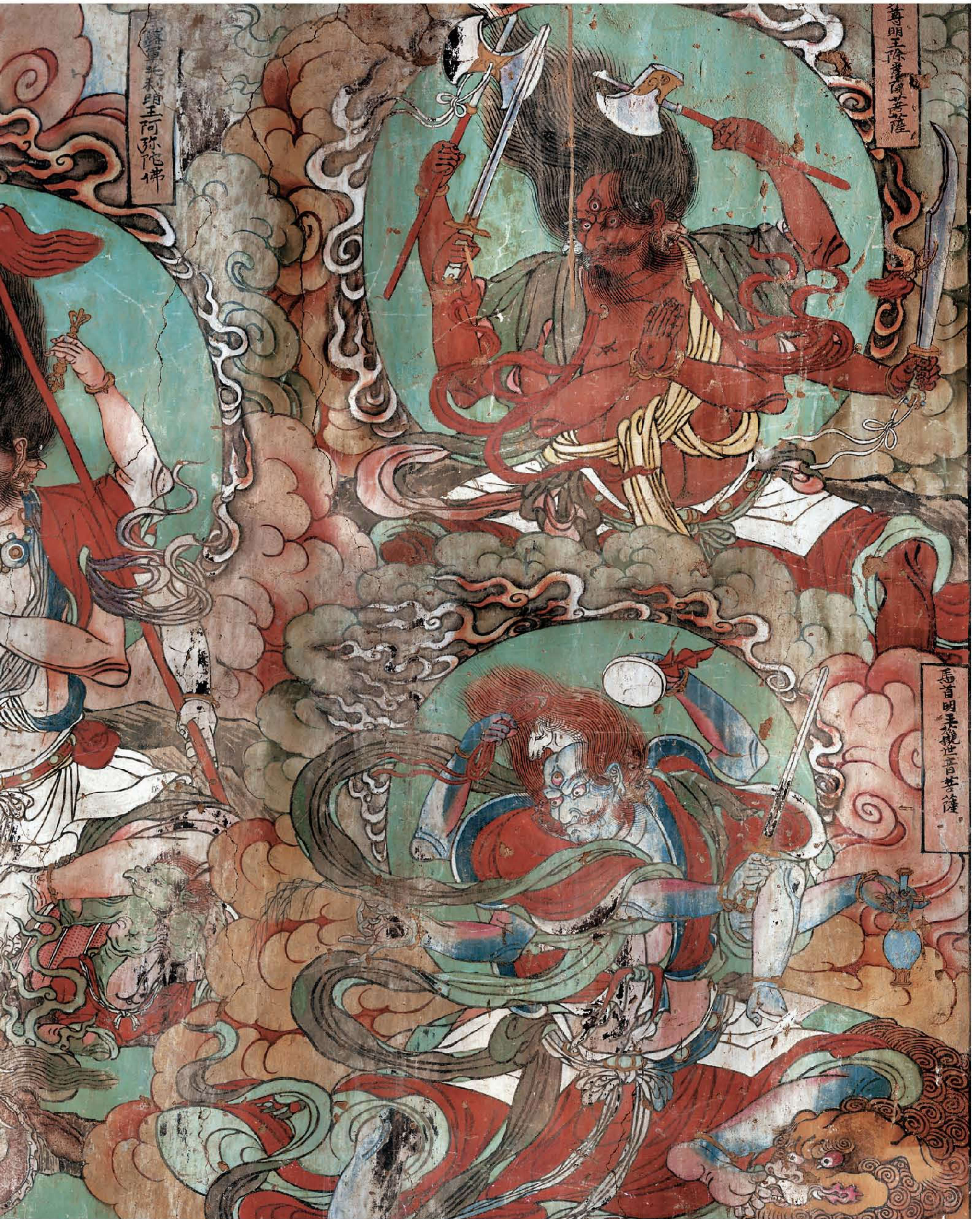
明王不空成就佛、降三世明王金刚手菩萨、大笑明王虚空藏菩萨、大轮明王慈氏菩萨、无能胜明王地藏菩萨、步掷明王普贤菩萨。所有明王像皆是三头六臂，怒发冲冠，手中执着各种法器，足下踏着妖魔鬼怪，狰狞恐怖，令人毛骨悚然。明王上隅各有一圆光，内绘佛及菩萨本相。