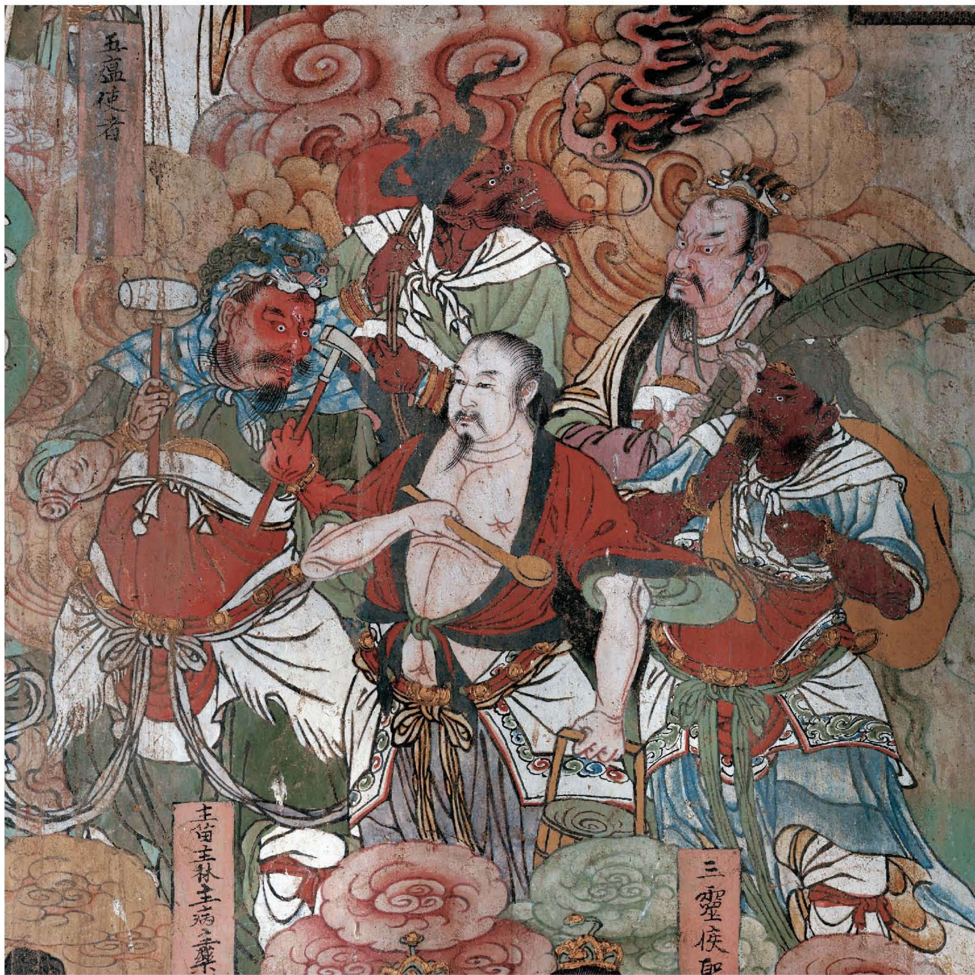
图5 | 东墙壁画二