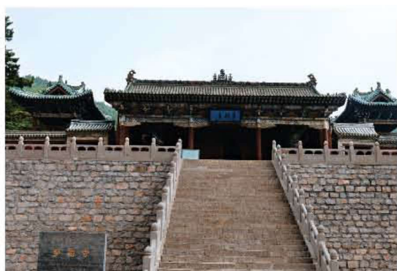
[明代·太原·多福寺] 三五