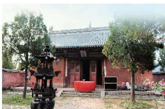
[明代·繁峙·公主寺] 〇一