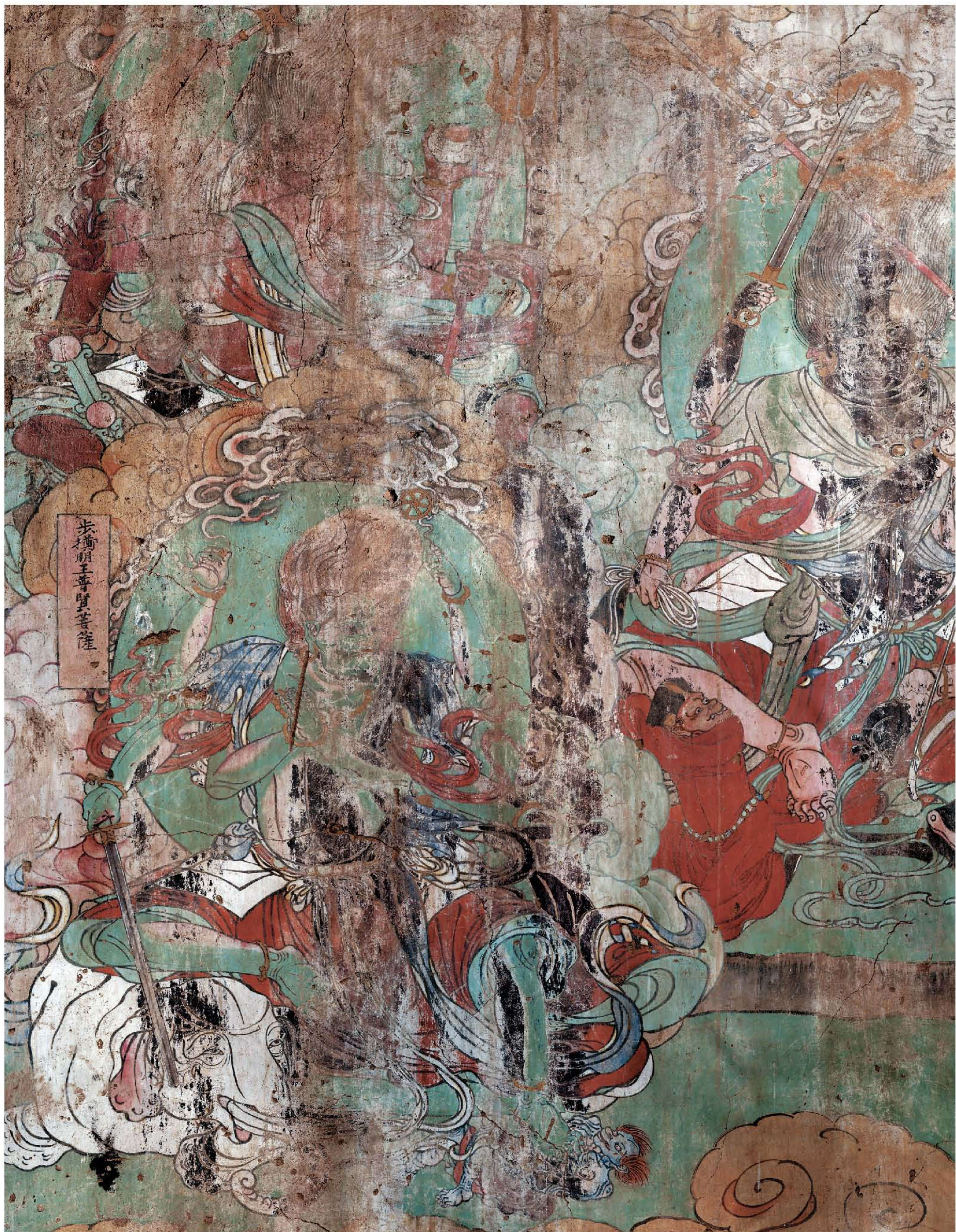
图2 | 北墙壁画西 步擲明王普賢菩薩。