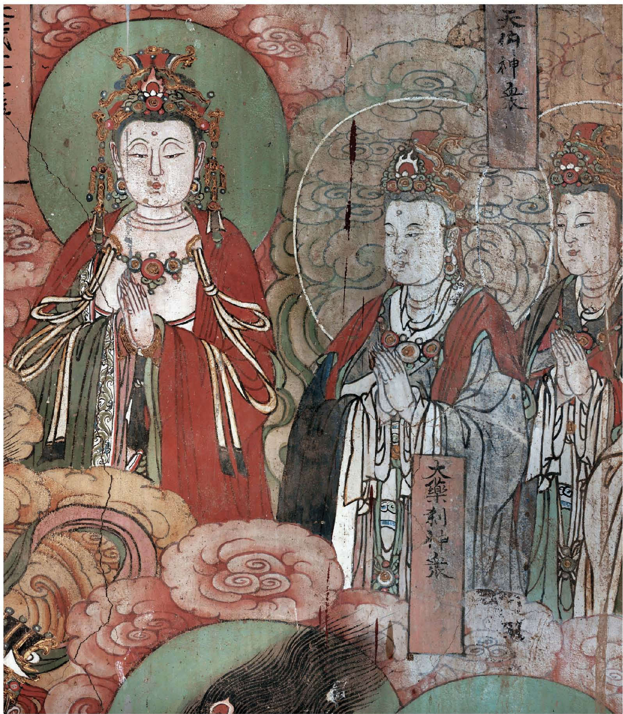
图4 | 东墙壁画一