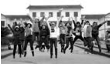
“快乐学校”冬令营广安队志愿者在协兴镇牌坊村合影