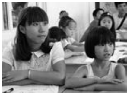
留守学生母女共同听课