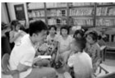
青年志愿者对留守学生进行学业辅导

革重要事项，团省委在开展广泛调研，积极征求各厅局意见的基础上，制定了《加强农村留守学生关爱服务体系建设工作方案》，并提交省全面深化改革领导小组进行审议，力争到2020年建立“党委领导、政府负责、社会协同、公众参与、法制保障”的关爱工作模式，形成党政主导，学校、村（社区）、家庭、社会四位一体的关爱服务体系，促进农村留守学生健康快乐地成长。