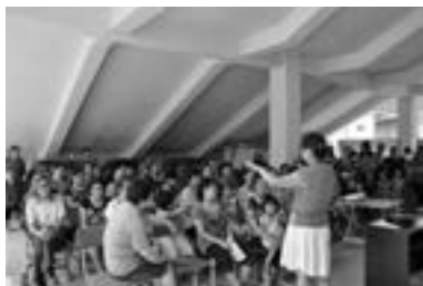
为农村留守学生的母亲们开展“家庭心理健康与亲子教育”专题讲座