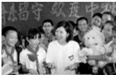
关爱，让留守学生不孤单