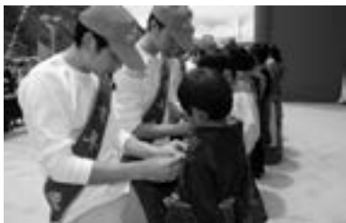
青年志愿者与留守学生结对子