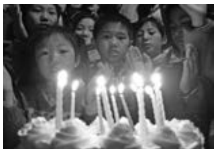
留守学生集体过生日