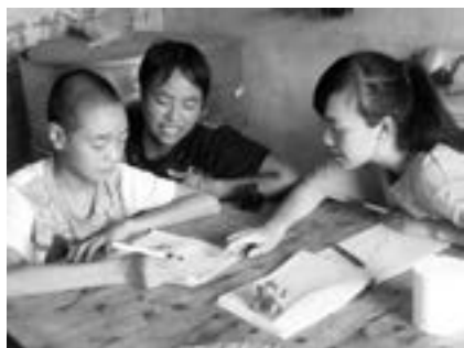
到留守学生家家访