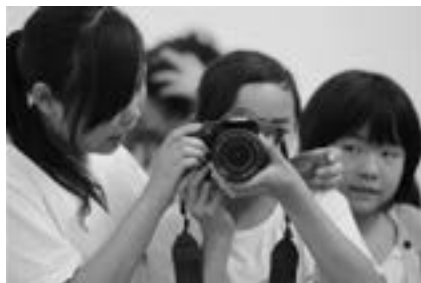
留守学生正在上摄影课