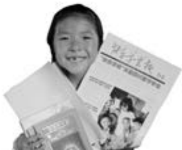
留守学生左手拿着《快乐学堂报》，右手拿着崭新的书本，开心极了。

与此同时，在冬日暖阳中，泸州市龙马潭区金龙乡雪骡村的15名留守学生起了个大早，因为村里的留守学生之家开班了。在这里，他们可以跟着老师学跳棋、学唱歌。“有老师、有小朋友一起，还有这么多好玩的游戏，太好了！”孩子们开心地说。