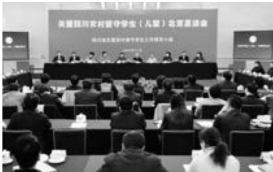
在北京人民大会堂召开关爱四川农村留守学生恳谈会