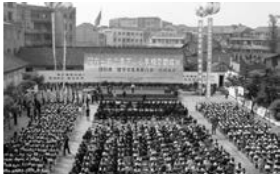
四川省留守学生关爱行动启动仪式