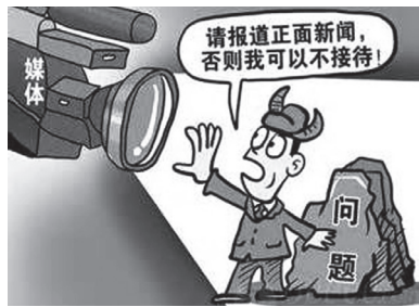
加大舆论监督力度

事关旗帜和道路。高举中国特色社会主义伟大旗帜，坚定不移地坚持和发展中国特色社会主义，这是历史的结论，是人民的选择。新闻舆论在这一重大问题上承担着十分重要的责任和使命，这就是习近平总书记在这次座谈会上指出的“高举旗帜、引领导向”。当前，意识形态领域斗争激烈复杂，在一些重大原则问题和非问题上“噪音”、杂音不断，如果听之任之，势必扰乱思想、混淆是非。因此，新闻舆论工作各个方面、各个环节都要坚持正确的舆论导向。