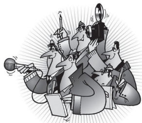
新闻媒介肩负着社会使命

高举旗帜、引领导向，要求我们必须深刻认识到，做好党的新闻舆论工作，事关旗帜和道路，事关顺利推进党和国家各项事