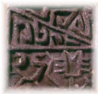
什邡城西出土的战国汁方王印章