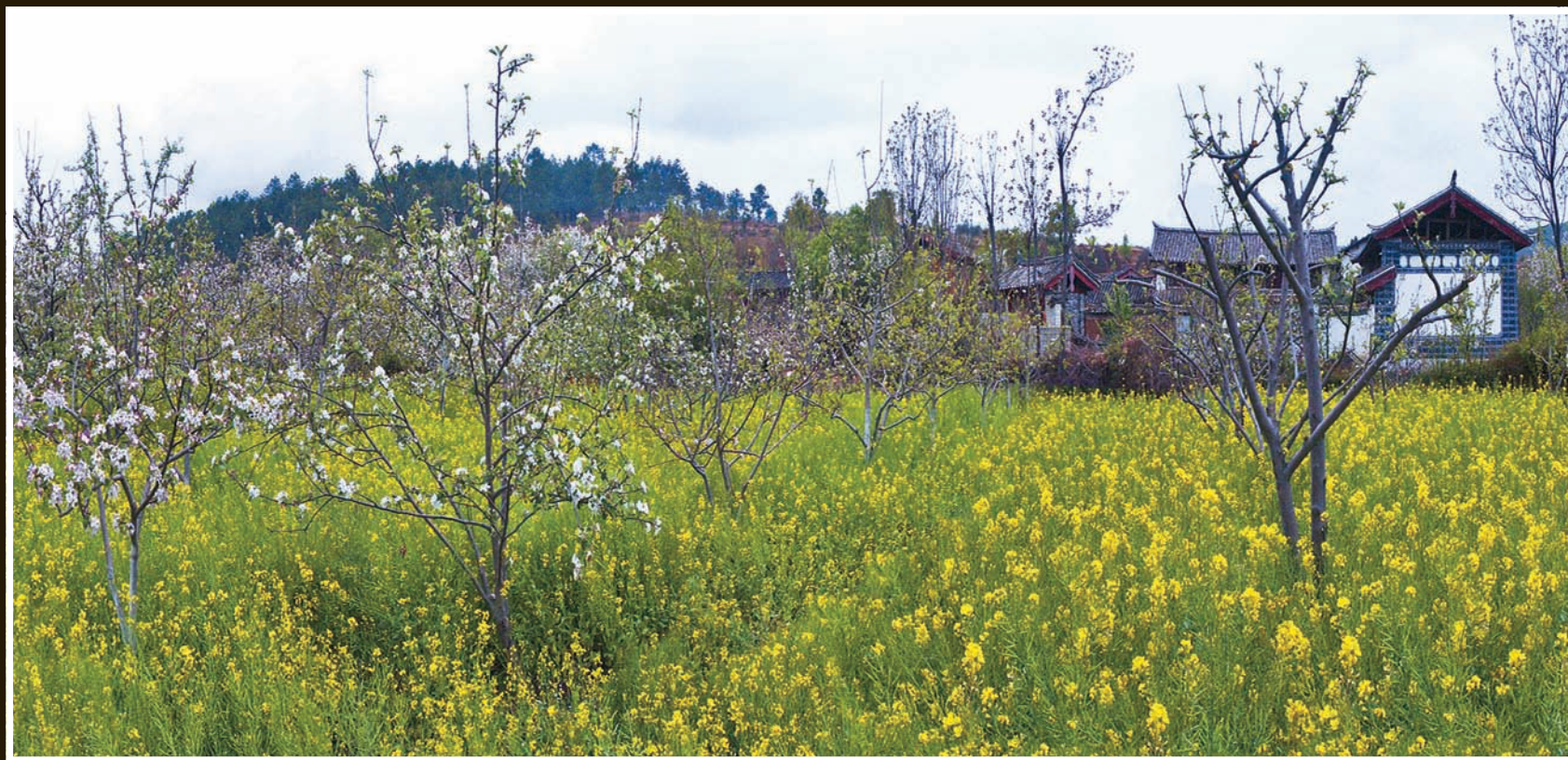
【香飘四季】云南丽江