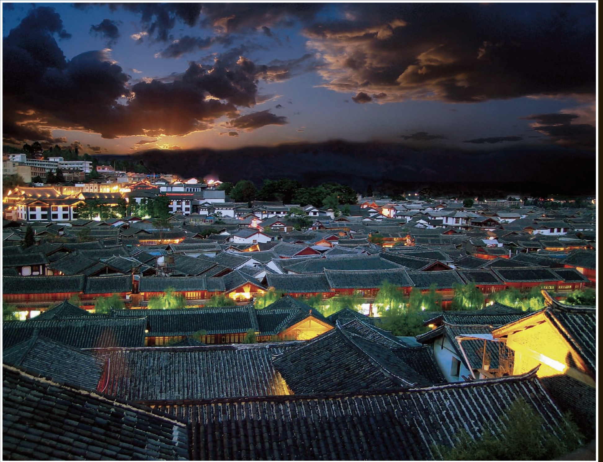
【夕照古城】云南丽江