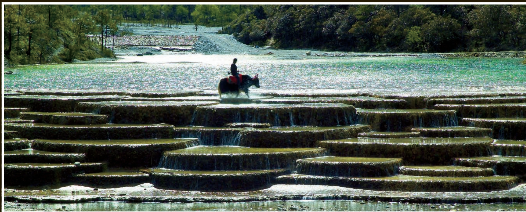
【白水河畔】云南丽江