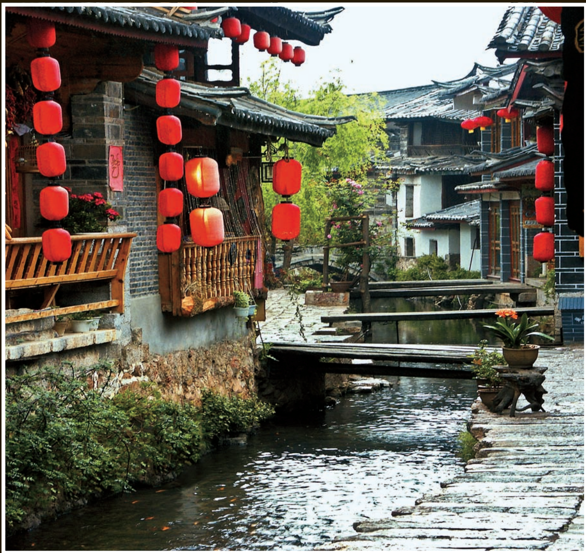
【小桥流水人家】云南丽江

就这样，转过一道桥，踏上青石小路，便见得前面红笼深处，流水潺潺，灯火温暖。一时间，旅人，步履更蹒跚。