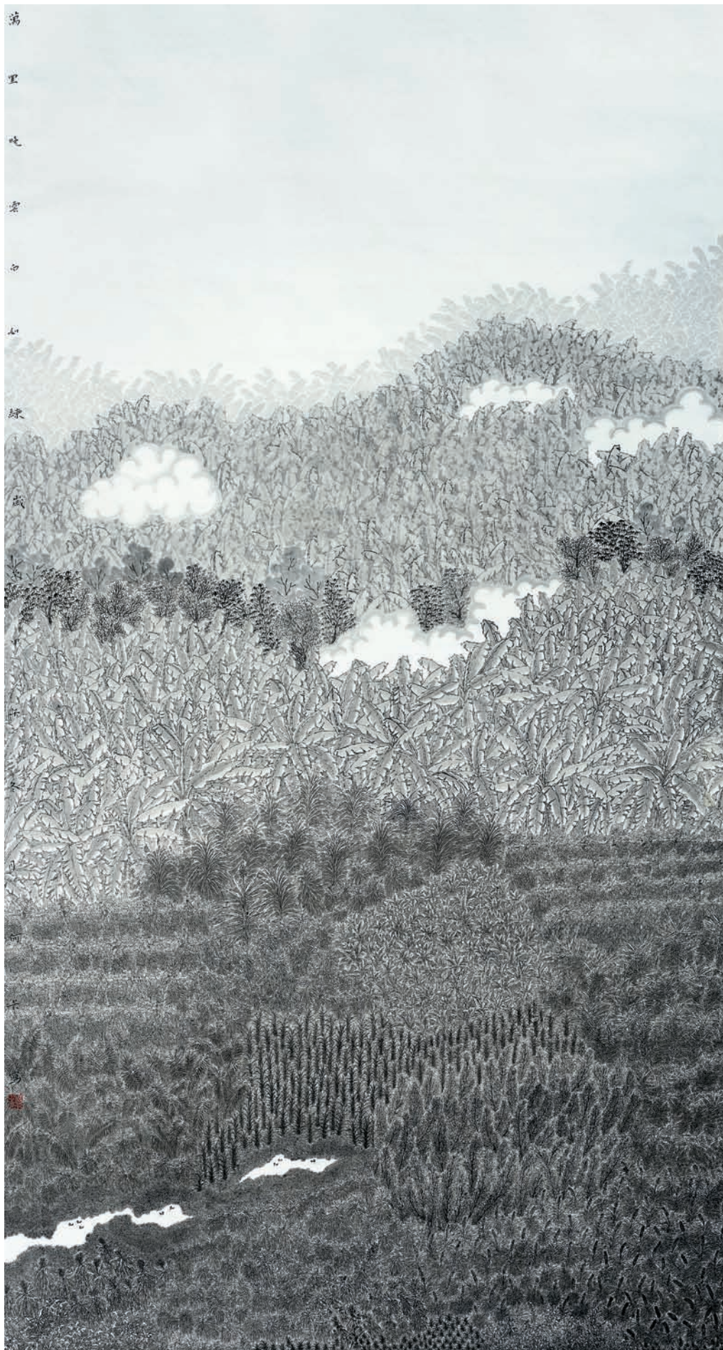
万里晚云白如练 180cm × 97cm 何卡（广东）