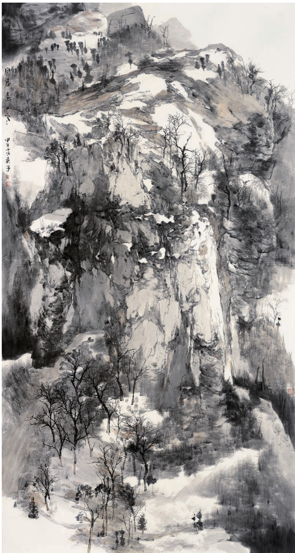
日暮远山寒 180cm × 96cm 李英姿（河北）