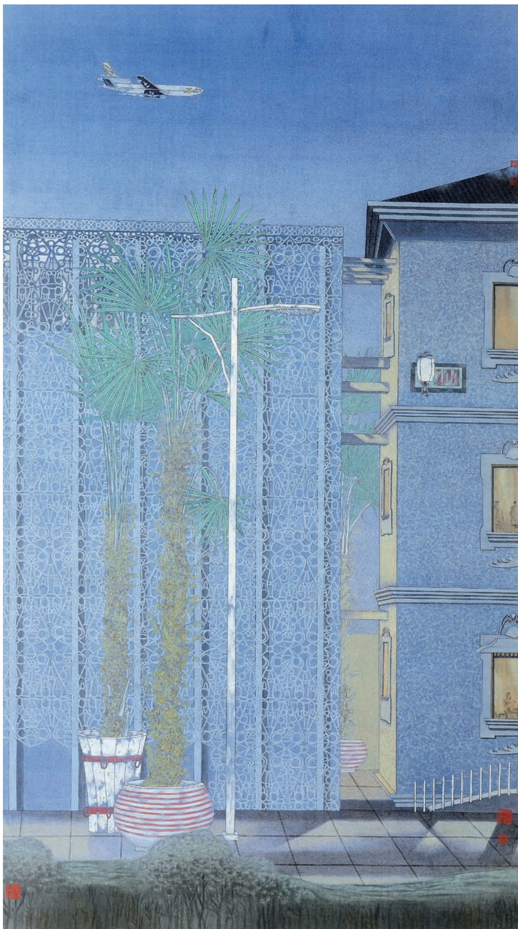
海归 200cm × 110cm 葛洪强（辽宁）