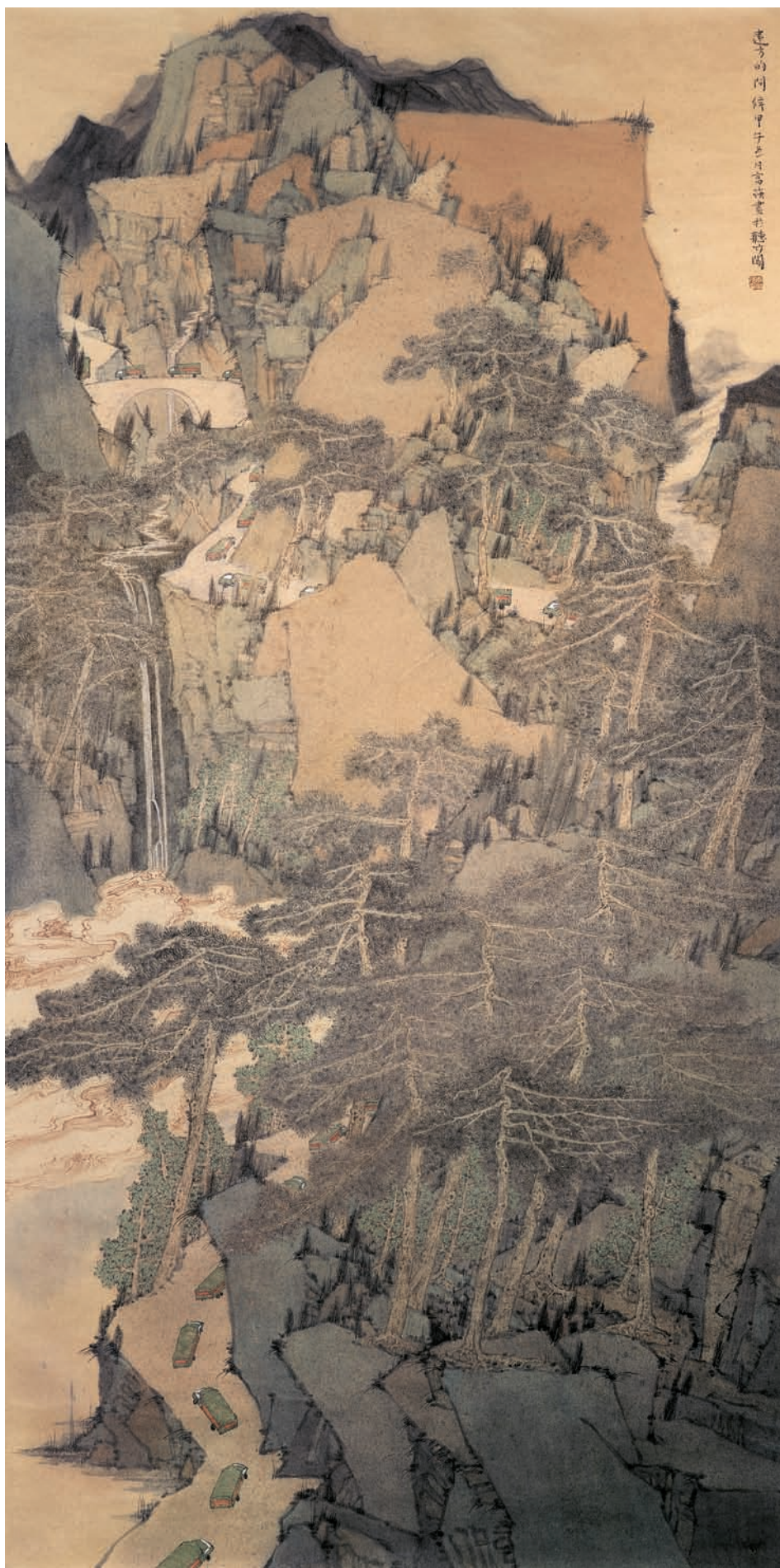
远方的问候 248cm × 125cm 李富强（广西）