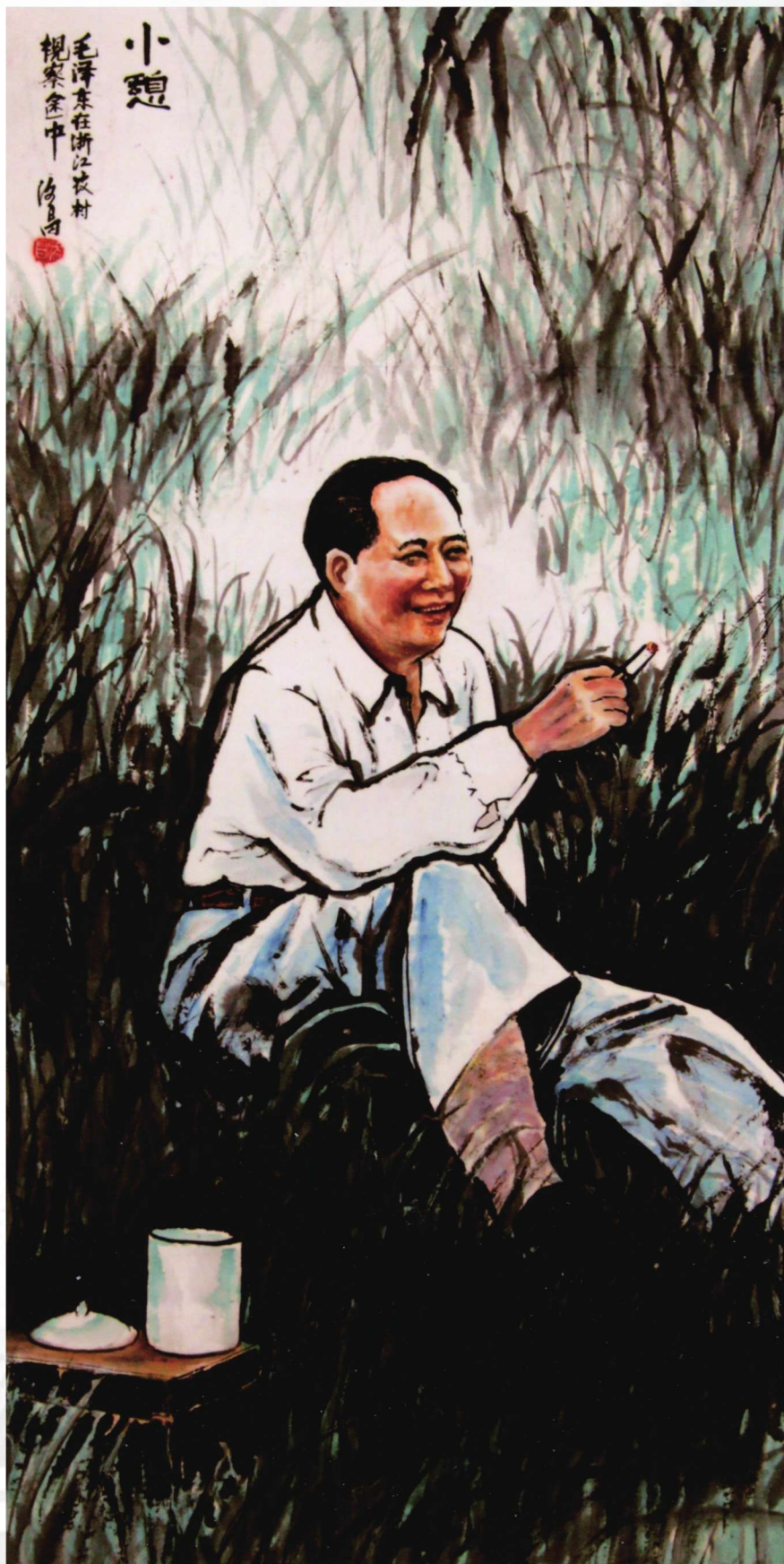
小憩——毛泽东在浙江农村视察 136cm X 68cm