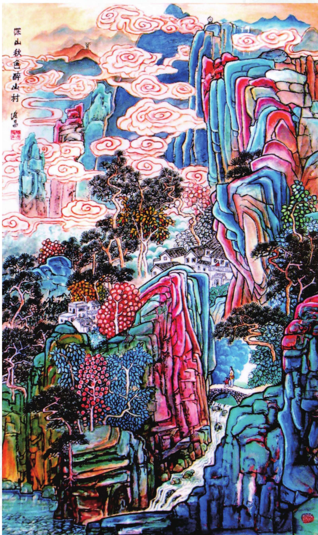
深山秋色醉山村 110cm x 65cm