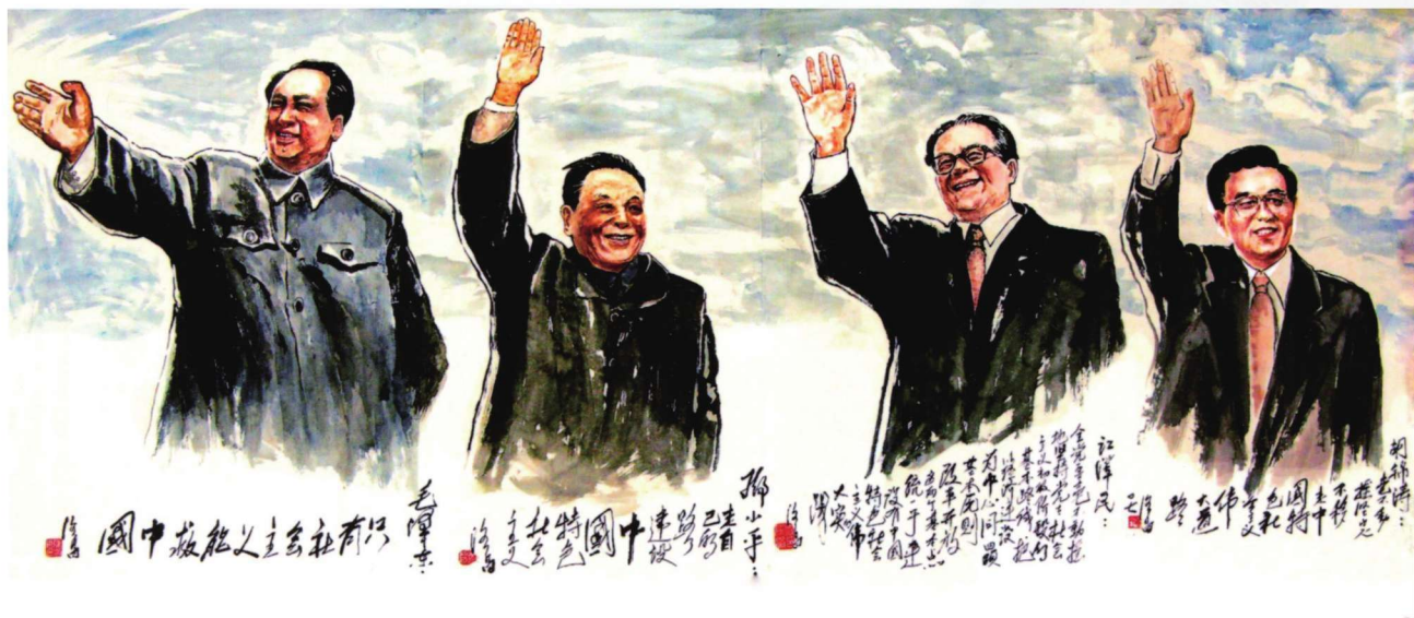
承前启后 继往开来 66cm × 180cm