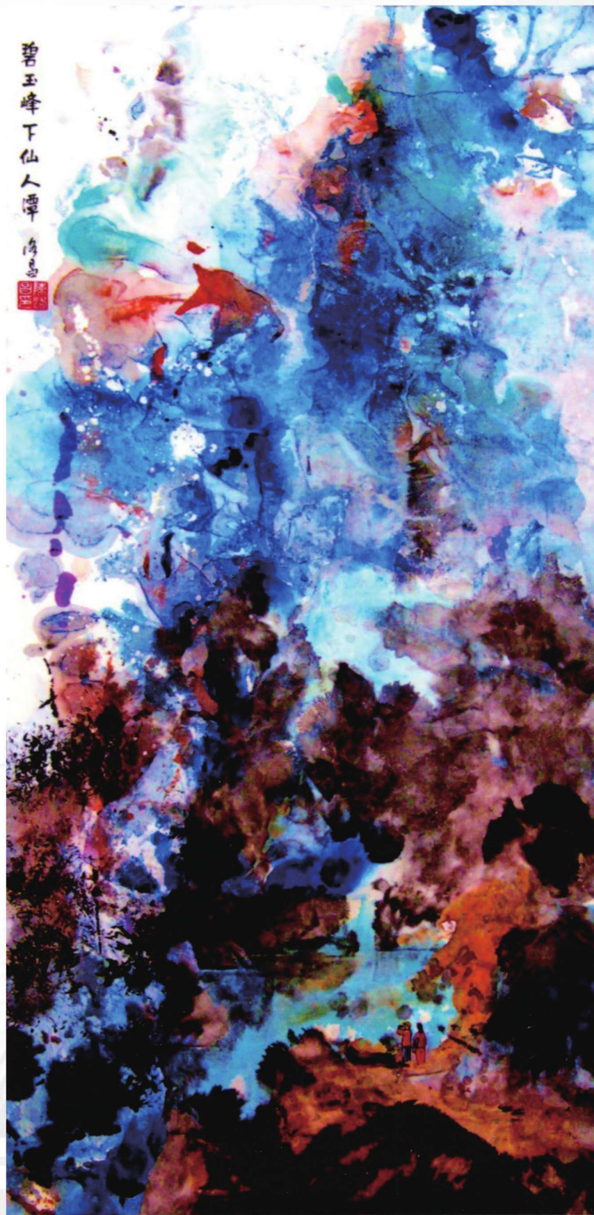
碧玉峰下仙人潭 98cm X 50cm