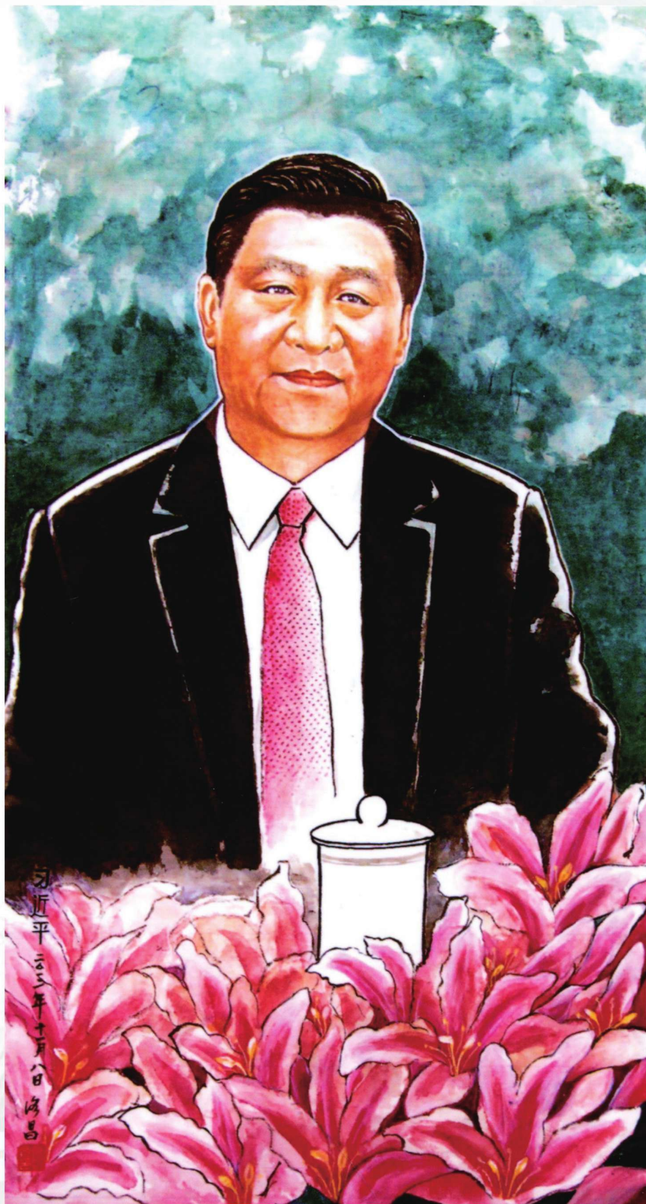
习近平 120cm X 65cm