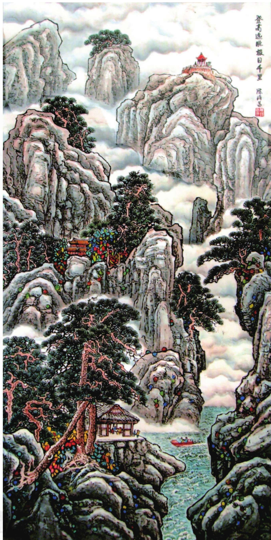
登高远眺极目千里 149cm x 69cm