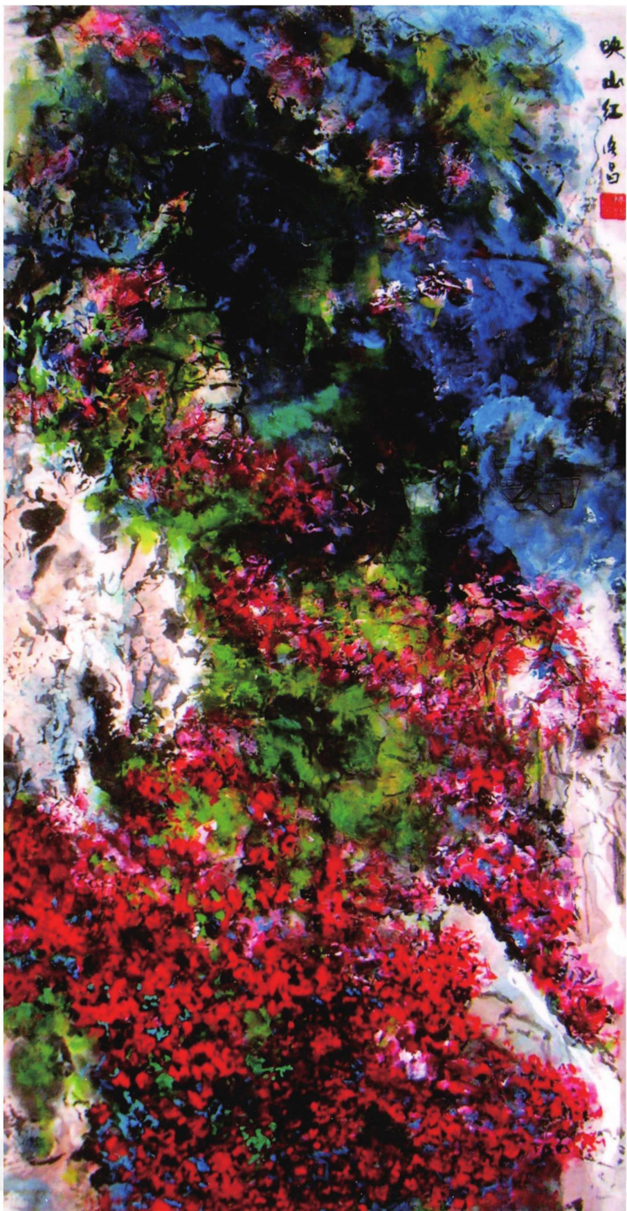
映山红 100cm x 50cm