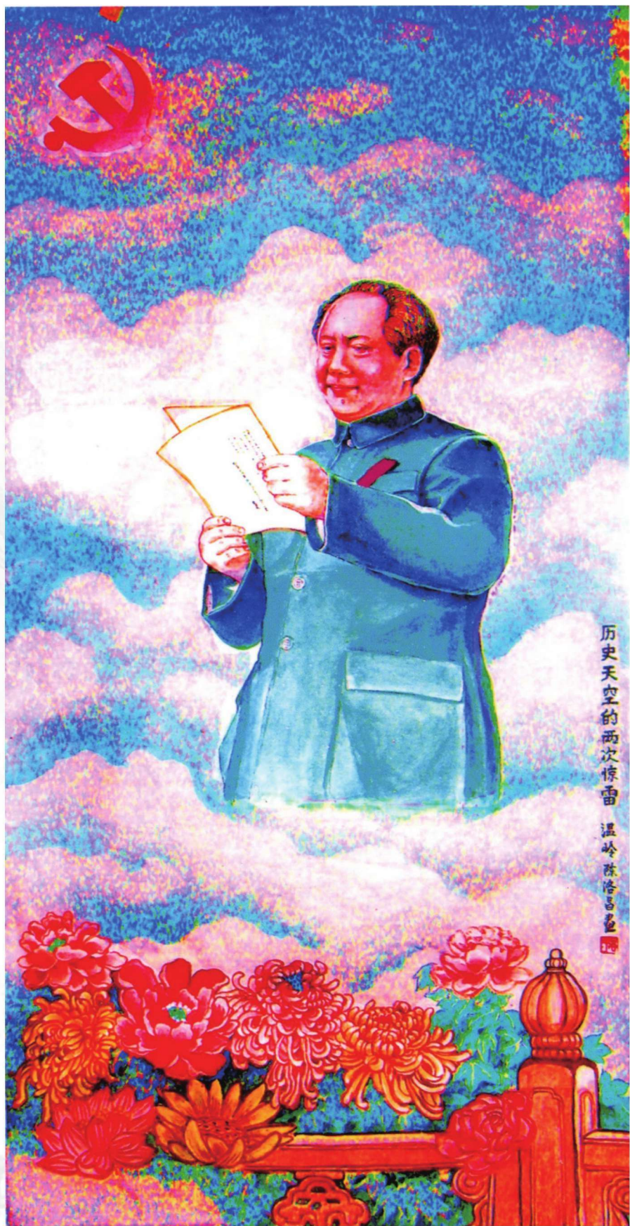
历史天空中的两次惊雷 温岭 陈浩昌画