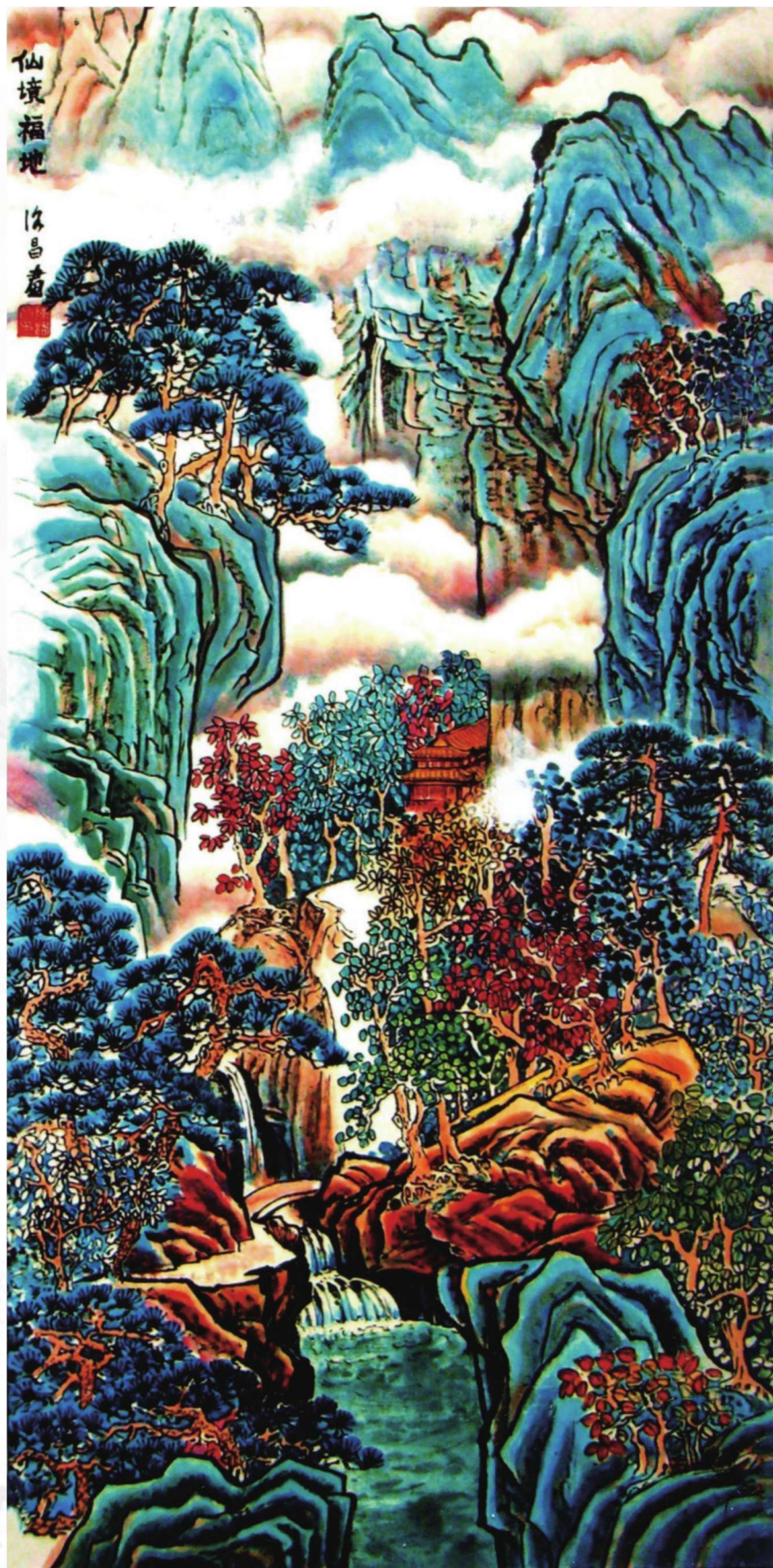
仙境福地 104cm x 50cm