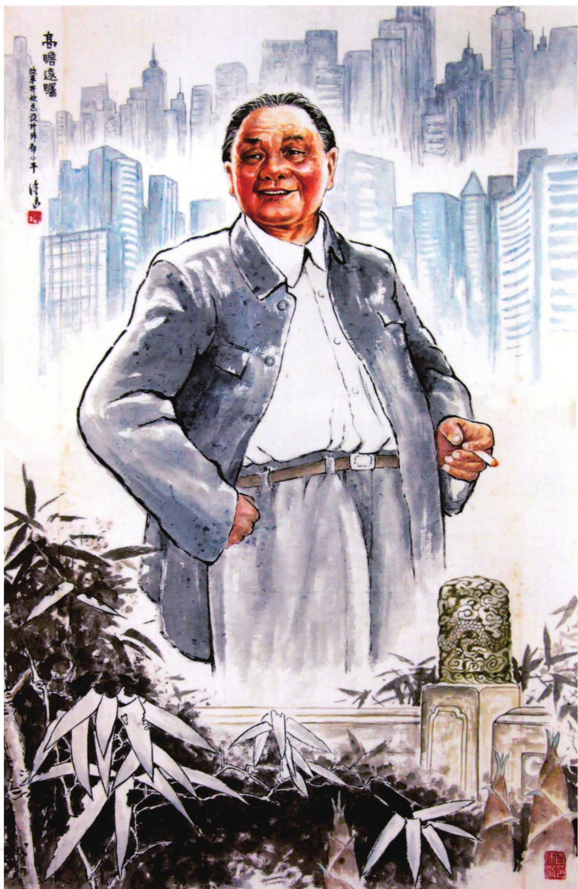
高瞻远瞩——邓小平 130cm X 85cm