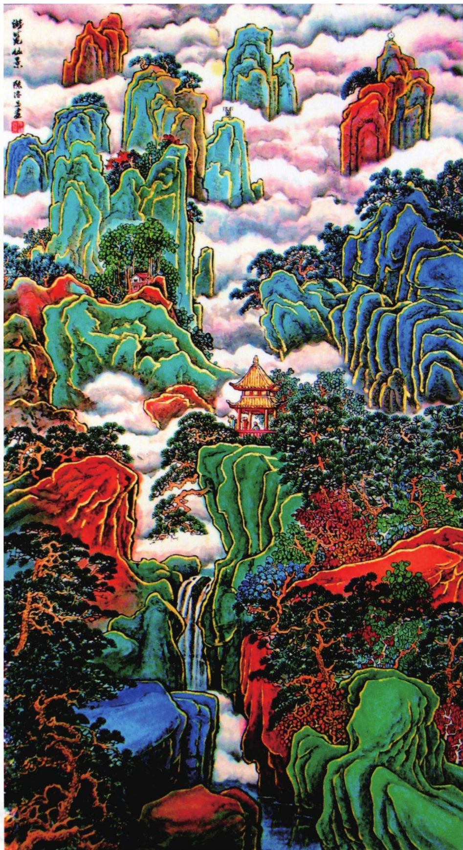
游览仙境 179cm X 95cm