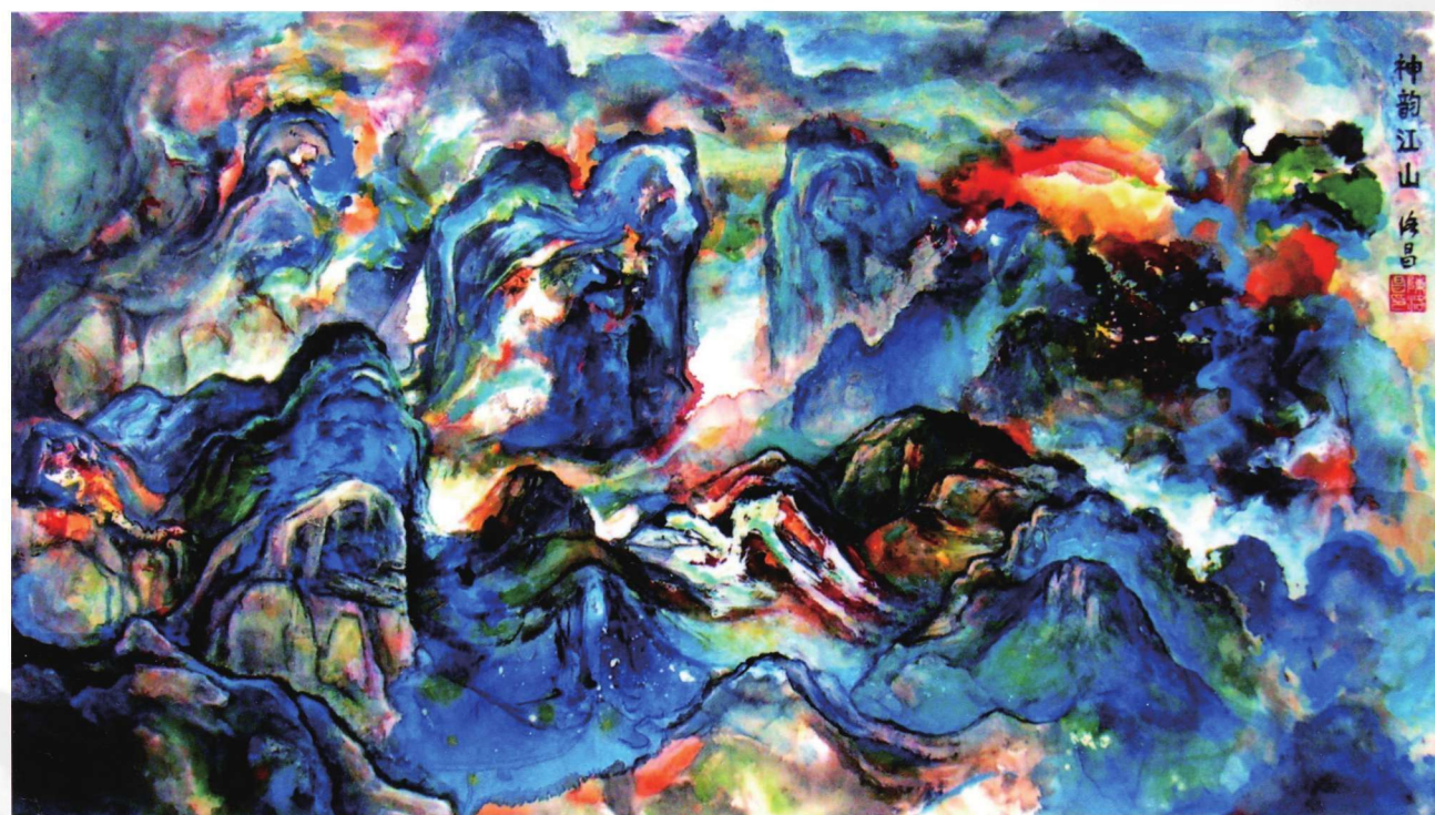
神韵江山 69cm × 138cm