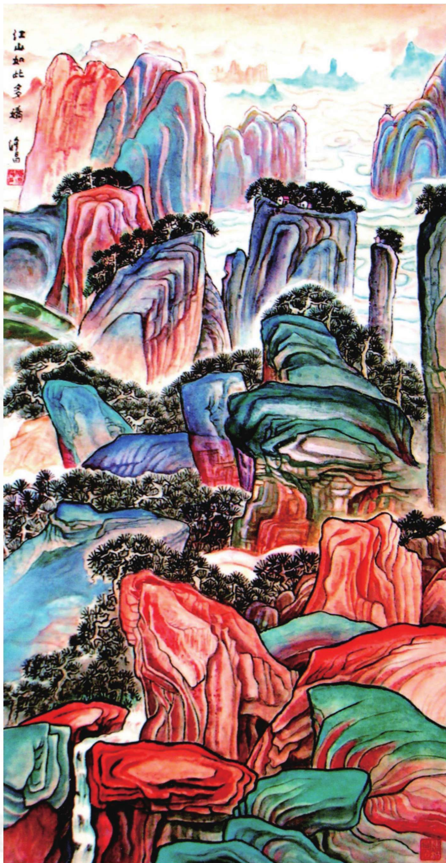
江山如此多娇 107cm X 55cm