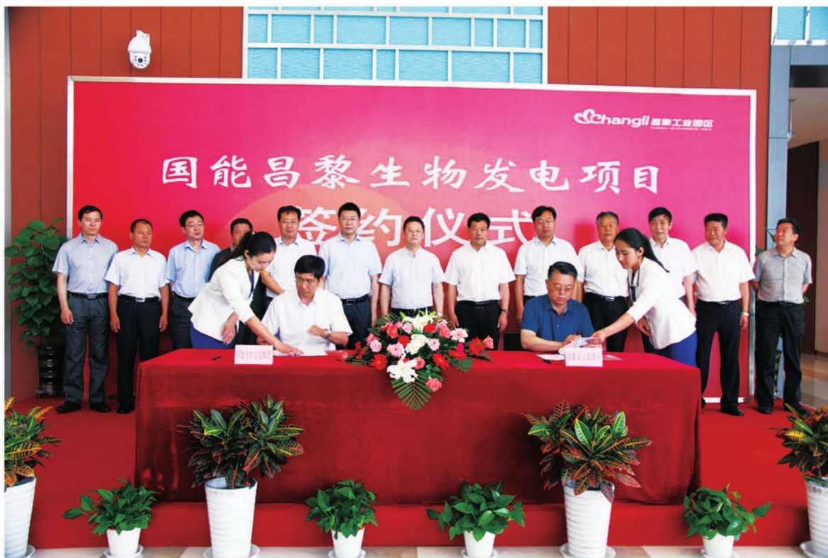
国能昌黎生物发电项目签约仪式