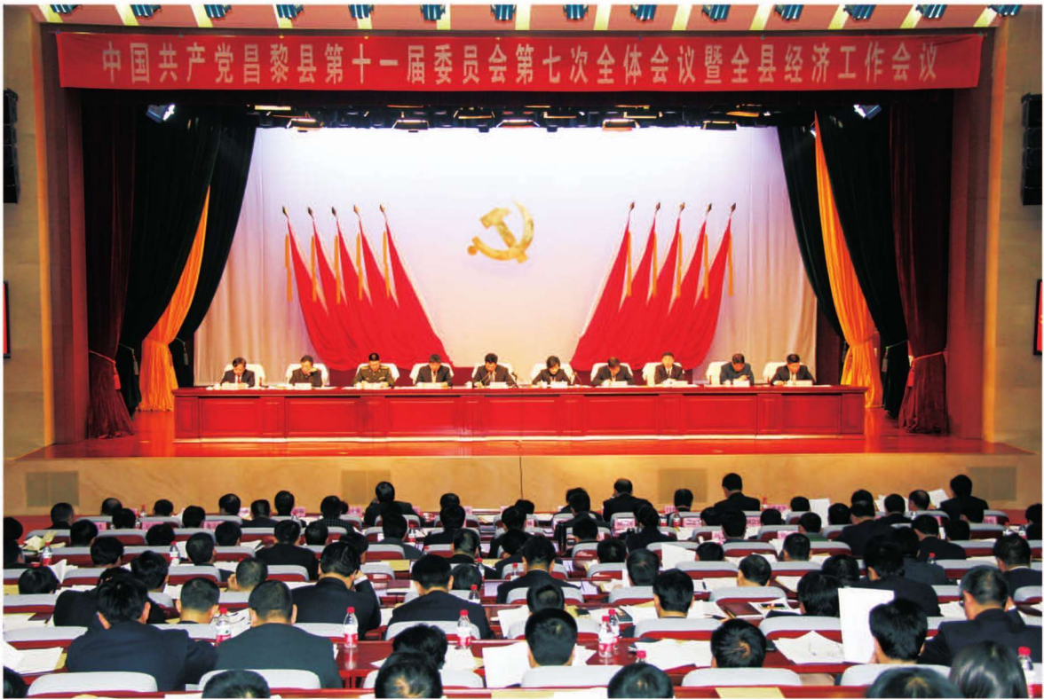
1月19日,中国共产党昌黎县第十一届委员会第七次全体会议暨全县经济工作会议召开