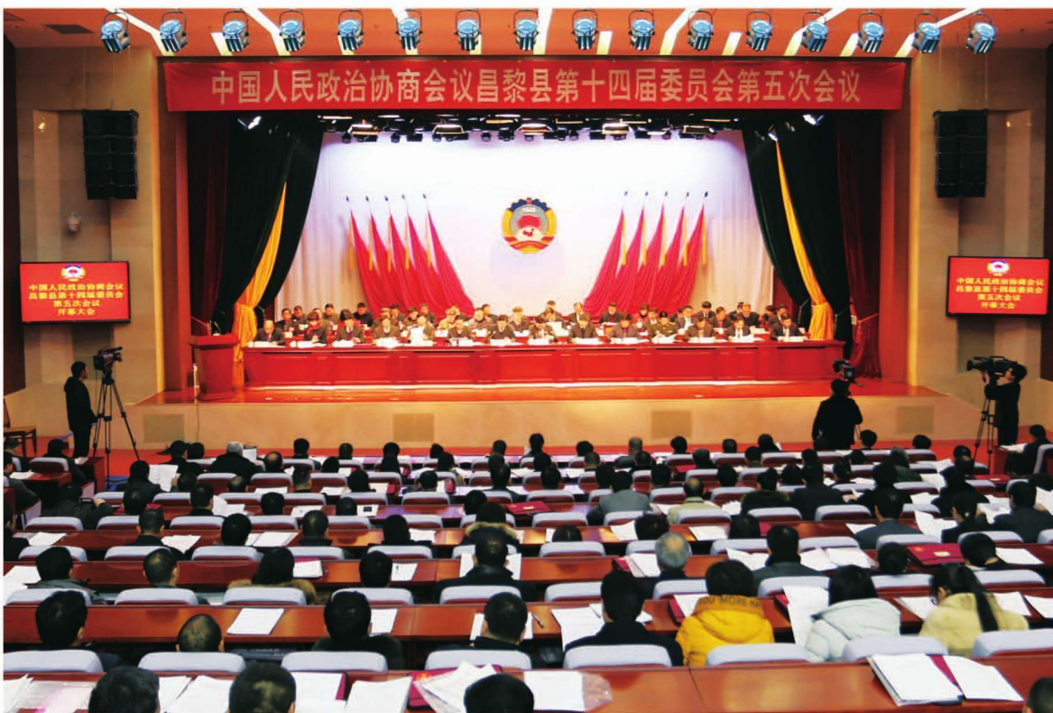
1月21日,中国人民政治协商会议昌黎县第十四届委员会第五次会议召开