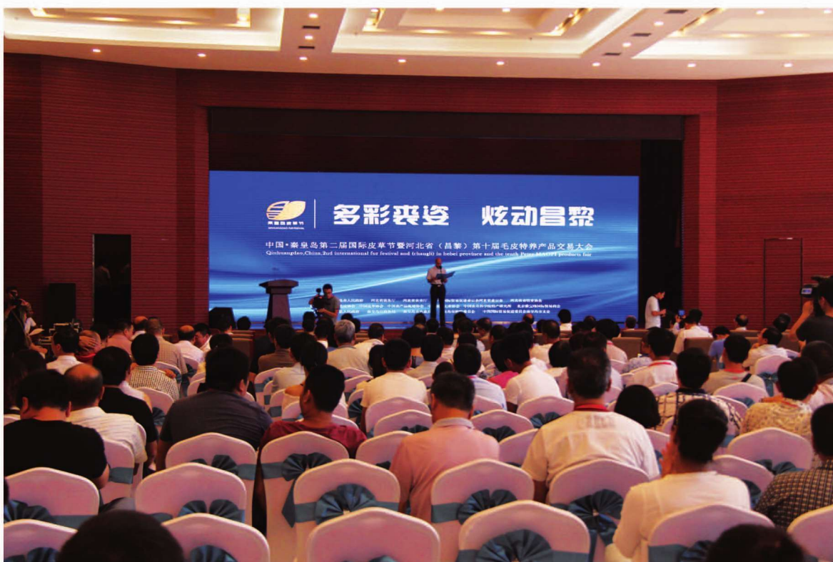
8月26日,中国·秦皇岛第二届国际皮草节暨河北省(昌黎)第十届毛皮特养产品交易大会召开