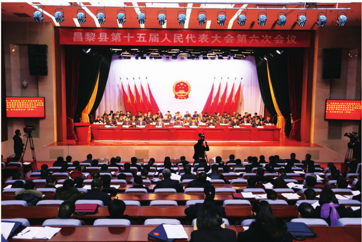
1月22日,昌黎县第十五届人民代表大会第六次会议召开