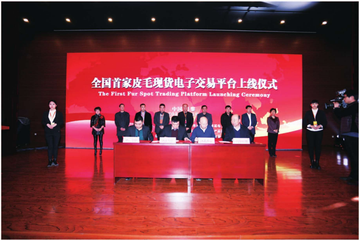
1月18日,全国首家皮毛现货电子交易平台上线仪式