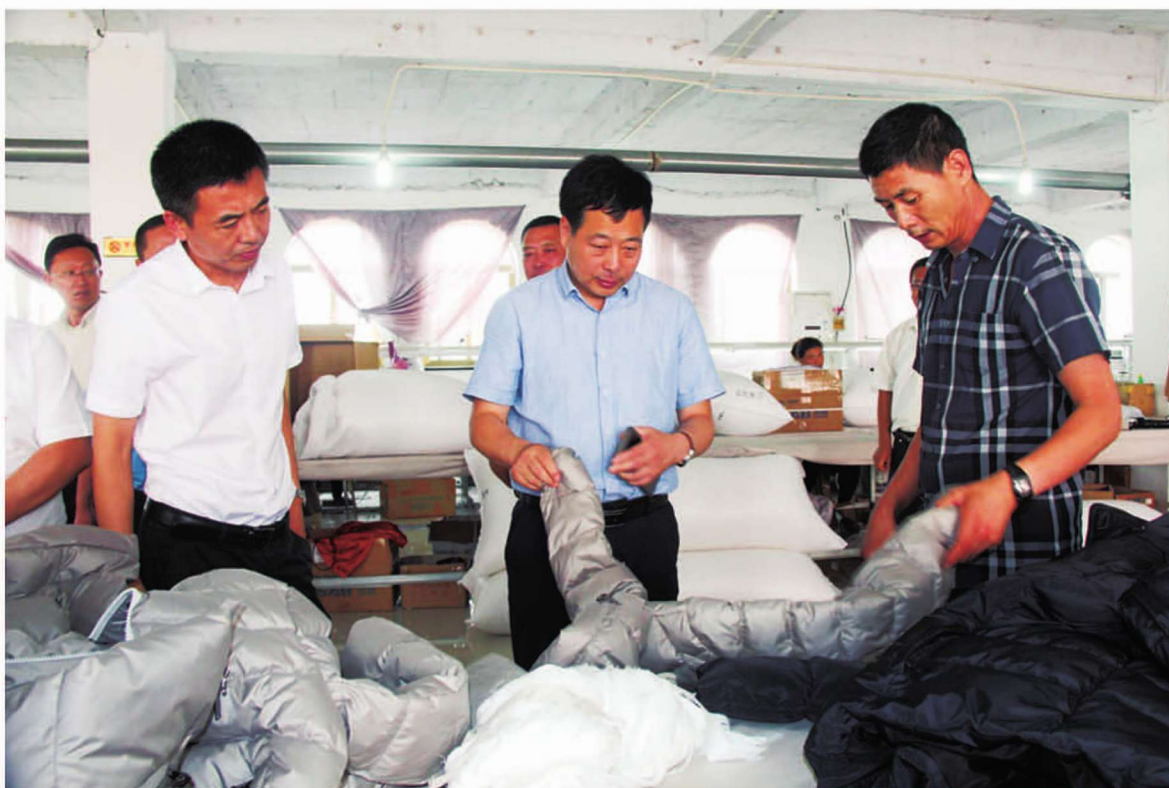
中共昌黎县委书记 刘学彬(左二)