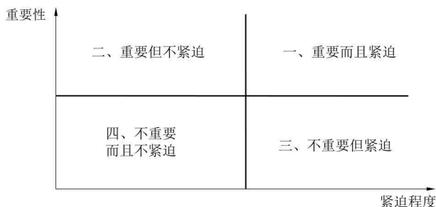
图 1-2 时间管理顺序图

诚然，一切成果的取得都离不开实践。光想不干，想得再好，于事无补；脱离实际，想入非非，还会把事情搞砸。所以，要学会从实际出发进行思考，学会分析事物的方法，养成分析的习惯，在实践中思考，在思考中实践。