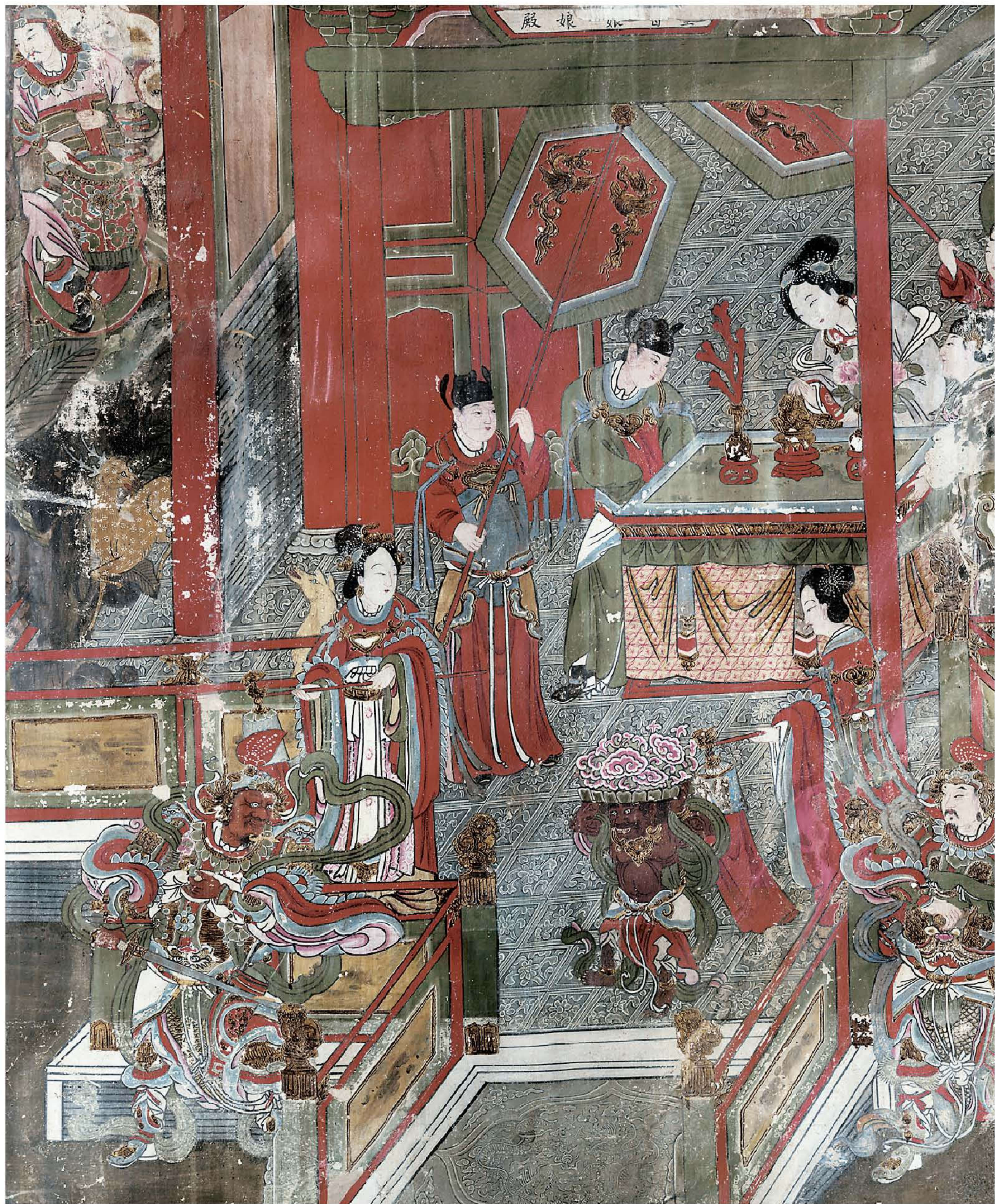
图5 | 西壁北部——宫闱尚宝（局部一）

其前隅“圣母娘娘殿”牌匾醒目，殿前一侏儒顶玉盘，上置灵芝，侍女在侧执灯候驾。殿内供案上摆设珊瑚、玉花、博山炉等宝物，一贵妇立于供案后躬身检视，两侧分侍掌灯宫女和持扇侍者，殿堂背景则工笔写实，施浅绿淡彩，装饰富丽，图案精美，用以陪衬人物，避免了色彩上的喧宾夺主。