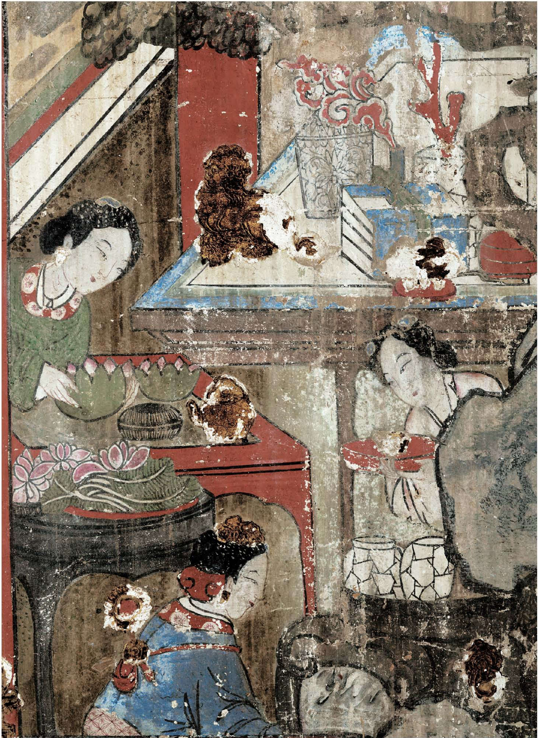
图 10 | 北壁——燕乐图（局部）

北壁东侧角落，绘有“尚食图”。此图画面不大，容纳人物不多。三位侍女，一蹲于炉前，一手持扇，一手疏通炉膛。一在火炉旁温酒。一正对着桌上剖开的瓜作若有所思状。绵绵瓜瓞，民之初生，古时有送瓜求子之谓。