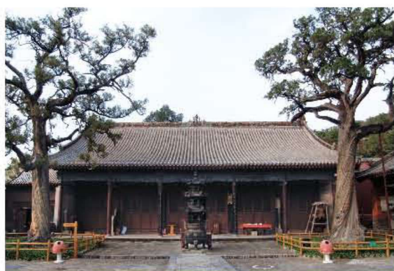
[明代·洪洞·广胜寺] 四三