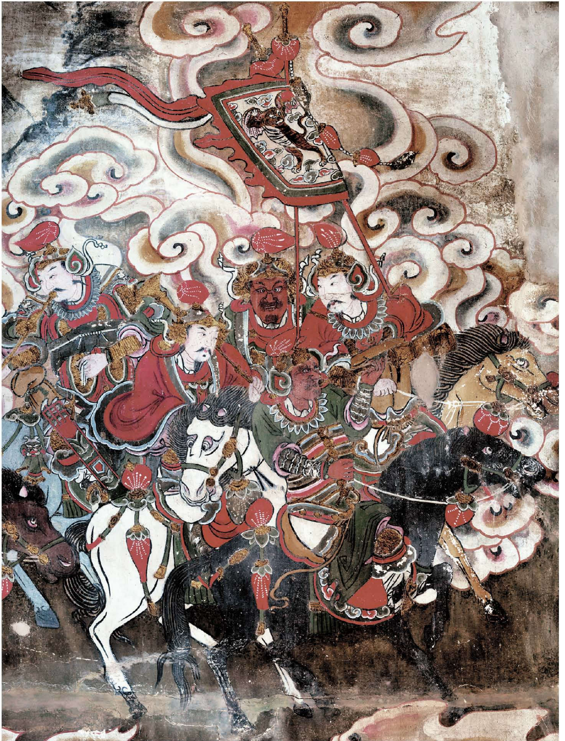
图3 | 西壁——巡幸图（局部三）