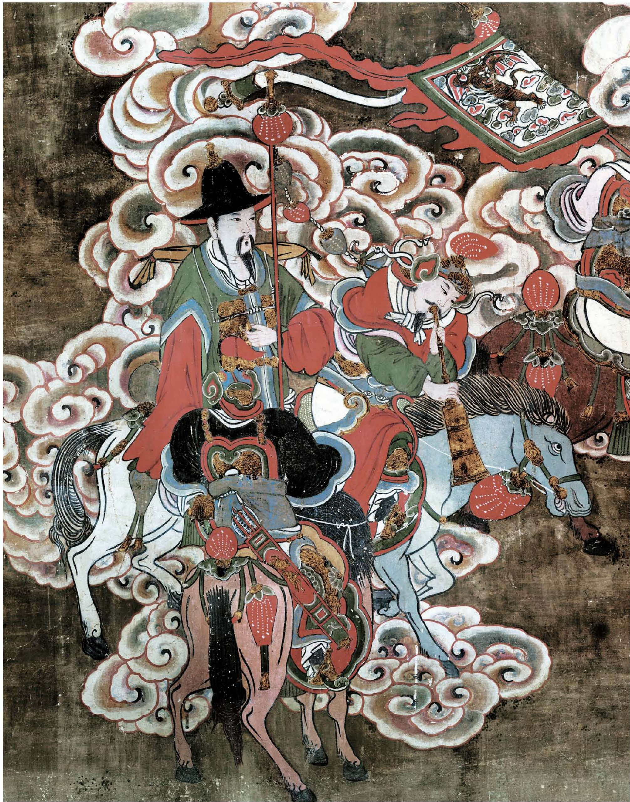
图9 | 西壁——巡幸图（局部六）

仪仗官。迎驾队伍前面是两位乘马的旗官，一人执有金瓜，文官装束，一人俯首吹奏号角，武将装扮，表情庄严。两匹马健壮肥硕，腾云驾雾，生动逼真。