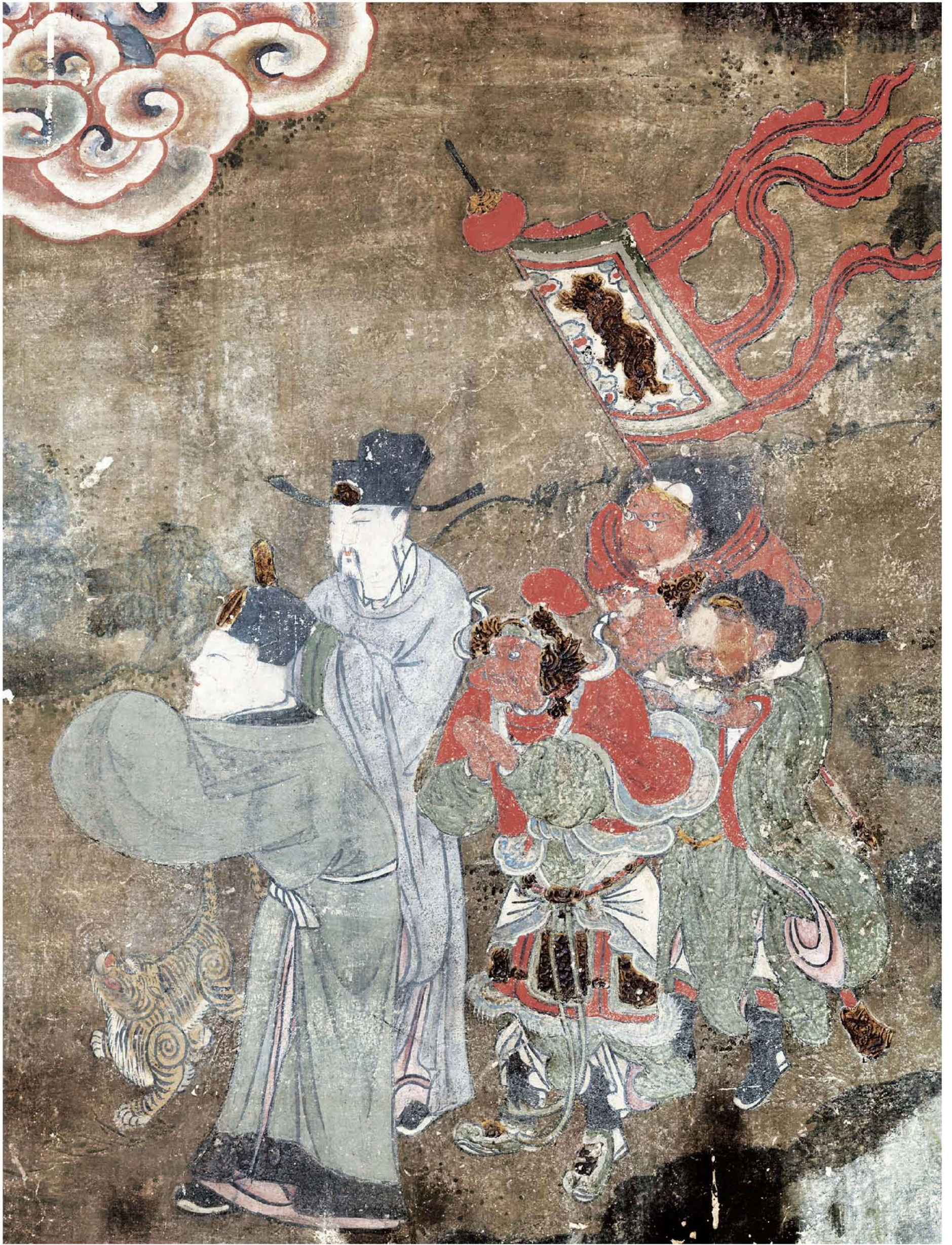
图1 | 西壁——巡幸图（局部一）

描绘的是圣母巡幸回官的情景，圣母身边的侍者及神将分别执叉、戟、玉花、三光以及纱灯等物乘马随行。其极力颂扬圣母的盛德威仪，表现圣母巡幸途中，龙辇飞驰，山川衬托，随行侍吏跃马奔驰的情景。