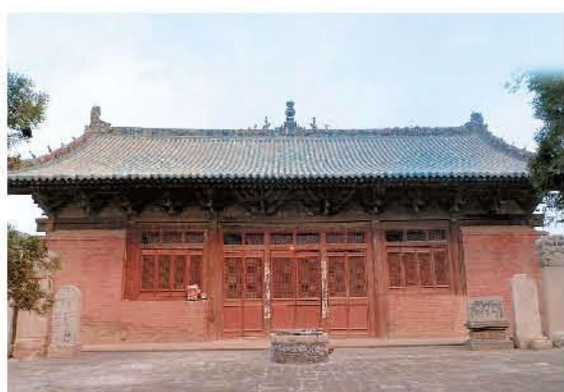
[明代·新绛·稷益庙] 五三