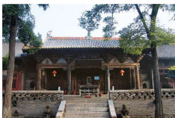
[明代·灵石·资寿寺] 二一