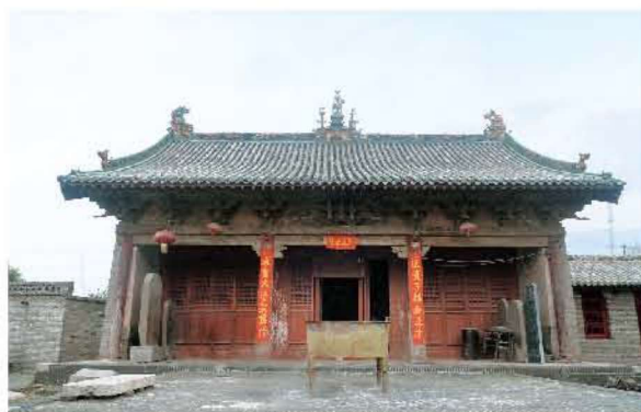
[明代·汾阳·圣母庙] 〇一