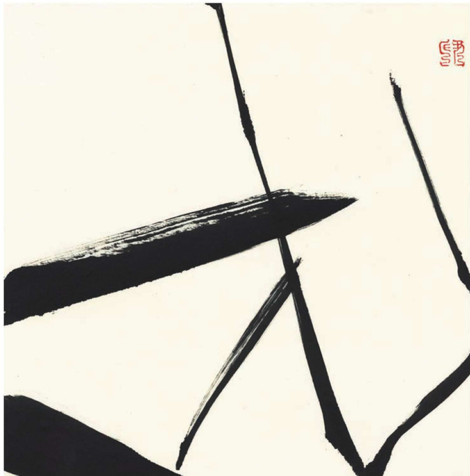
水墨 《竹》 雪华 作品