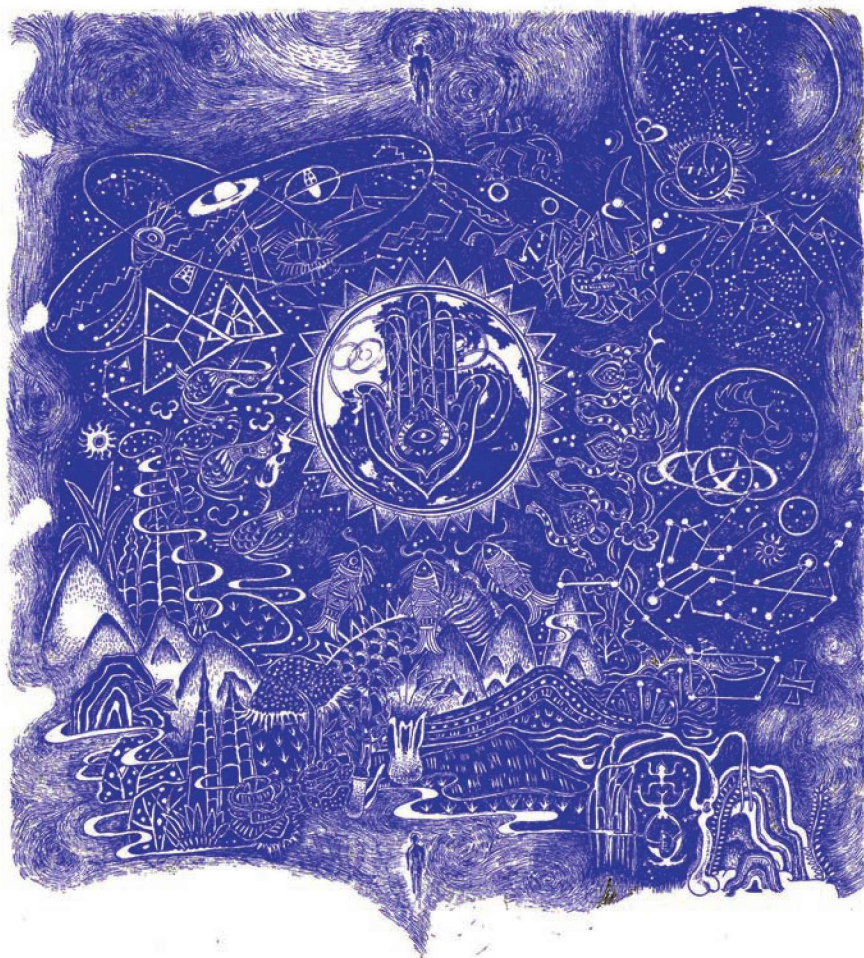
插画 《三体》 高阿普 作品