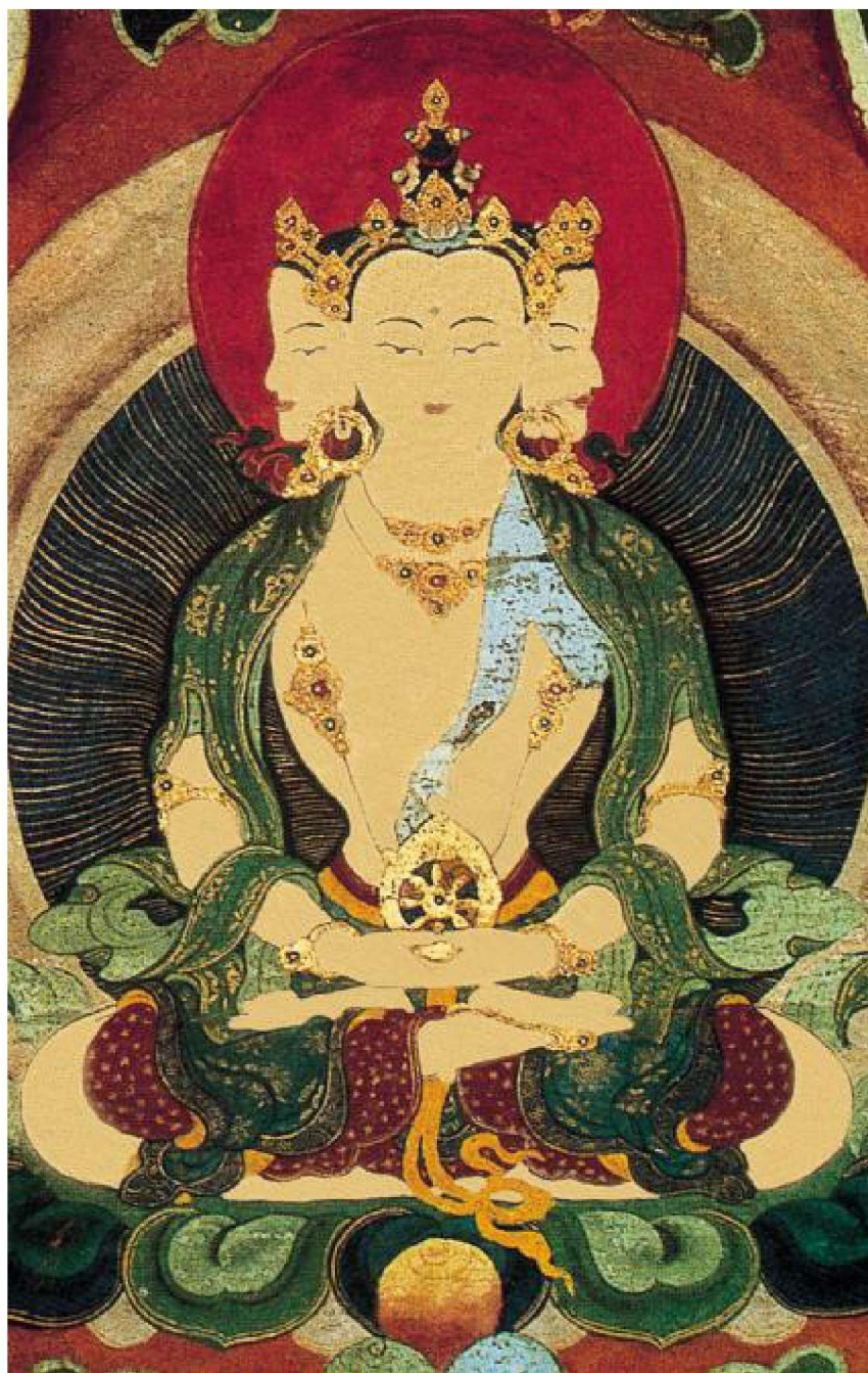
金剛界三面大日如來