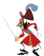
p irate 海盗