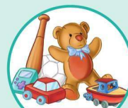
t oy 玩 t