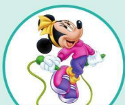
j ump 跳