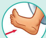
f oot 脚