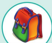
b ack p ack 背包

“ t ” as in t urtle 和 “ t ” 在 “ t urtle” 中发音一样的还有