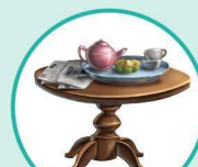
t able 桌 t