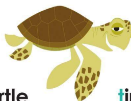
t urtle t ired 乌龟 累

“ p ” as in p irate 和 “ p ” 在 “ p irate” 中发音一样的还有