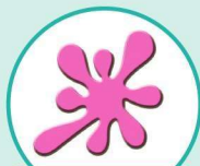
p ink 粉红