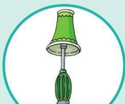
l amp 灯

“ p ” as in p irate 和 “ p ” 在 “ p irate” 中发音一样的还有