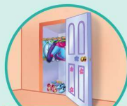
c loset 柜 t 子

“ t ” as in t urtle 和 “ t ” 在 “ t urtle” 中发音一样的还有