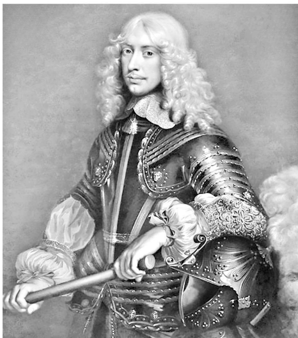
弗朗索瓦·德·旺多姆

然而“喜欢”这个词是否是历史学家对那些爱调情的夫人们与情人之间关系的含蓄表达呢？皮埃尔·斯特罗齐是美第奇王太后的日耳曼表兄，是克拉丽斯·德·美第奇的一个儿子。美第奇王太后为了让人们记得皮埃尔·斯特罗齐，保护了所有斯特罗齐家族的成员。如果美第奇王太后害怕国王——她的丈夫，怀疑她和皮埃尔·斯特罗齐之间存在婚外情，她就不会在1551年为皮埃尔·斯特罗齐辩护了 ① 。布朗托姆曾说，还有一位伟大“波旁人的主宰”——沙特尔主教的代理官弗朗索瓦·德·旺多姆，曾身着“绿色”衣服 ② ，“以为美第奇王太后服务为荣” ③ 。亨利二世知道弗朗索瓦·德·旺多姆只是一个柏拉图式的爱人。尽管亨利二世自己