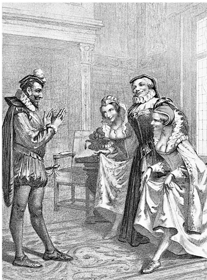
布朗托姆与贵妇们