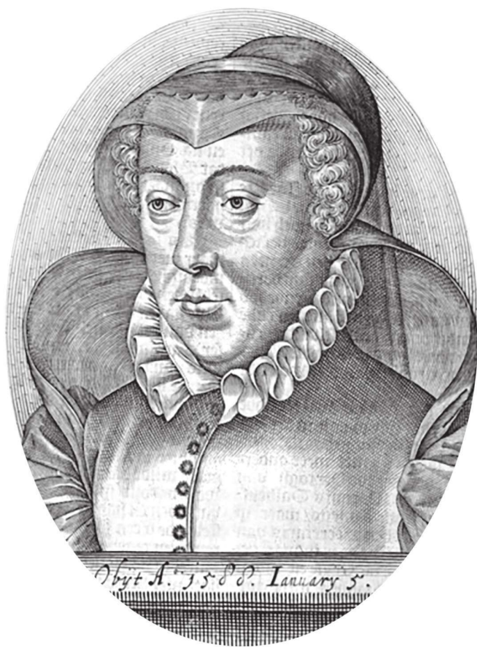
晚年的美第奇王太后