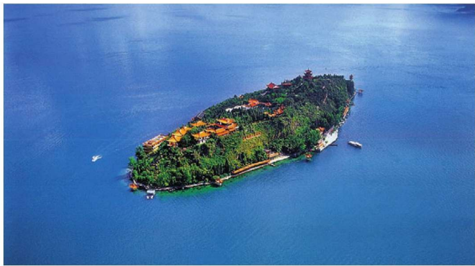
图1-1-2 抚仙湖孤山景区