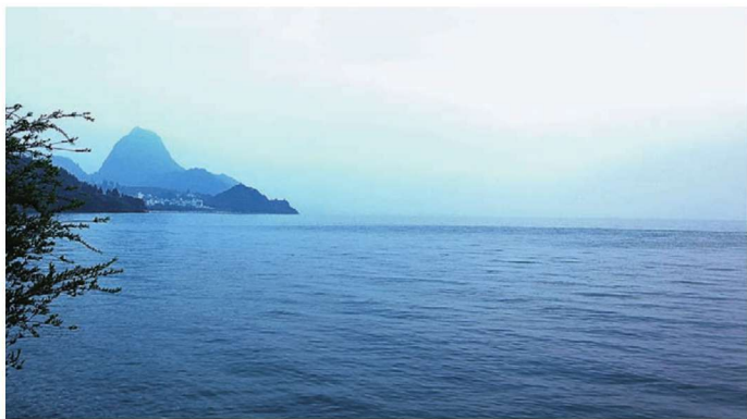
图1-1-3 抚仙湖禄冲景区