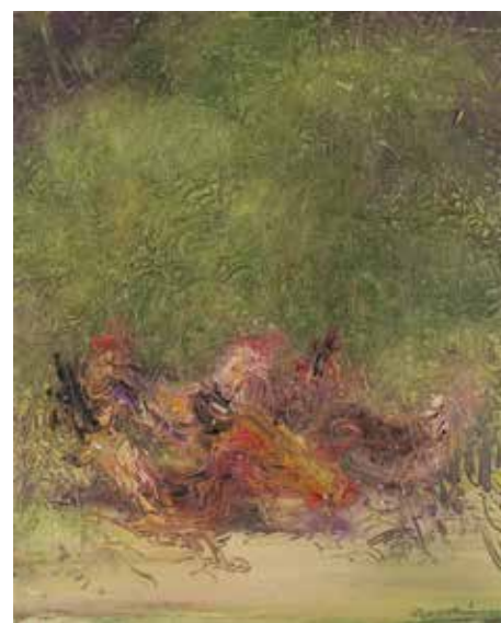
太行 090428 / Taihang 090428 2009