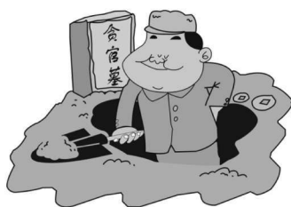
公仆丰碑人民立,贪官坟墓自己掘。