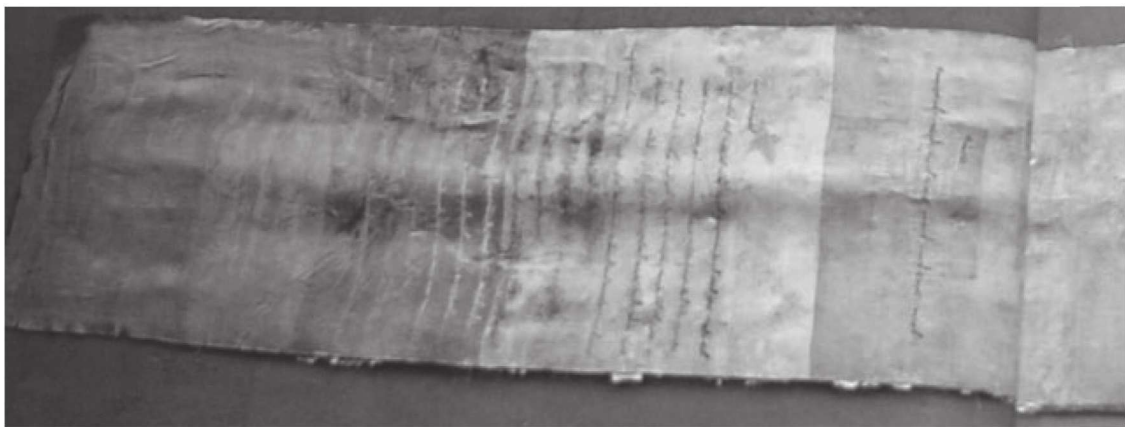
努尔哈赤登基诰命诏书

多尔衮正在和师傅读书。“诸位阿哥，今日的课程首先是检查之前的课业。”李师傅端坐在椅子上对在场诸阿哥说道。和多尔衮一起学习的都是年龄相仿的阿哥，同桌的是多铎，旁边还有十二阿哥阿济格、十三阿哥赖慕布以及皇太极的长子豪格。这些学生中，虽然豪格比十三阿哥赖慕布、十四阿哥多尔衮、十五阿哥多铎早出生几年，但论辈分，豪格是小字辈，对多尔衮等要以叔叔相称呼。