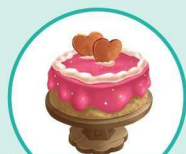
a ke 蛋糕

“ a ” as in a ke 和 “ a ” 在 “ a ke” 中发音一样的还有