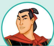
a handsome 英俊的