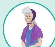
a grandma 祖母