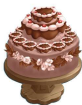
a ke 蛋糕