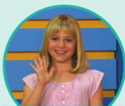
a tie 凯蒂