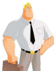
a dd 爸爸

“ a ” as in a pple 和 “ a ” 在 “ a pple” 中发音一样的还有