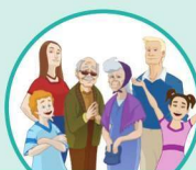
a family 家庭