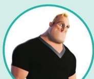
a dd 爸爸

“ a ” as in a pple 和 “ a ” 在 “ a pple” 中发音一样的还有