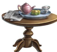
a ble 桌子

“ a ” as in a ke 和 “ a ” 在 “ a ke” 中发音一样的还有