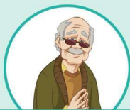
a grandpa 祖父