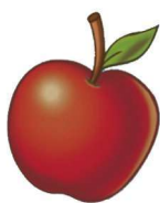
a pple 苹果