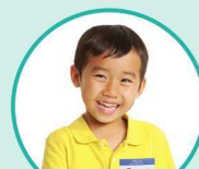
a me 名字