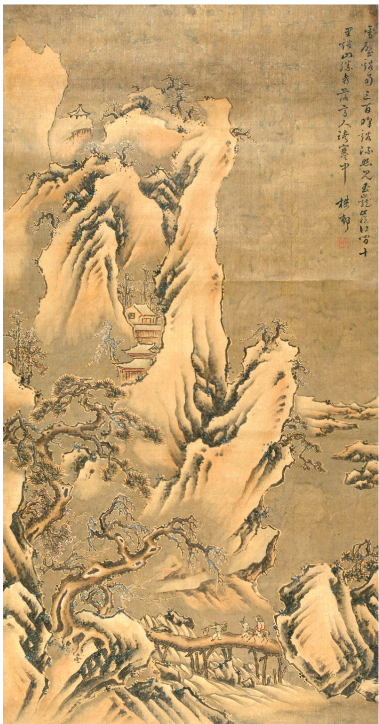
《溪山积雪图》 明末清初·吴梅村 绘