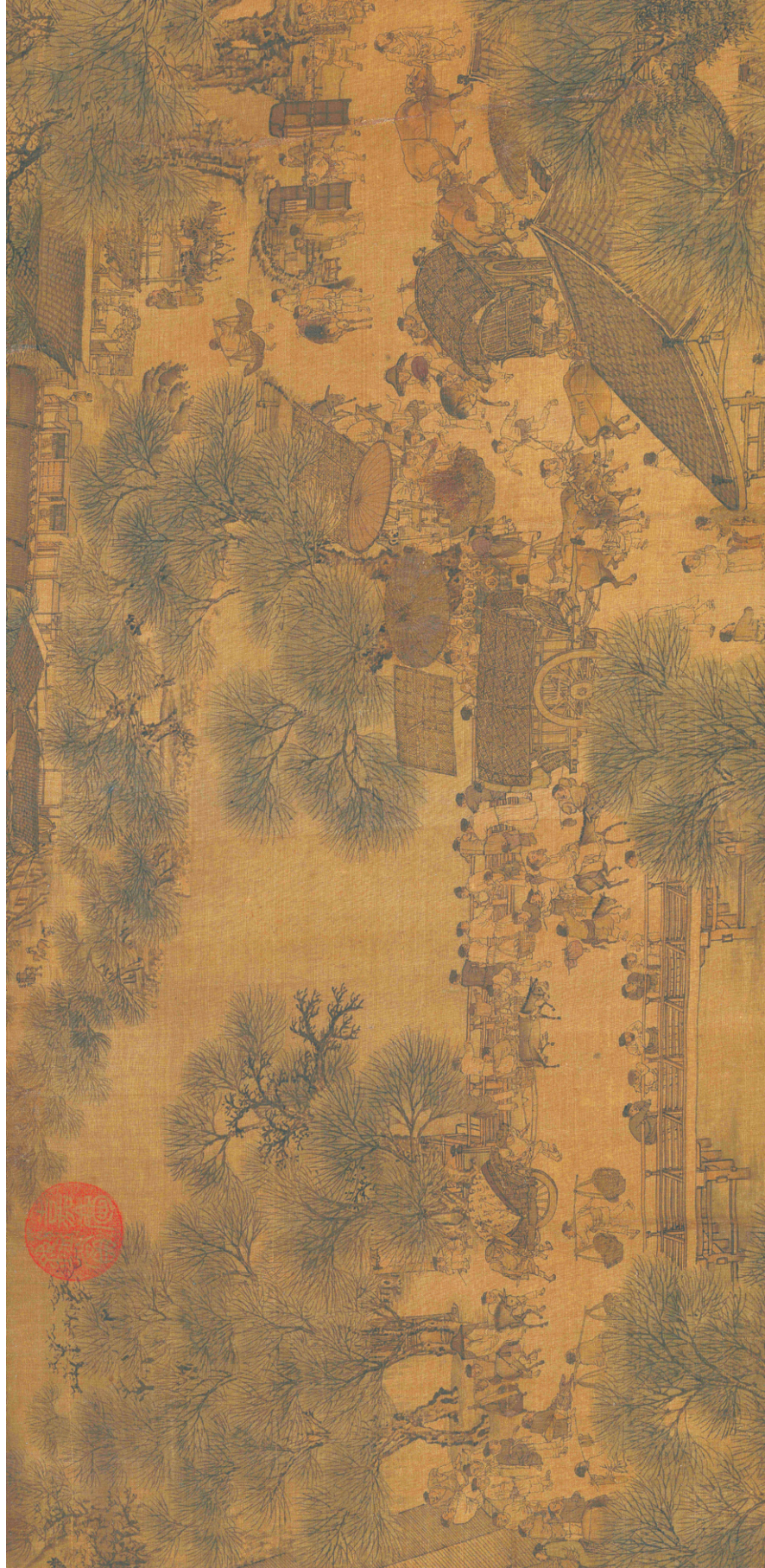
《清明上河图》局部 北宋·张择端 绘