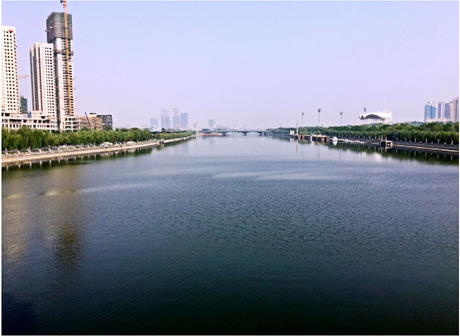
京杭大运河北京段