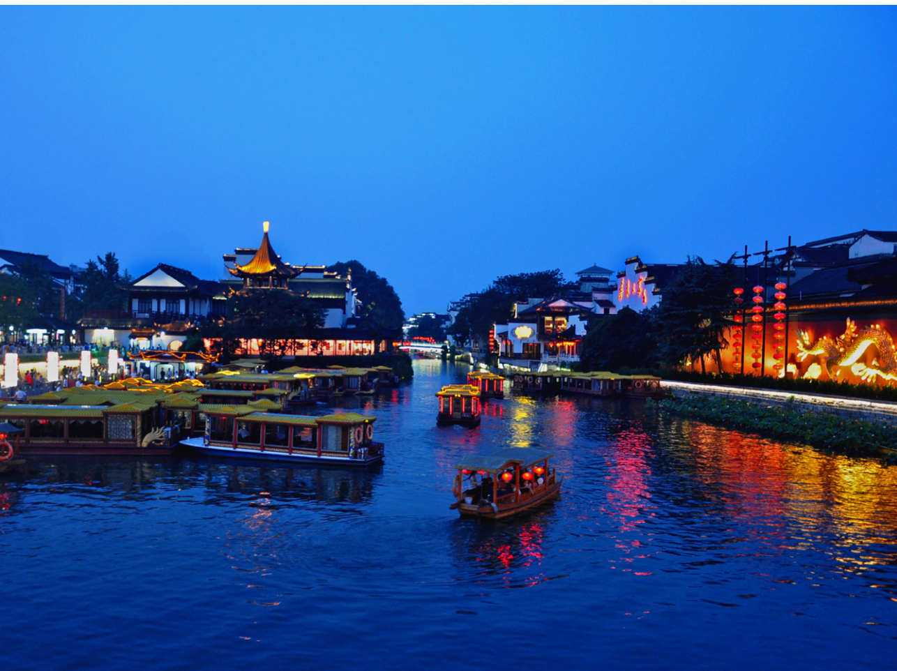
秦淮夜色