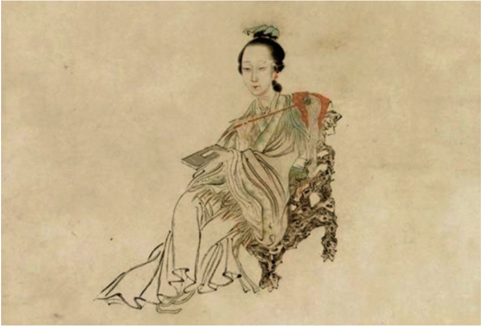
《陈圆圆肖像图》清·焦秉贞 绘