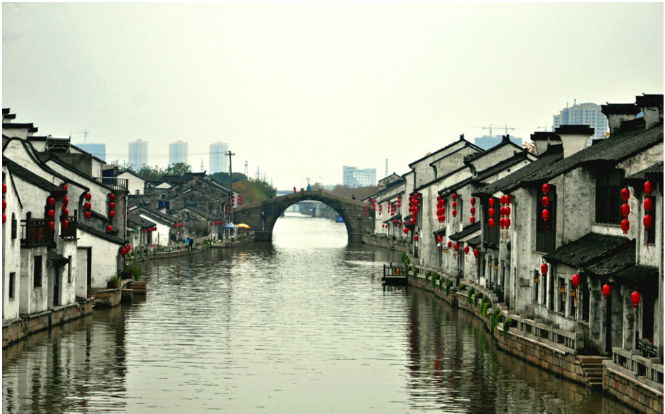
京杭大运河无锡段