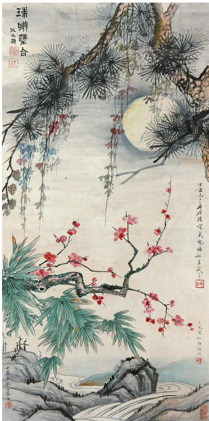
《三友图》 明末清初·冒辟疆 董小宛 蔡含 合绘（冒辟疆绘松月，董小宛绘梅竹，蔡含绘石）