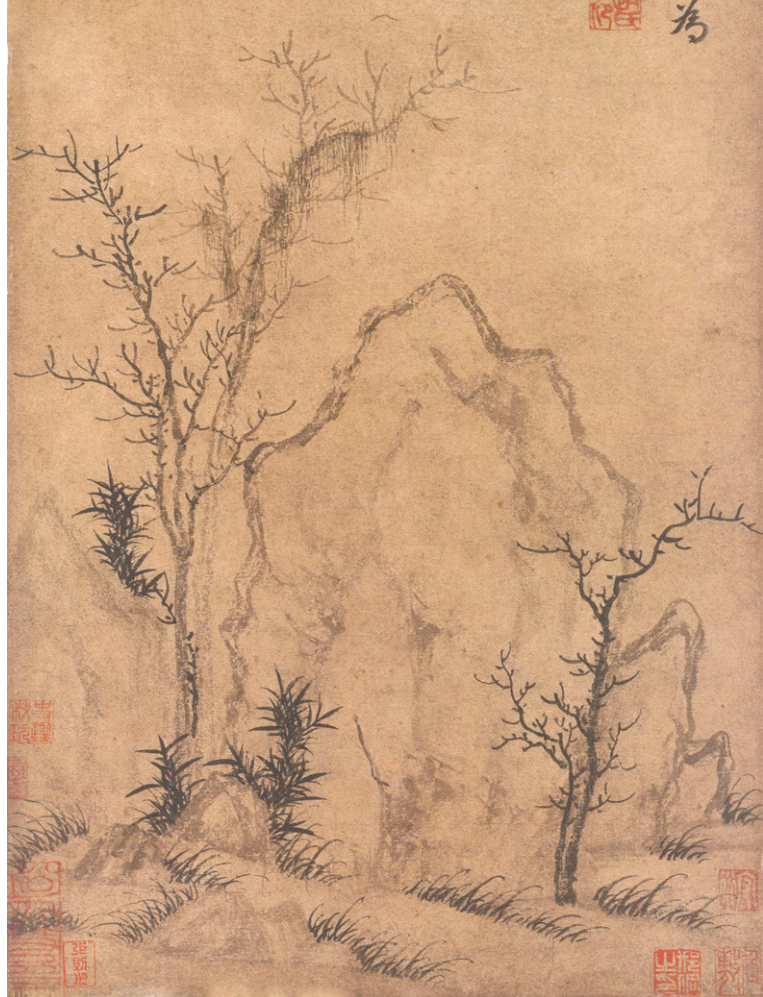
《疏林秀石图》 元·赵孟頫 绘