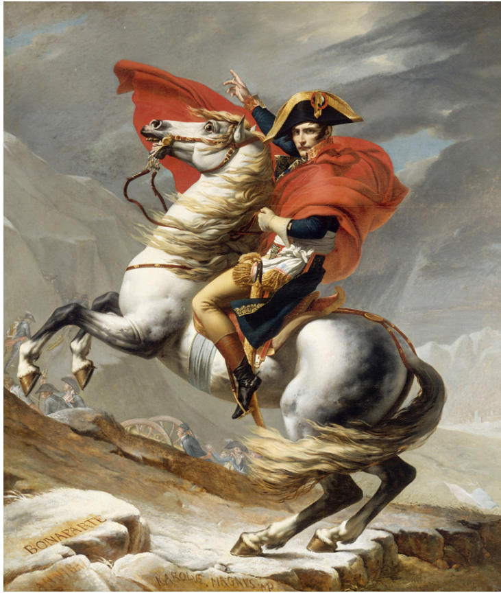
《跨越阿尔卑斯山圣伯纳隘道的拿破仑》 法国 雅克·路易·大卫 绘