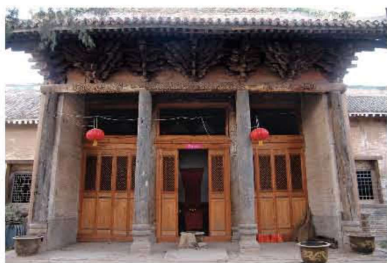
[清代·长治·老爷庙] 二一