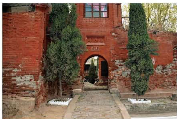
[清代·霍州·圣母庙] 〇一