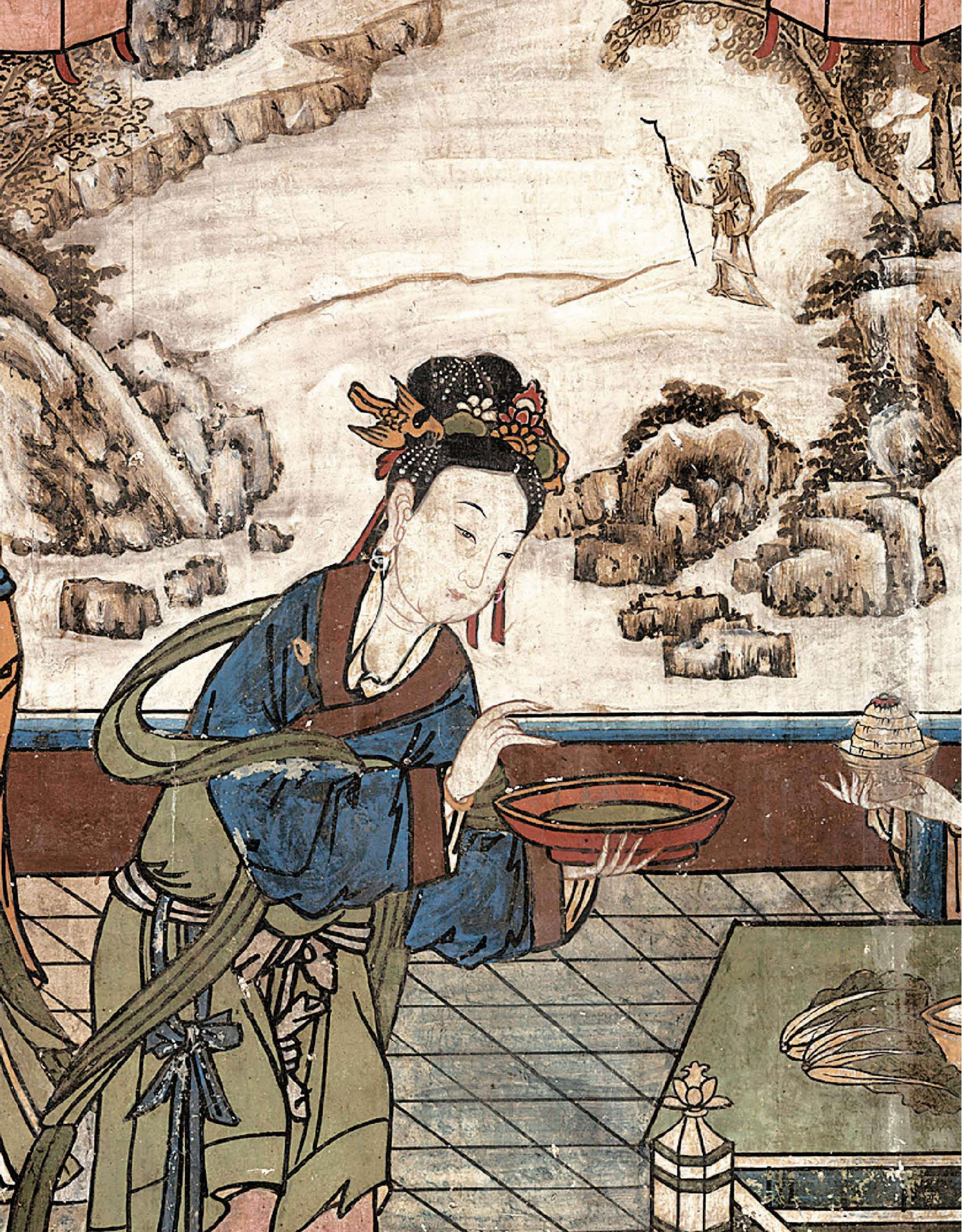
图6 | 膳房备宴图（局部二）