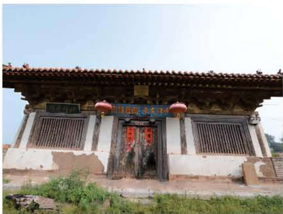
[清代·繁峙·东文殊寺] 三三