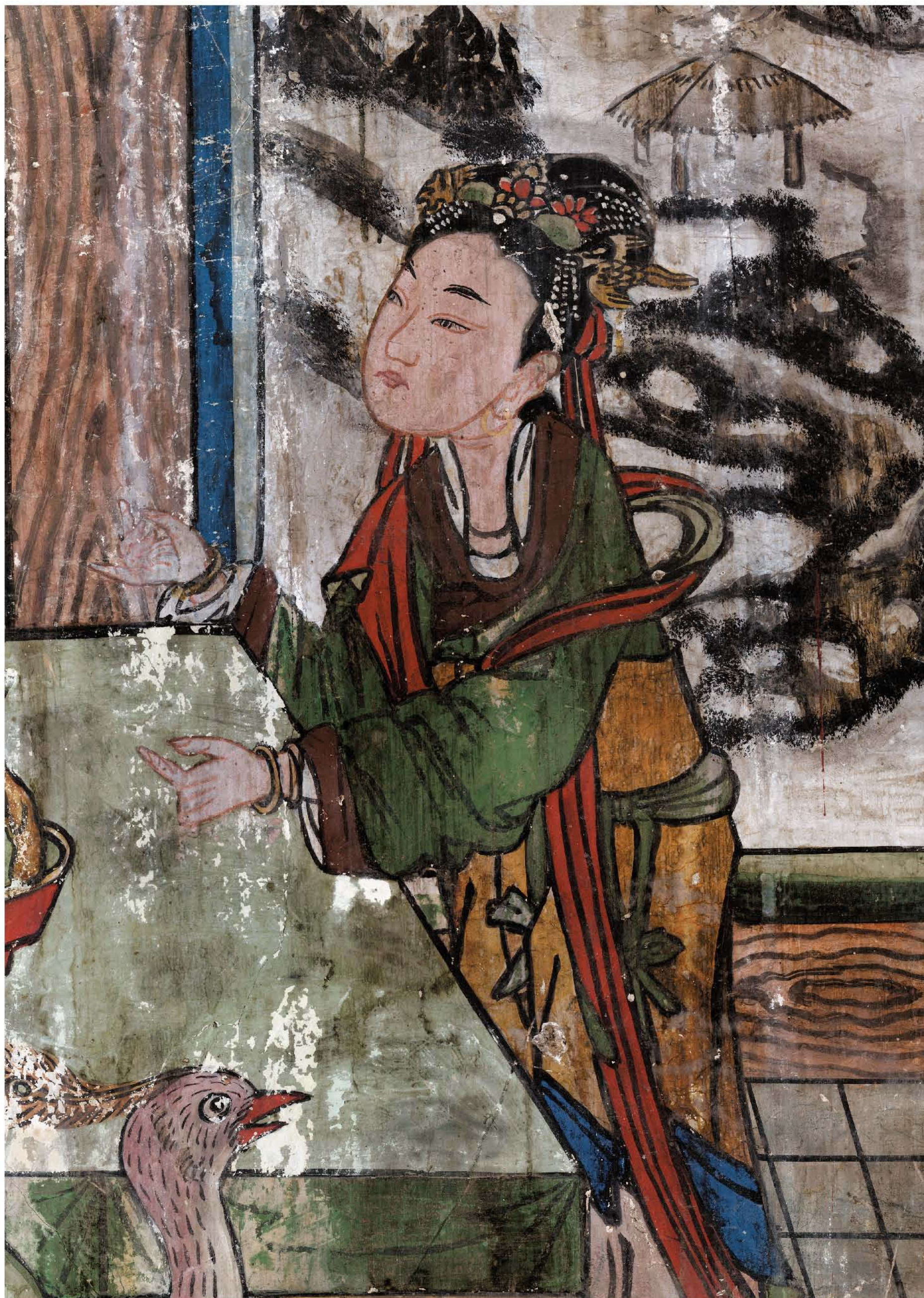
图2 | 后宫尚食图（局部一）

描绘的是宫女正在接寿桃。其衣着素净整洁，短衫长裙，飘带自肩背至两侧垂下，腰间系围裙。