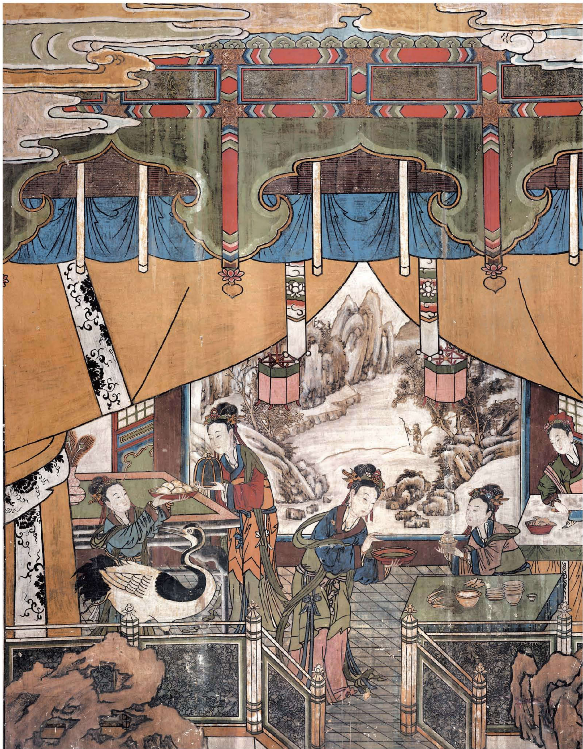
图4 | 膳房备宴图