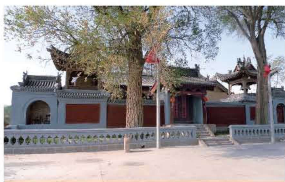
[清代·繁峙·三圣寺] 五七