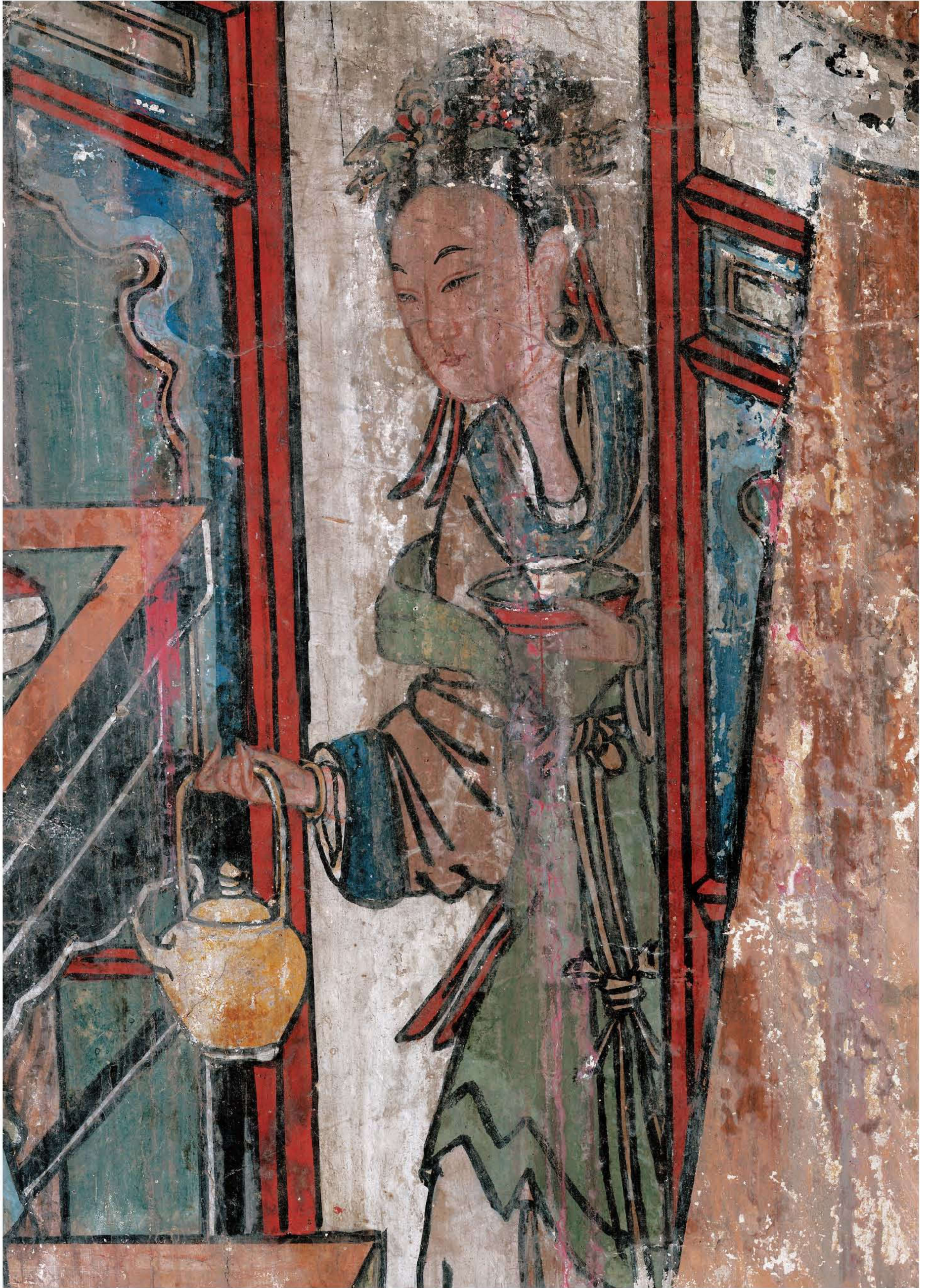
图3 | 后宫尚食图（局部二）