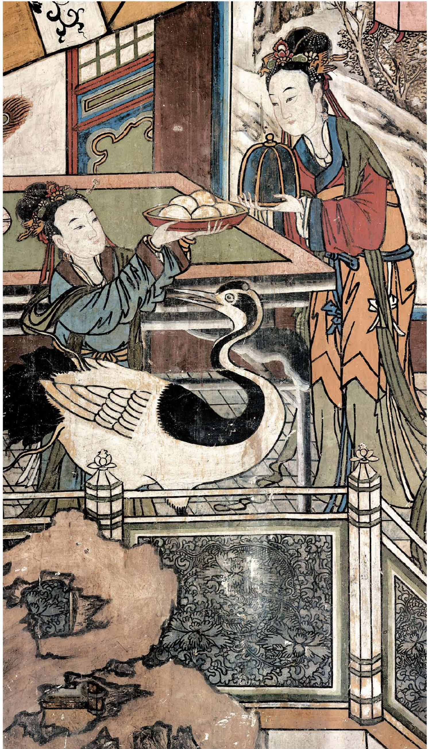
图5 | 膳房备宴图（局部一）