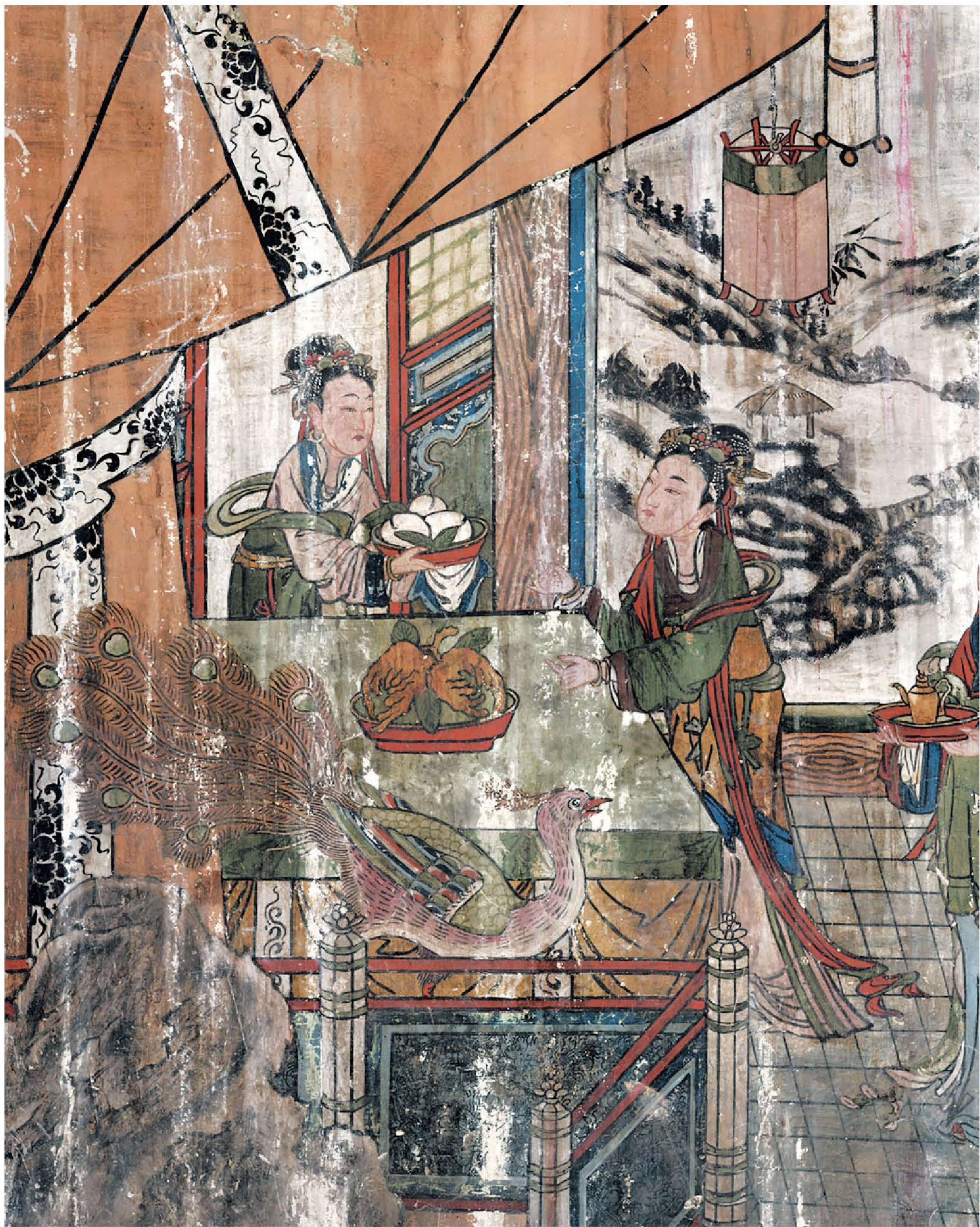
图1 | 后宫尚食图

后宫尚食图共绘五人，均为宫女。对她们描绘，全然是人间生活的真实写照。侍女们头梳双髻，以花带、玉簪、软巾为饰。