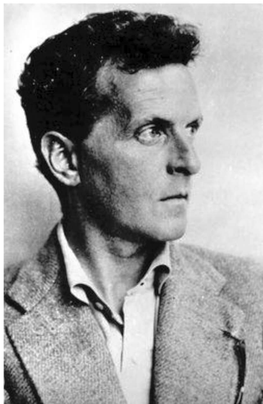
成熟的维特根斯坦