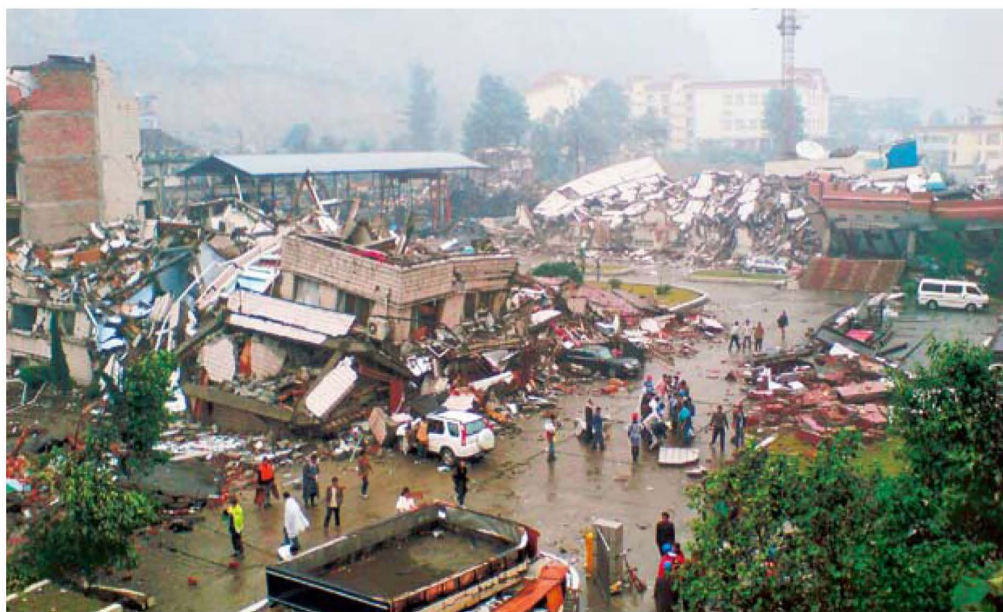
地震造成国家电网映电总厂职工及家属 111 人遇难。图为映秀生产区办公楼坍塌现场