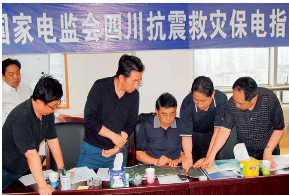
5月17日，电监会四川抗震救灾保电工作指挥部在成都成立。电监会副主席史玉波（右三）任指挥长，电监会安全监管局局长杨昆（右二）、成都电监办专员张健（右一）任副指挥长。图为5月21日，指挥部成员在成都召开岷江流域电站水库大坝险情处置专题会