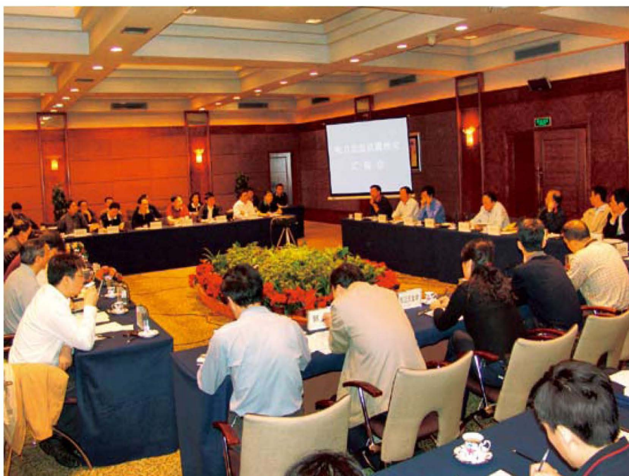
5月14日，电监会四川抗震救灾保电工作组在成都市召开汇报会，来自灾区19家中央和地方电力企业负责人参加会议