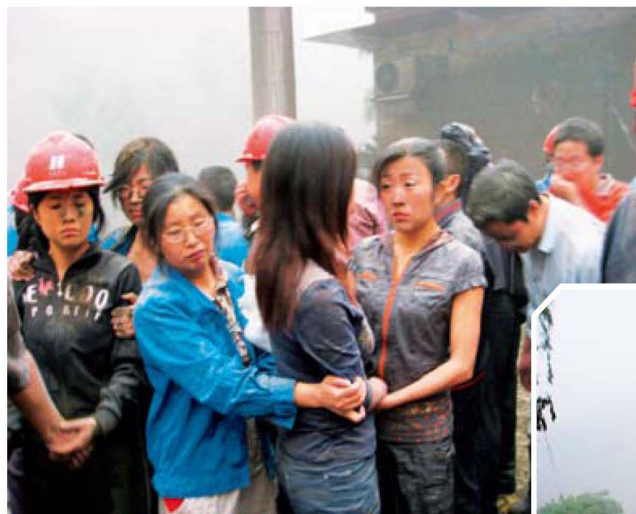
5月12日14时40分，四川省汶川县银杏乡华能太平驿电站职工躲过一劫