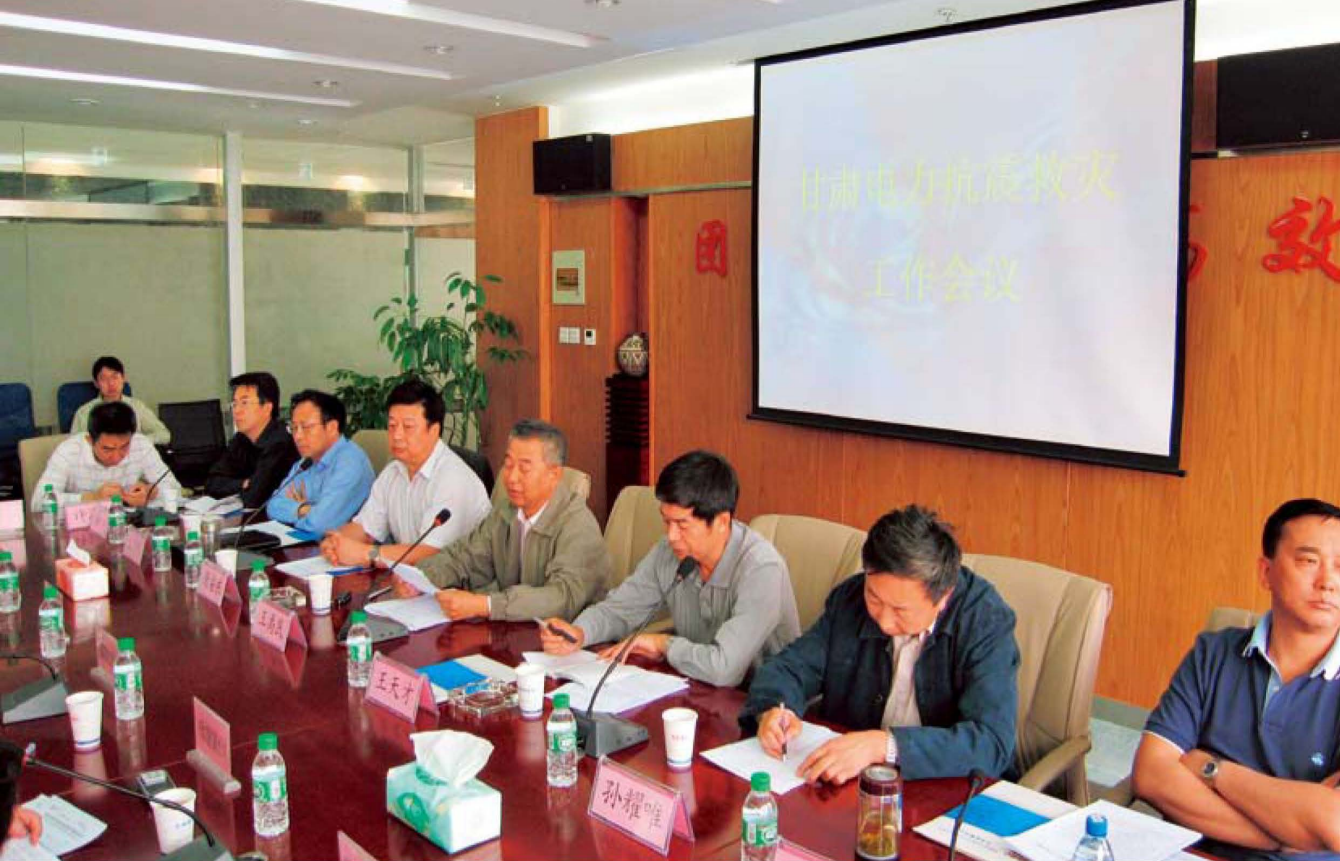
5月14日，电监会甘肃抗震救灾保电指挥部成立。电监会副主席王禹民任组长，成员包括电监会相关部门，甘肃省、陕电省电力企业相关人员。图为5月21日王禹民在兰州主持召开甘、陕两省抗震救灾紧急会议