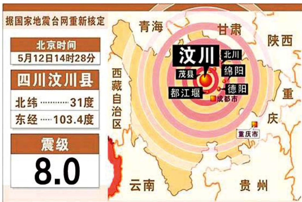
2008年5月12日14时28分，汶川特大地震震波分布示意图（里氏震级8.0级，最大烈度11度，震中位于四川省汶川县映秀镇）

5月12日14时28分，中国四川省汶川县发生8.0级特大地震，烈度11级，震中为映秀镇。此次地震，是新中国成立以来破坏性最强、波及范围最广、灾害损失最大的一次地震灾害。