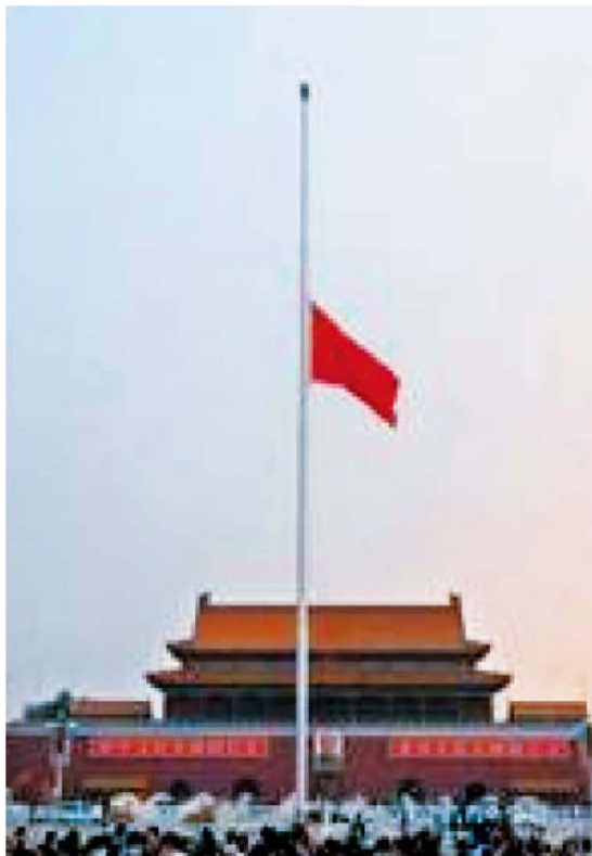
5月19至21日为全国哀悼日，北京天安门广场降半旗致哀