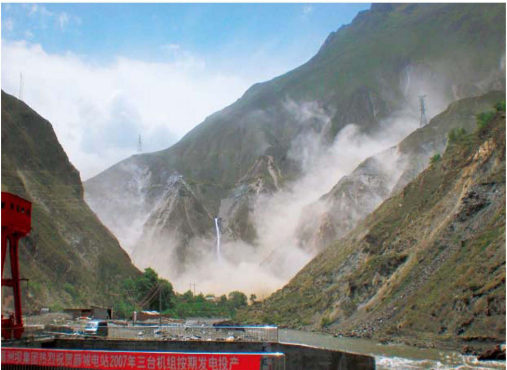
藤城电站山体滑坡