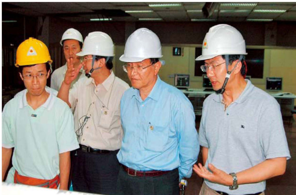
7月4日，国家发改委副主任、国家能源局局长张国宝（右二）在川投江油发电厂指导抗震救灾工作