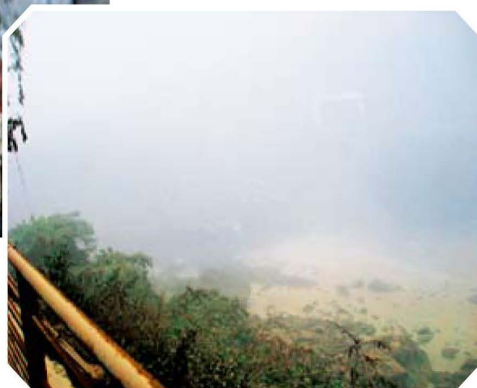
5月12日14时54分，华能太平驿电站被灰尘笼罩