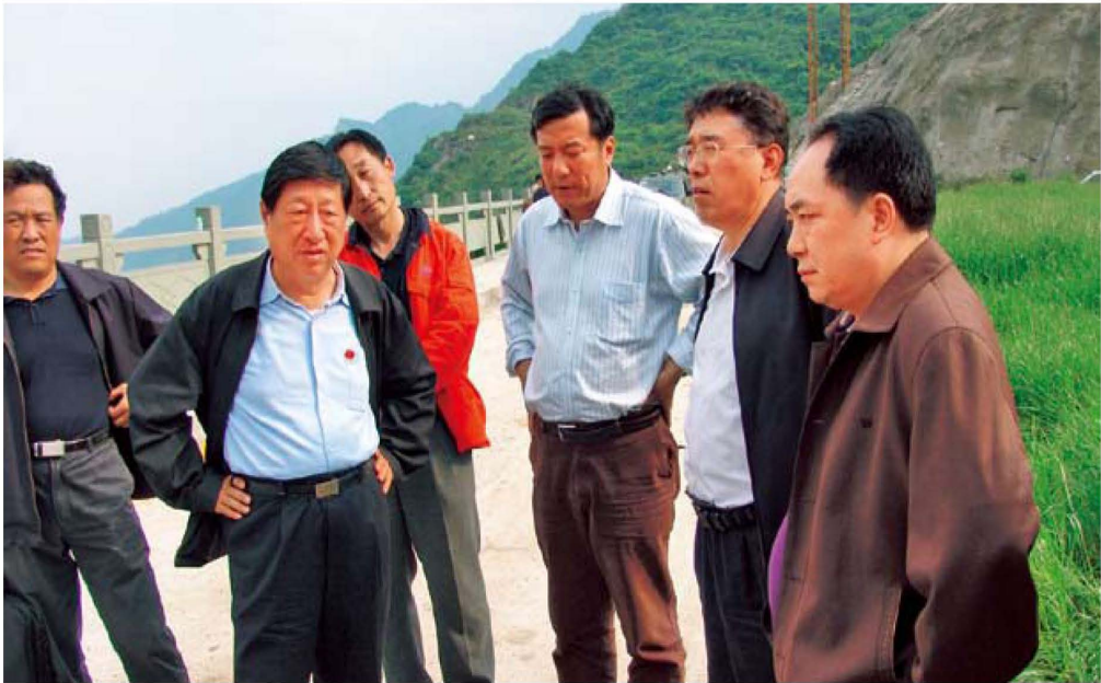
5月14日，四川省紫坪铺镇紫坪铺坝上，国家发改委主任张平（左二）同水利部副部长矫勇（右三）、总工刘宁（左三）、电监会副主席史玉波（右二）、电监会安全监管局局长杨昆（左一）、成都电监办专员张健（右一）在紫坪铺大坝上商议岷江除险