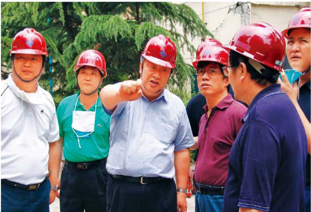
电监会主席王旭东多次主持召开系统紧急会议，传达国务院抗震救灾会议精神，并于5月21日抵达四川灾区一线指挥。图为王旭东（左三）、总监谭荣尧（前右二）在中国水电十局指导抗震救灾工作，同中国水电十局局长杜学泽（左一）商议救灾方案