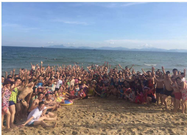
《领袖演说秘训》班深圳大梅沙留影