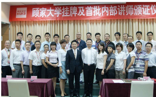
顾家大学首批内部讲师颁证仪式