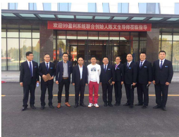
作者服务蓝天家居，与蓝天家居董事长及营销精英合影