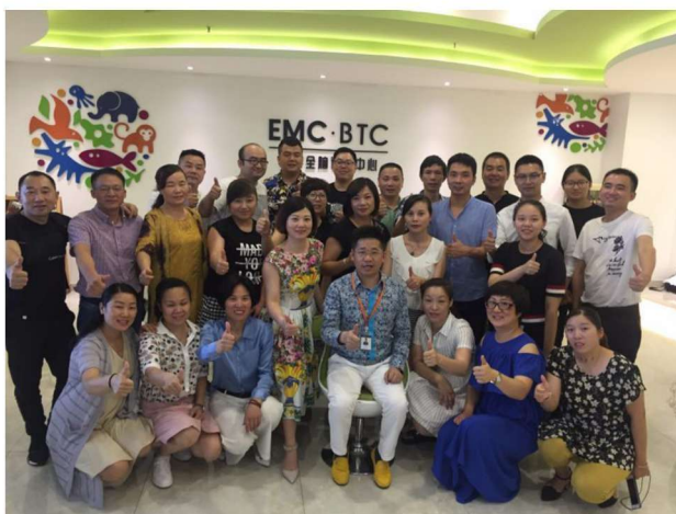
《领袖演讲》班杭州 EMC 小灶班