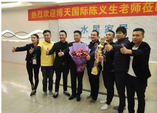
作者服务水星家居，与水星家居董事长及营销精英