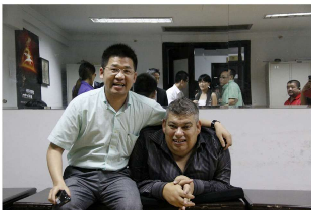
作者与世界激励大师约翰库提斯(右)