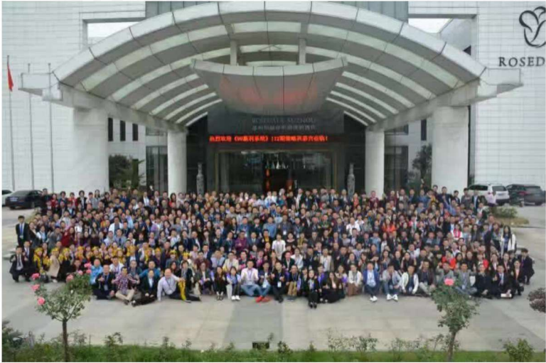
《99 赢利系统》策略班课堂合影