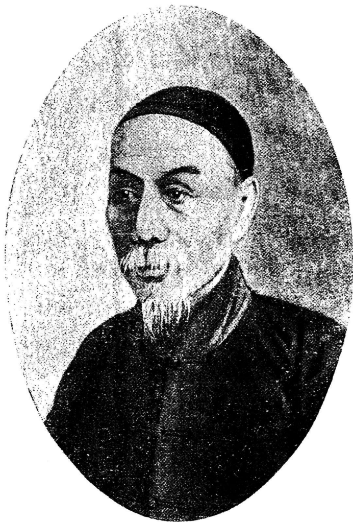
貞文先生七十年象