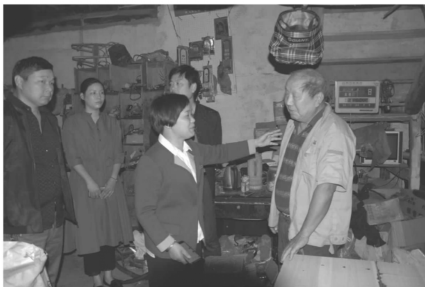
娟子工作室成员走访看望困难群众