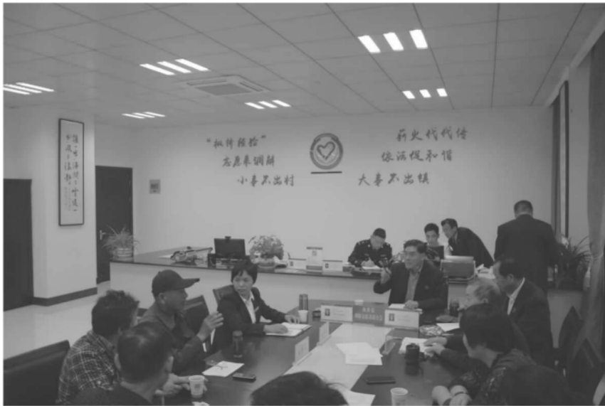
枫桥镇人民调解委员会成功调解一起交通事故纠纷案