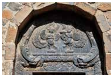
法玩禅师塔门额石雕

明显变短，各层塔檐紧密相连。第一层以上各层之间基本不设门窗、柱子等结构。早期的密檐式塔还开设小型假窗或采光小孔，后期也逐渐消失。塔身的内部一般是空筒式的，大部分不太适合登临眺览。既使有的塔内设有楼梯可以攀登，而内部实际的塔层数通常也会少于外部所显露出来的塔檐层数。辽、金之后，绝大多数密檐式塔均为实心塔，仅少数塔的内部还建造成空筒状或较小的塔心室。国内著名的密檐式塔有登封的嵩岳寺塔、法王寺塔、永泰寺塔，以及西安的小雁塔和大理的崇圣寺千寻塔等。从大的分布区域来看，我国北方的密檐式塔远远多于南方。