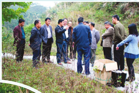
2016年3月3日，自治区水利厅专家对朋怀水库进行下闸验收