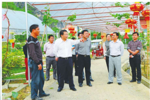
2015年5月18日，百色市委书记、人大常委会主任彭晓春（前左二）到化峒农业生产基地调研