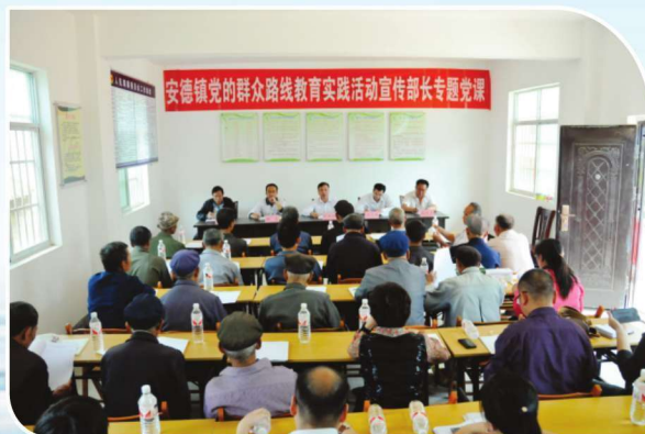
2014年5月7日，靖西县委宣传部，在安德镇安德街组织召开党的群众路线教育实践活动