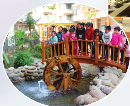
第一幼儿园园林式校园

教育精准扶贫实现全覆盖。做好各类学生补助发放工作，争取国家惠民政策，实现寄宿生生活补助、高中生免学费、困难大学新生等各种学生资助的全覆盖。年内发放各种资质资金7953.867万元，保证每一位学生不因家庭经济困难而失学。荣获百色市学生资助工作先进单位。