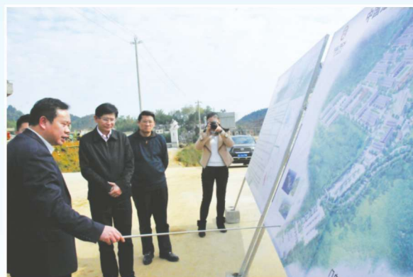
2014年2月20日，自治区党委常委、副主席蓝天立（左二）到万生隆国际贸易物流中心考察调研