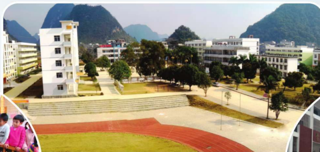
靖西市民族中学校园