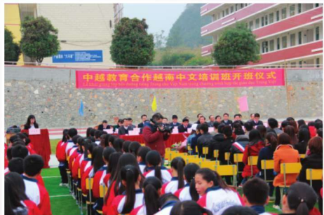
2015年12月19日，靖西职业技术学校举办中越教育合作越南中文培训班开班仪式

2015年，靖西教育工作以撤县设市为契机，大力强化基础设施建设，引进外部优质资源，大力推进依法治教，努力办人民满意的教育。