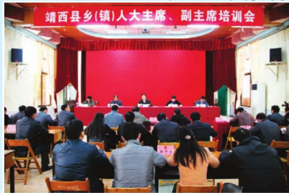
2014年3月8日，全县乡镇人大主席、副主席培训会