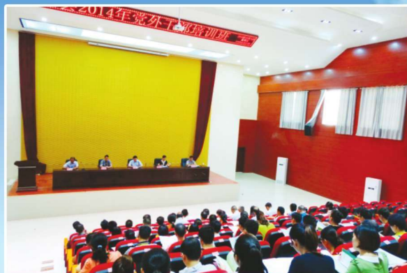
2014年党外干部培训班

中国共产党靖西县委统一战线工作部（简称中共靖西县委统战部）内设县委台湾工作办公室、县人民政府台湾事务办公室，县人民政府宗教事务局，行政编制7名。2014年，在编干部职工8人，其中部长1名，由县委常委兼任，副部长2名，副部长分别兼任县台办主任和县宗教局局长，干部4名，司机1名。