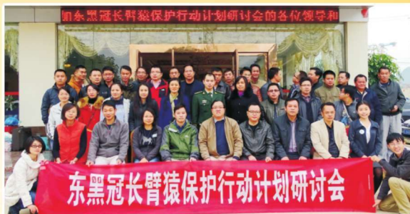
2014年12月8日，东黑冠长臂猿保护行动计划研讨会开班集体合影留念

2014年，靖西县委认真贯彻落实党的十八大和十八届三中、四中全会以及习近平总书记系列重要讲话精神，坚持稳中求进工作总基调，统筹做好稳增长、调结构、促改革、惠民生各项工作，推进经济社会实现平稳较快发展。2014年，全县地区生产总值完成129.92亿元，比上年增长11.7%；工业实现增加值85.62亿元，增长14.4%；固定资产投资完成130.01亿元，增长15.1%；财政收入完成13.87亿元，增长6.2%；社会消费品零售总额完成23.19亿元，增长12.3%；外贸进出口总额完成58亿元；城镇居民人均可支配收入、农民人均纯收入完成20228元和5423元，分别增长12%和15%。综合经济实力在百色市12个县区中居第二位，财政收入在广西111个县域中居前12位，工业化率居广西前3位。