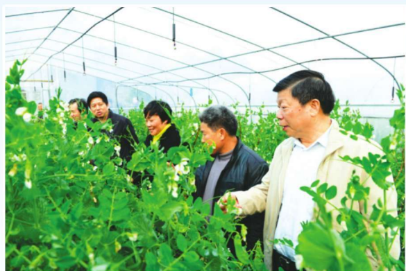
2015年2月13日，自治区党委常委、政法委书记温卡华（右一）到靖西考察农业大棚蔬菜种植