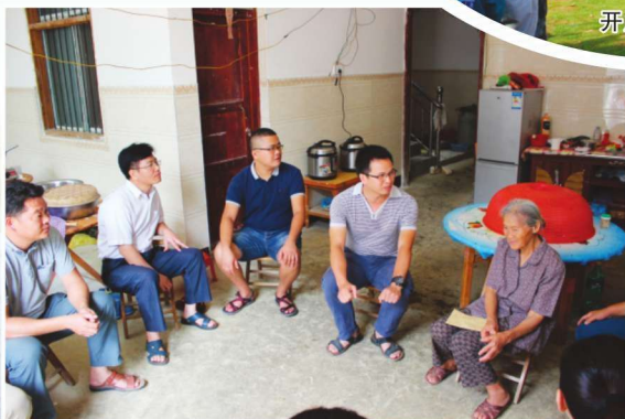
2016年6月30日，靖西市水利局领导慰问困难党员