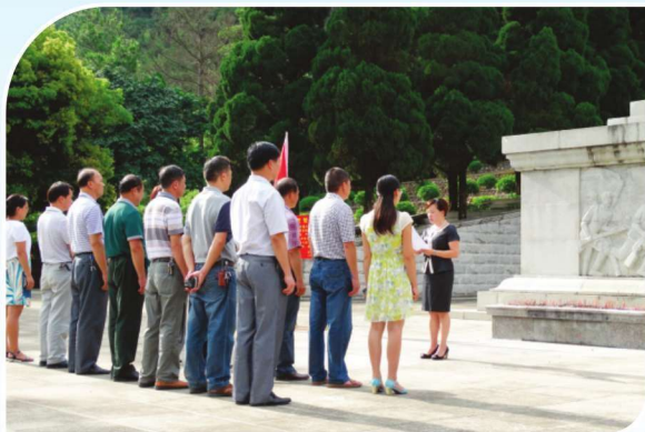
2014年“七一”靖西县委统战部带领非公有制经济人士到烈士陵园开展纪念活动

2014年，靖西县委统战部以党的十八大、十八届三中、四中全会精神为指导，认真履行统一战线增进团结、凝聚人心、汇聚力量的使命，全面提高统战工作科学化水平，加快转变经济发展方式，深入推进各项统战工作顺利开展，为建设富裕文明和谐新靖西做出新的贡献。