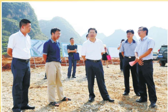
2014年12月22日，靖西县委书记黄小宁（左二）陪同百色市委书记彭晓春（右三）调研创业园