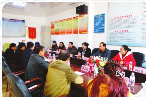
2013年8月27日，靖西县委统战部与县工商联带领女商会到田阳中小企业商会交流