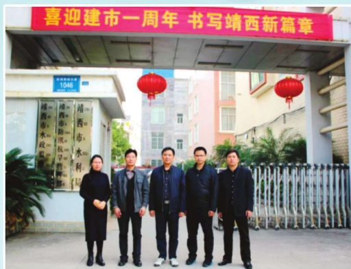
靖西市水利局领导班子

靖西市水利局是由靖西市人民政府主管的全市水利、地方电力行政的职能部门，属国家行政机关单位，内设机构有局办公室、计划财务股、水政水资源股。二层机构8个，分别有水利水电建设站、水利水土保持管理站、水政监察大队、防汛抗旱办公室、水电物资管理站、地方电力管理站、水利工程质量与安全监督站、大龙潭水库管理所。下属企业有乡（镇）供水中心。全局核定编制58名，在编干部职工53人。