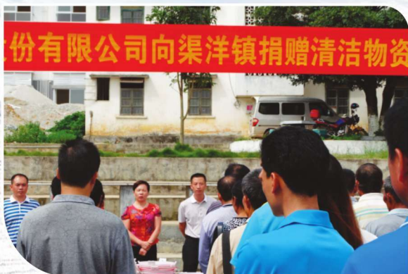
2013年5月18日，靖西县委统战部带领非公企业到渠洋镇捐赠垃圾桶