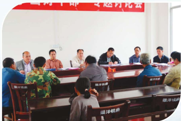
2014年5月5日，靖西县委政法委会同司法局到渠洋镇开展矛盾纠纷化解工作