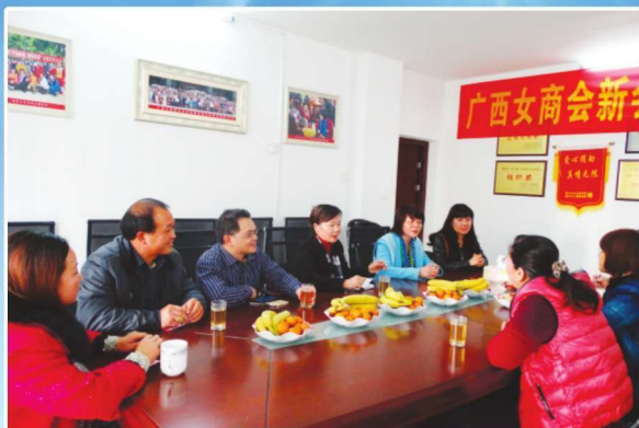
2014年8月28日，靖西县委统战部与县工商联带领女商会到广西商会交流