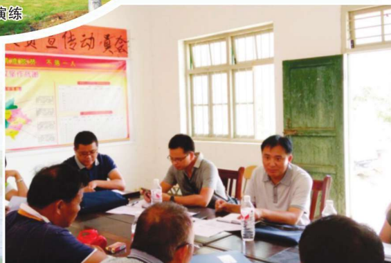
2015年9月3日，靖西市水利局领导到渠洋镇新和村召开精准扶贫工作座谈会