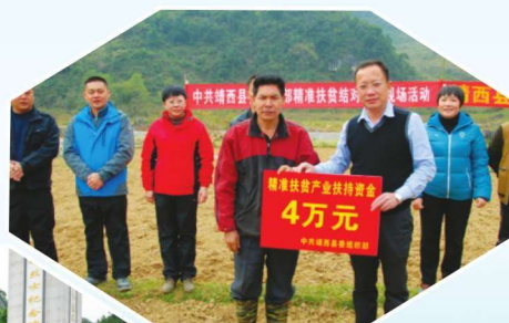
2014年12月17日，为挂点贫困村捐赠产业扶贫资金，扶持党员群众发展产业