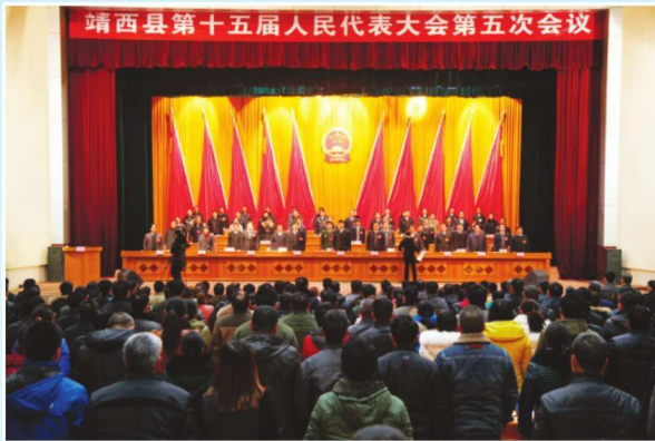
2014年2月20日，第十五届人民代表大会第五次会议会场