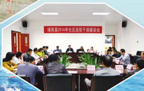
2014年4月17日，注重挂职干部的锻炼和培养。图为座谈会上挂职干部交流工作心得体会