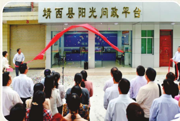
2014年10月14日，靖西县阳光问政平台挂牌成立