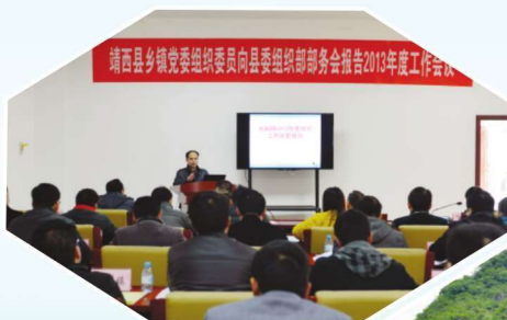
2014年4月20日，实行乡镇组委向组织部部务会作年度工作汇报

中共靖西县委组织部（简称靖西县委组织部）是县委重要的职能部门，是党委在组织工作方面的参谋和办事机构。业务上受市委组织部指导，内设办公室、组织一股（同时挂县农村基层组织建设领导小组办公室牌子）、组织二股（同时挂县委组织部办公室牌子）、调研室、干部一股、干部二股（同时挂干部调配股牌子）、干教股、人才工作股、干部监督股（同时挂举报中心牌子）等股室。有编制18名，2014年在编人员16人。主要职责：负责党组织特别是党的基层组织建设的指导、协调和宏观管理；负责研究和指导干部人事制度改革，参与制定组织、干部、人事工作的重要政策和制度；负责提出县直各部门和乡（镇）领导班子调整配备的意见和建议，承办有关干部的调配、交流、安置工作，制定并组织实施后备干部队伍建设规划；负责全县干部教育培训和监督管理工作；负责对全县知识分子工作的指导、协调和宏观管理；负责对全县老干部工作的宏观管理等。