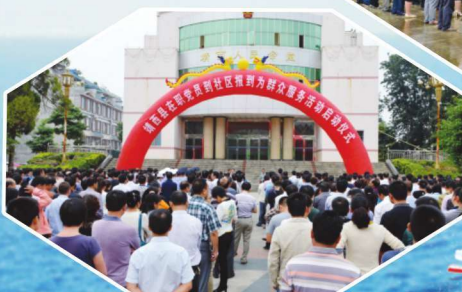
2014年10月13日，开展在职党员到社区为群众服务活动。图为启动仪式现场