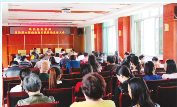
2014年12月18日，召开党的群众路线教育实践活动总结大会