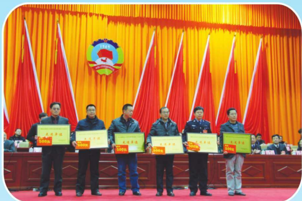
2014年2月19日下午，靖西市政协在县会议中心一楼大会议室召开中国人民政治协商会议靖西县第八届委员会第四次会议表彰大会。图为会议表彰提案承办先进单位