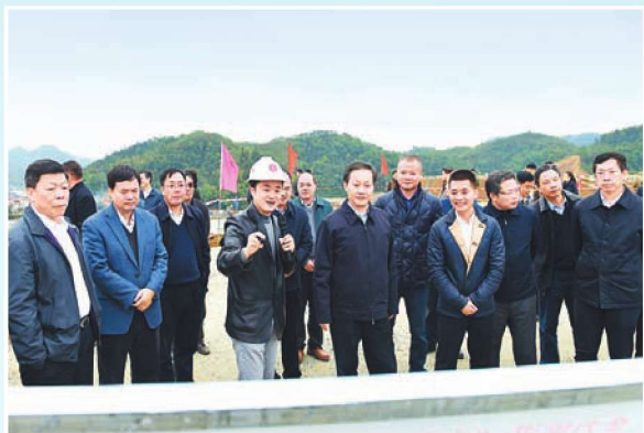
2016年1月15日，自治区党委书记、人大常委会主任彭清华（前排左四）到项目现场调研