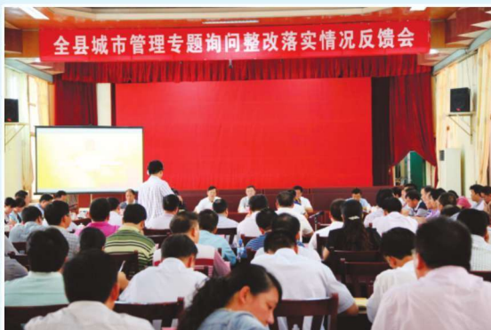
2014年8月28日，全县城市管理专题询问整改落实情况反馈会