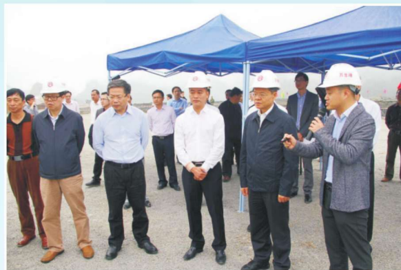
2016年4月21日，自治区主席陈武（前排右二）到项目现场检查工作