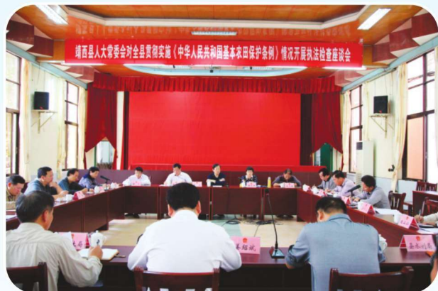
2014年10月29日，对全县贯彻落实实施《中华人民共和国基本农田保护条例》情况开展执法检查

2014年，靖西市人大常委会主任1人，副主任4人，调研员2人。市人大常委会机关设办公室、财政经济工作委员会、内务司法工作委员会、代表联络工作委员会、民族教科文卫工作委员会、信访室，编制20名（包括常委会主任、副主任、调研员、助理调研员），实有在职人员24人。县第十五届人民代表大会第五次会议于2014年2月19日至20日在靖西人民会堂举行，出席会议代表244人，列席人员208人，会议听取和审议县人民政府工作报告，审查、批准靖西县2013年国民经济和社会发展计划执行情况的报告与2014年国民经济和社会发展计划草案的报告，审查靖西县2013年财政预算执行情况报告和2014年财政预算草案报告等内容。2014年共召开了县第十五届人大常委会会议11次。