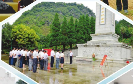
2014年7月1日，组工干部在七一党日活动中重温入党誓词，坚定理想信念