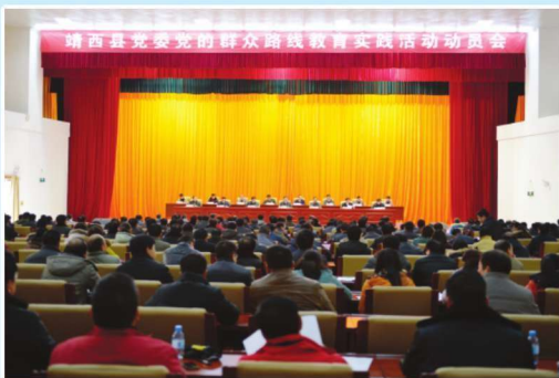
2014年4月22日，靖西县党的群众路线教育实践活动动员大会会议现场

中共靖西县委组织部（简称靖西县委组织部）是县委重要的职能部门，是党委在组织工作方面的参谋和办事机构。业务上受市委组织部指导，内设办公室、组织一股（同时挂县农村基层组织建设领导小组办公室牌子）、组织二股（同时挂县委组织部办公室牌子）、调研室、干部一股、干部二股（同时挂干部调配股牌子）、干教股、人才工作股、干部监督股（同时挂举报中心牌子）等股室。有编制18名，2014年在编人员16人。主要职责：负责党组织特别是党的基层组织建设的指导、协调和宏观管理；负责研究和指导干部人事制度改革，参与制定组织、干部、人事工作的重要政策和制度；负责提出县直各部门和乡（镇）领导班子调整配备的意见和建议，承办有关干部的调配、交流、安置工作，制定并组织实施后备干部队伍建设规划；负责全县干部教育培训和监督管理工作；负责对全县知识分子工作的指导、协调和宏观管理；负责对全县老干部工作的宏观管理等。