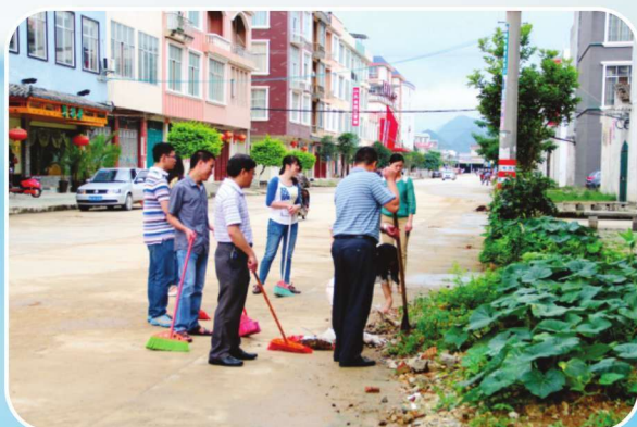
2014年10月14日，财政局开展责任区清洁卫生活动

靖西县财政局是负责编制年度县本级预、决算草案，主管全县财政收支、财税政策和实施财政监督的政府工作部门，内设办公室、稽查分局、资金管理所、投资评审中心、国库支付中心、综合股非税股、预算股、国库股、行政政法股、教科文股、经建股、社保股、农业股、农村财政财务管理股、企业股、会计管理股、国资股、监督检查股、人事股、金融股、法规税政股、信息中心、采购管理股、车辆定编办、农发办、票据管理中心、预算编审中心、票据管理中心、会计函授站等29个职能股室。2014年，局机关在职干部职工69人。全县设有1个财政分局，18个财政所，有干部职工74人。2014年，靖西县财政局深入贯彻落实科学发展观，紧紧围绕全县重点工程和中心工作，充分发挥财政职能作用，把握“稳中求进”总基调，实施好积极的财政政策，全力以赴做好稳增长、促转型、调结构、惠民生、促和谐等各项工作，财政改革与管理稳步推进，预算执行总体保持平稳。