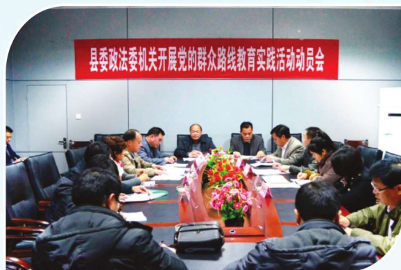
2014年2月27日，靖西县委政法委召开开展党的群众路线教育实践活动动员会