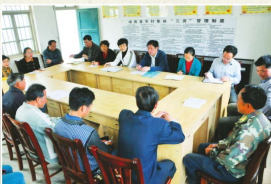
2014年4月9日，靖西县纪委监察局班子与禄峒乡农贡村、大院村党员干部和群众代表座谈，征求党的群众路线教育实践活动开展意见