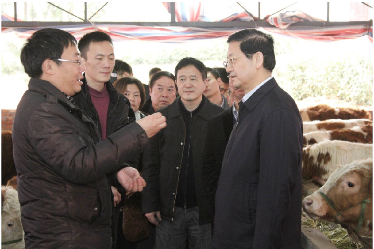
3月4日，省委常委、省纪委书记王怀臣（右一）在马边珍珠桥村养牛场基地调研。