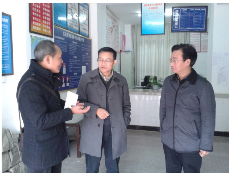
12月12日，市委常委、组织部长杨程富（中）在马边民建镇调研。