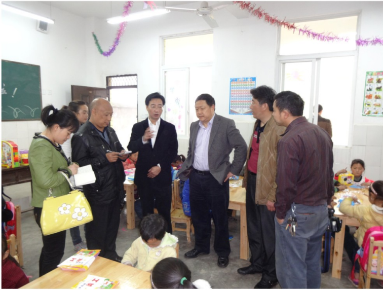
4月10日，市委常委、组织部长张富国（右三）参加灯杆堡村幼儿园开班仪式。