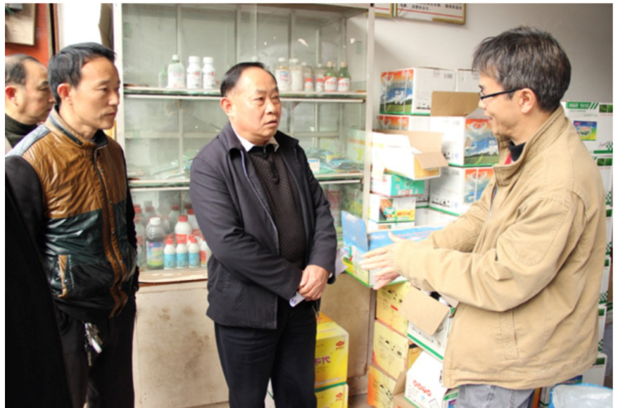
12月2日，市人大常委会副主任杨良清（右二）在马边调研农村综合服务体系建设情况。