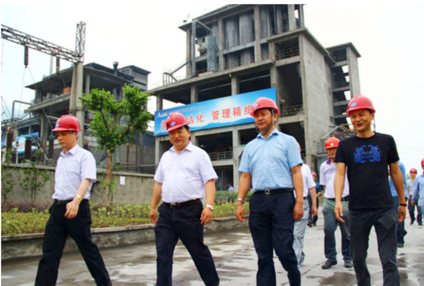
6月19日，副市长阿刘时布（右二）到马边指导服务经济稳增长工作。