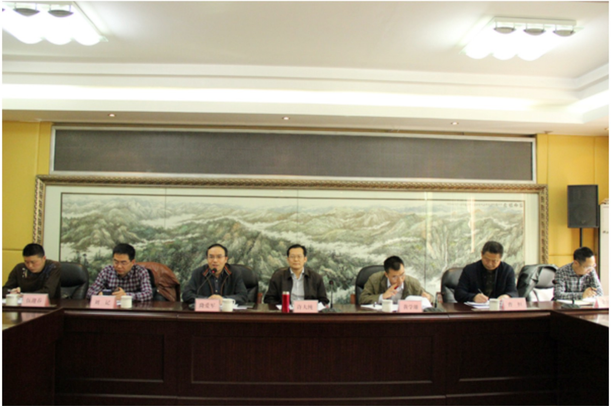
11月3日，国土资源部矿产资源储量司司长许大纯（中）到马边检查指导国土资源管理和乌蒙山片区扶贫工作情况。