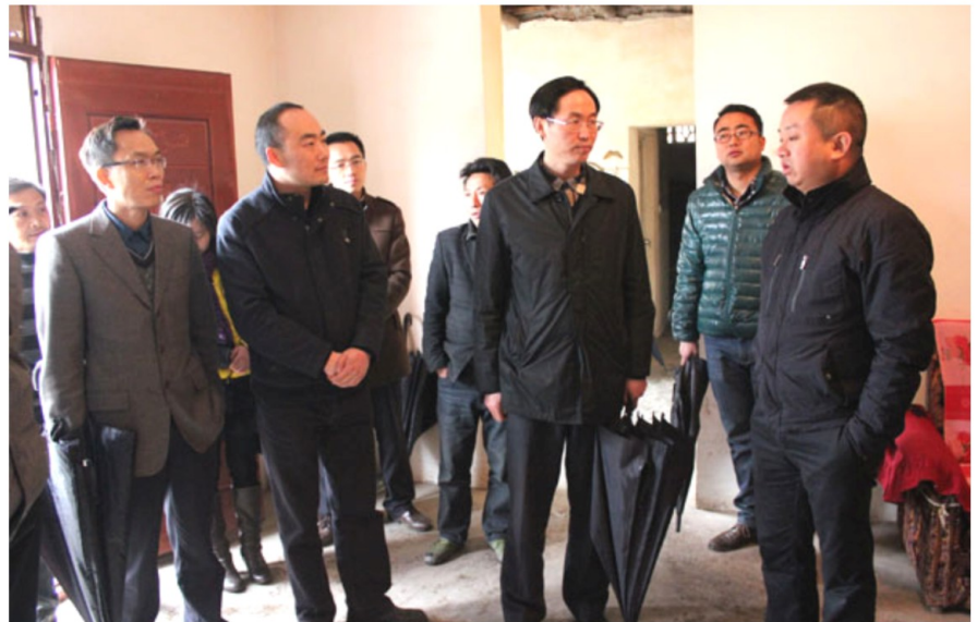
3月20日，省质量技术监督局副局长周传军（右三）在马边收坝乡春林村开展“双联”工作。