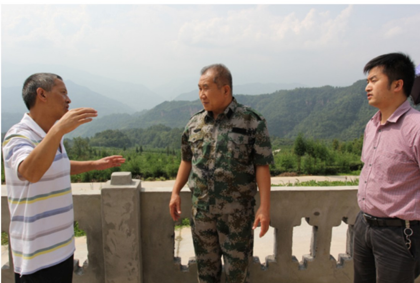
8月5日，省委第十督导组副组长、省人防办巡视员李春华（中）到马边调研农业产业发展、彝家新寨建设，并指导群众路线教育实践活动。