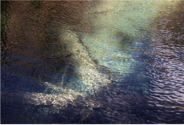
水之韵 马松涛 摄