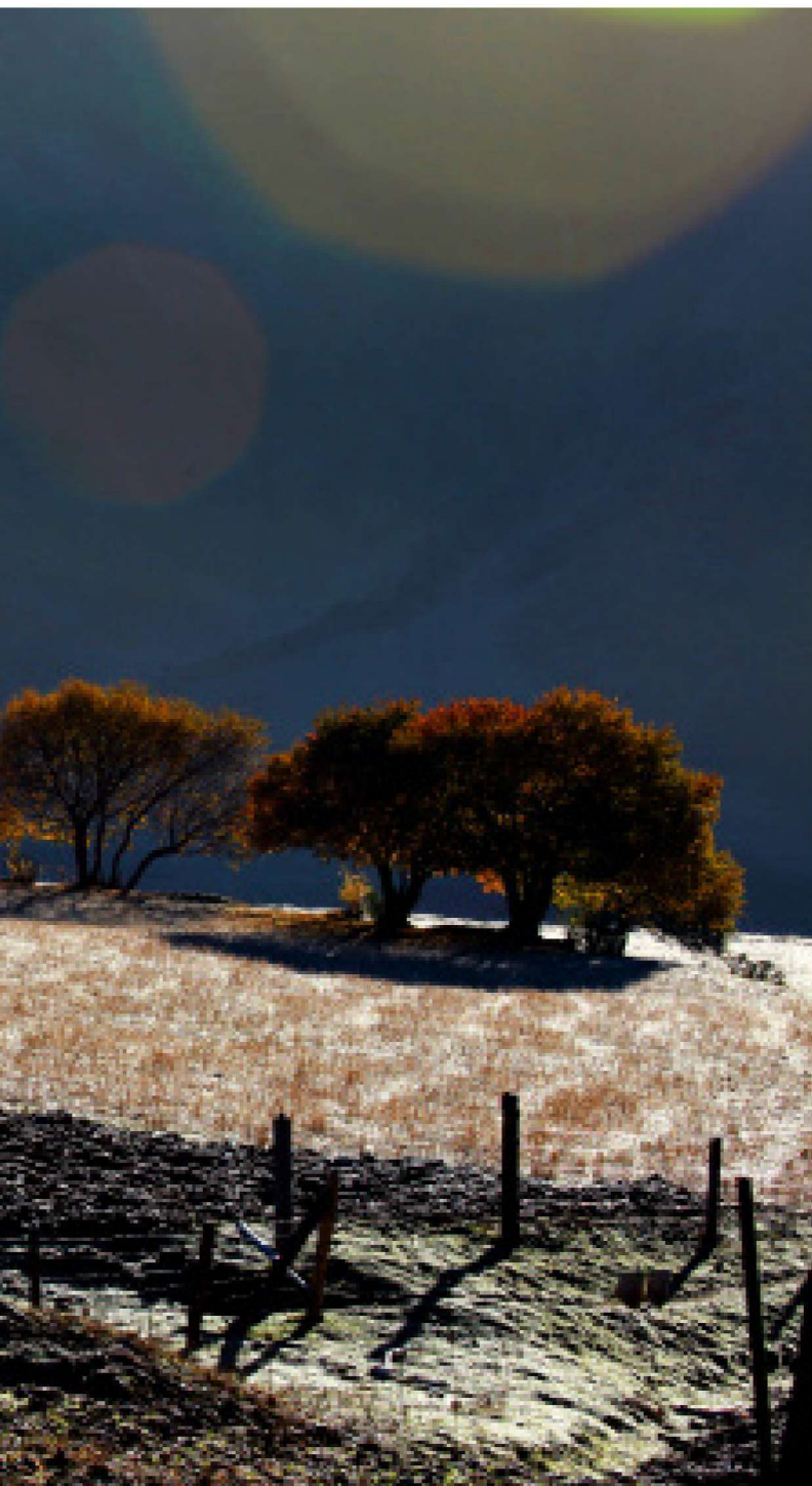
和谐 和谐