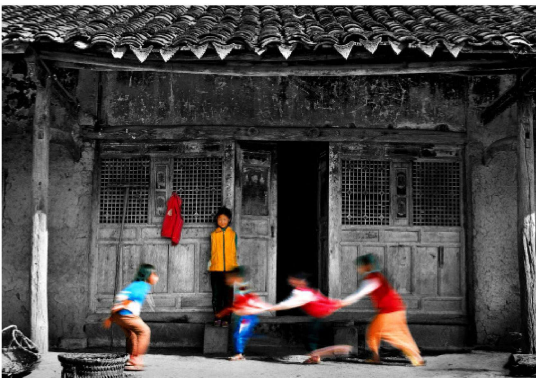
快乐的童年