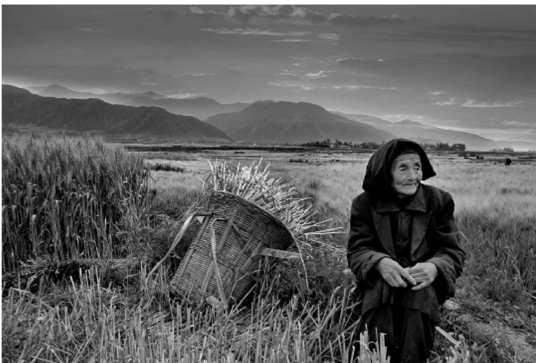
孤独等待