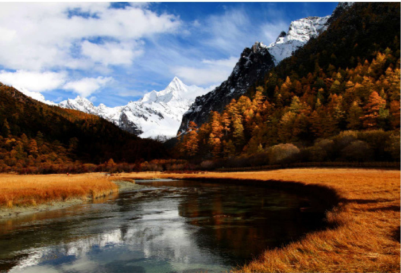
亚丁秋韵