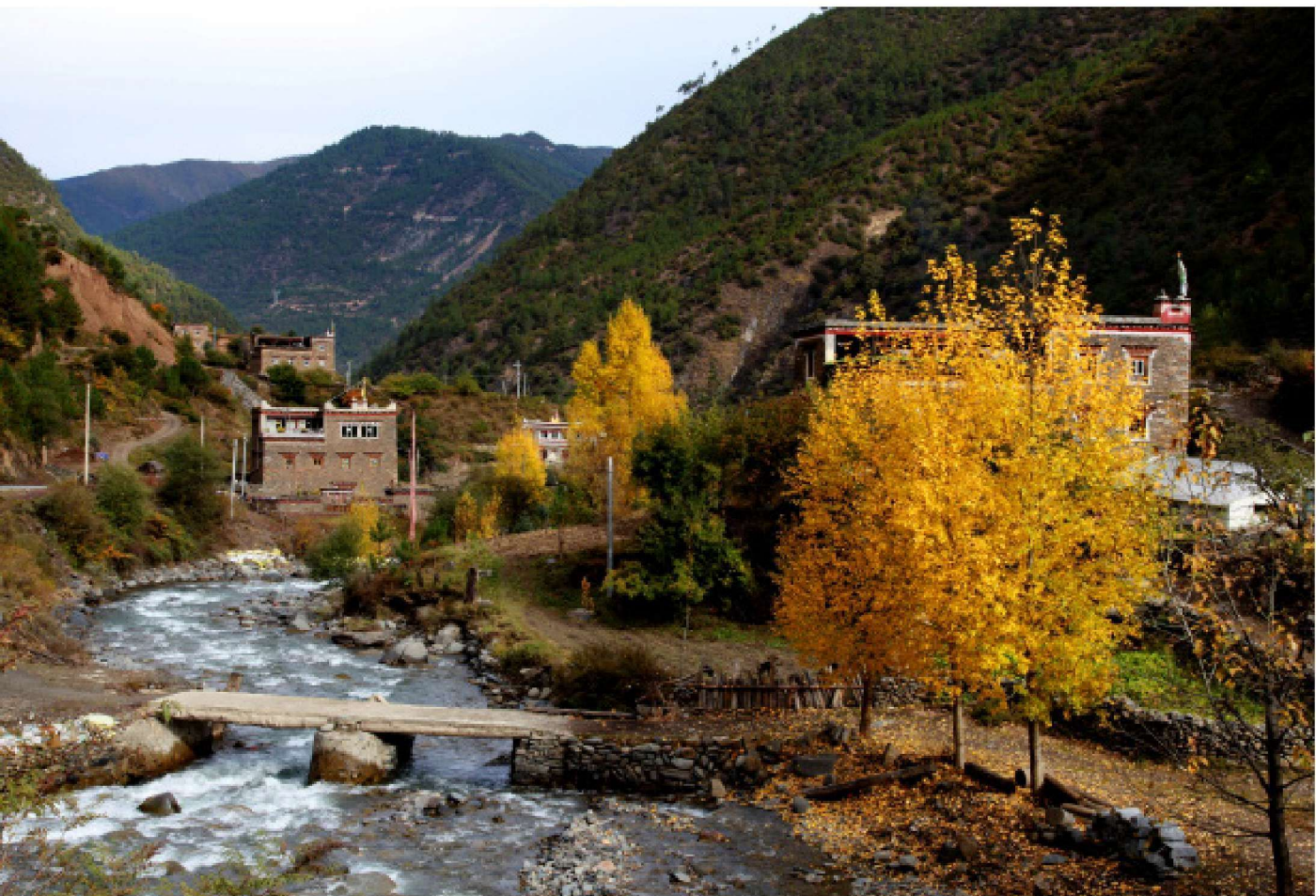
藏寨秋色