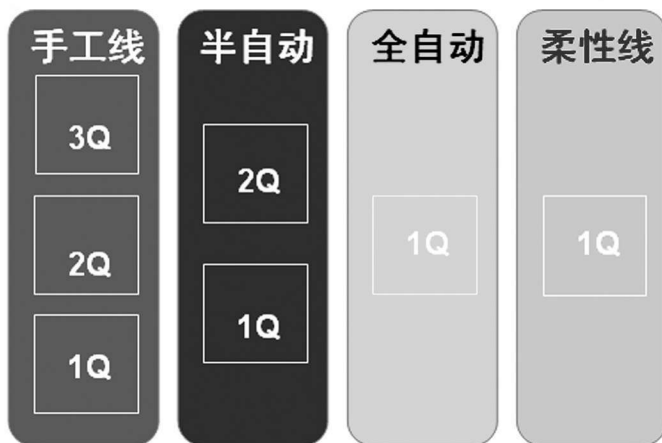
图 1-4 生产线标识