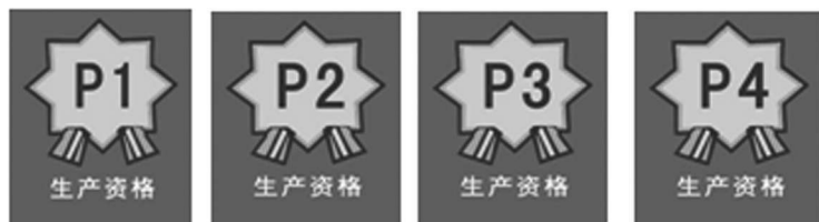
图 1-3 生产资格标识

图 1-3 中的标识牌表示生产资格，企业通过研发产品获得产品的生产资格；图 1-4 中的标识牌表示生产线，企业通过购买、安装生产线，不同的生产线生产周期不同；图 1-5 中的标识牌表示 ISO 认证资格，随着市场的逐渐完善，市场对产品的质量要求越来越高，在后期的模拟过程中，有些订单要求企业具有 ISO 认证资格；图 1-6 中的标识牌表示市场准入资格，企业通过投资开拓获得市场准入资格。