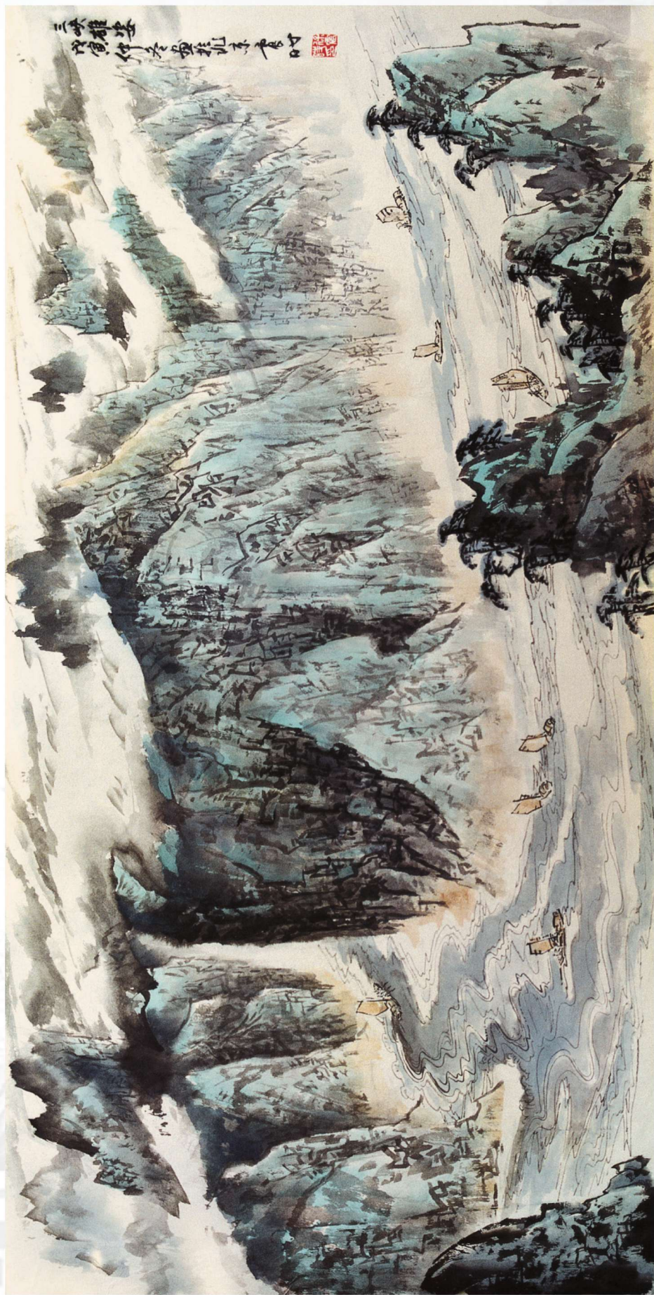
三峡雄姿 1998年 52cm x 106cm