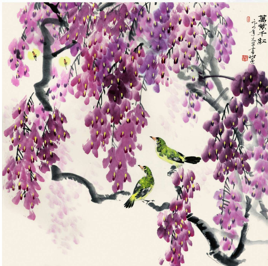
万紫千红 1994年 68cm X 68cm