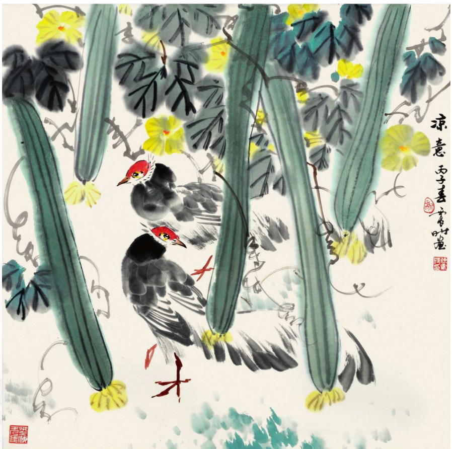
凉意 1996年 69cm X 69cm