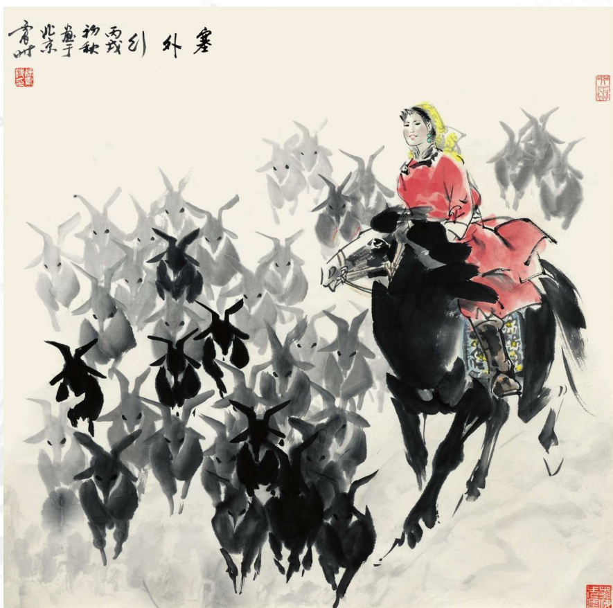
塞外行 2006年 69cm X 69cm