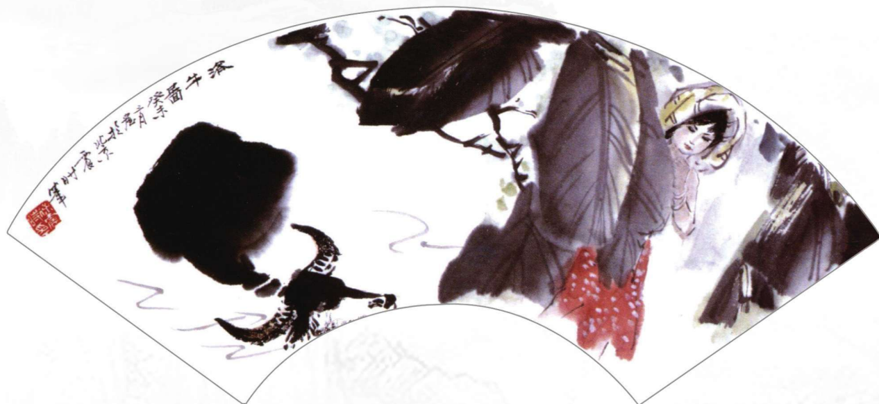
浴牛图 2003年 20cm×45cm