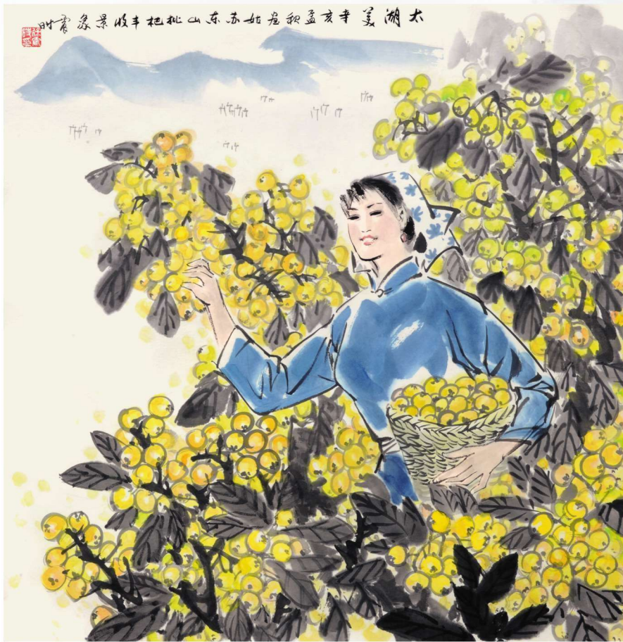
太湖美 1971年 69cm X 69cm