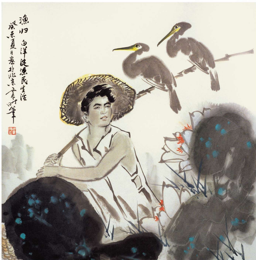
渔归 2003年 69cm X 69cm