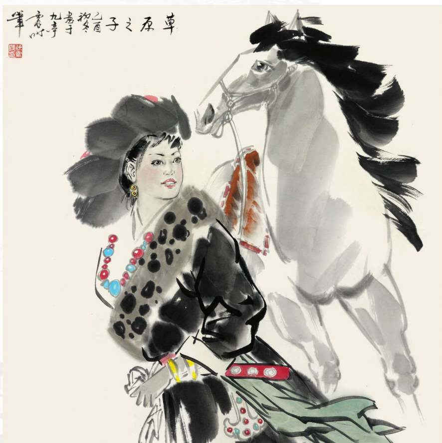
草原之子 2005年 68cm X 68cm