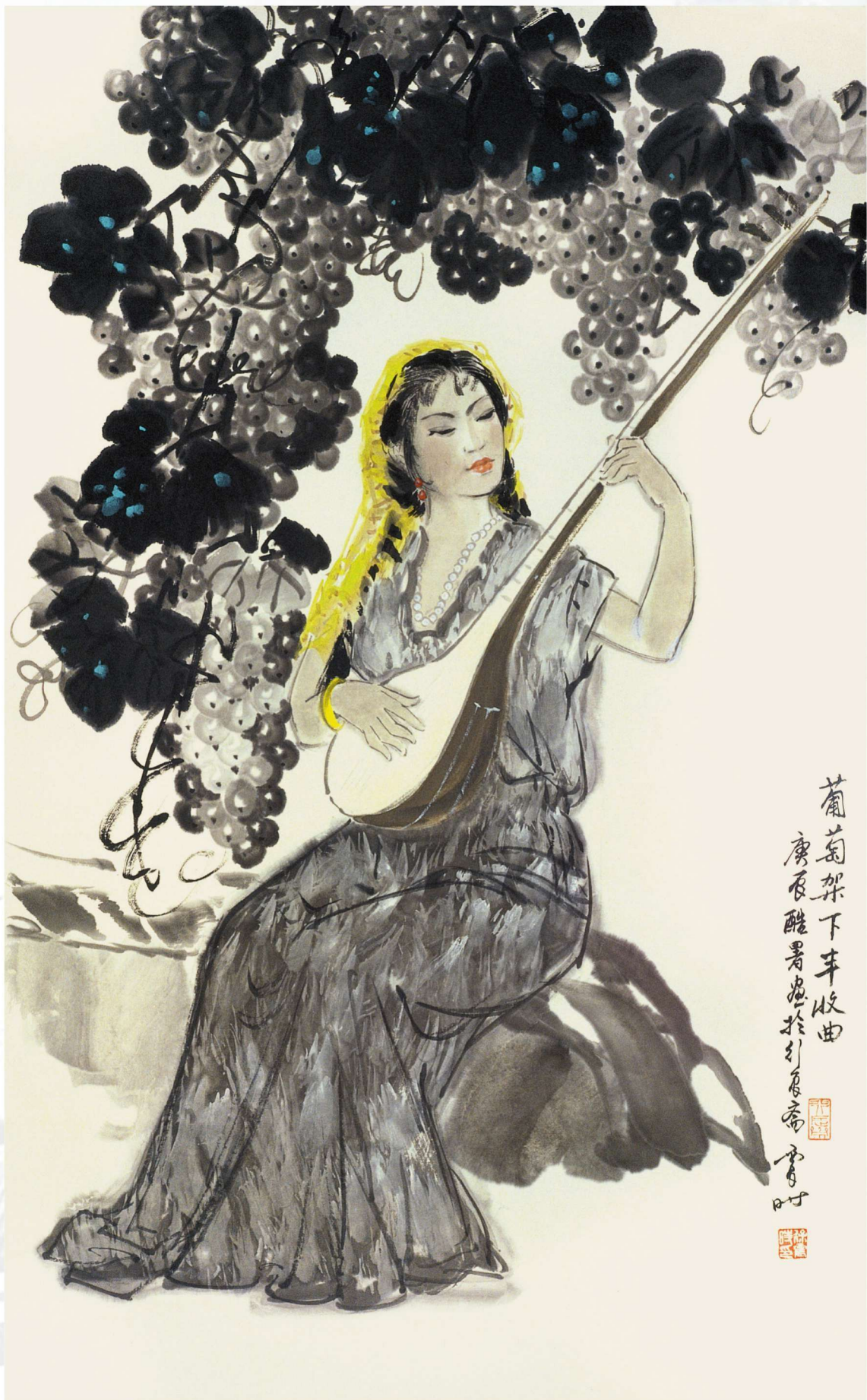
葡萄架下丰收曲 2000年 96cm X 59cm