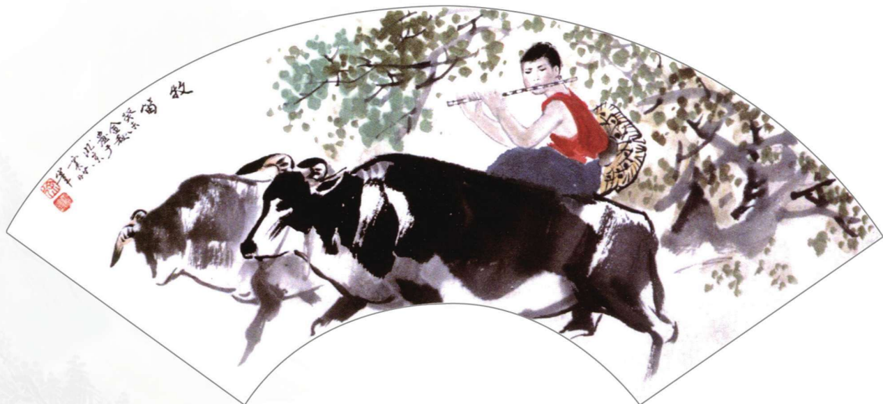
牧笛 2003年 20cm×45cm