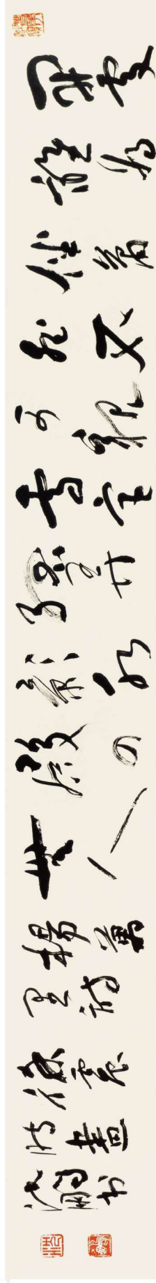
凌波仙子（徐震时画 沈鹏书）1983年 55cm×153cm（全国获奖作品，编入《中国现代美术全集》）