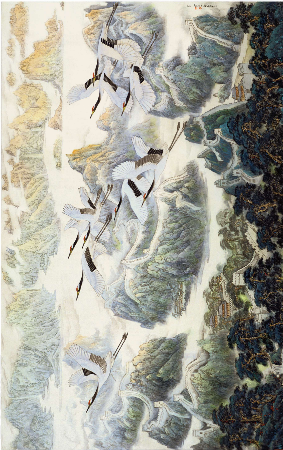
神州大地 1993年 104cm×164cm (徐震时 金家翔 张晓君作，全国获奖作品，编入《中国现代美术全集》)