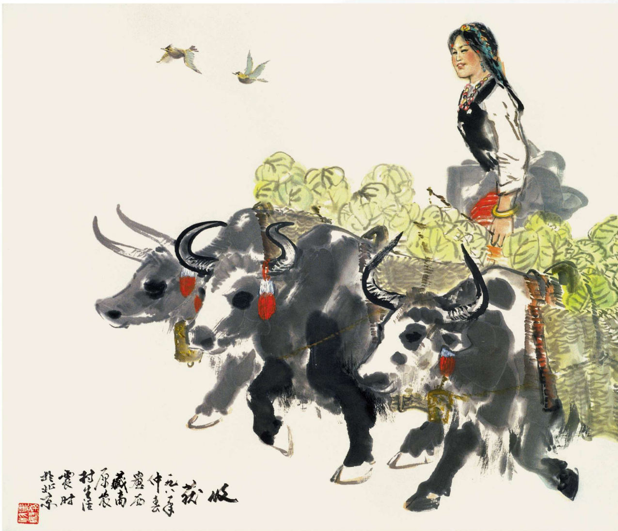
收获 1981年 83cm×95cm