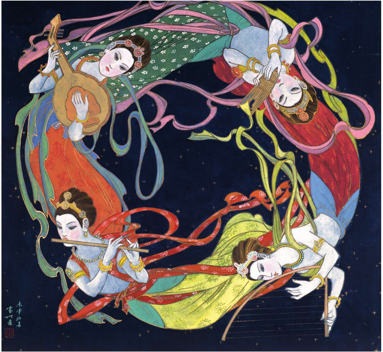
飞天 1992年 96cm×96cm