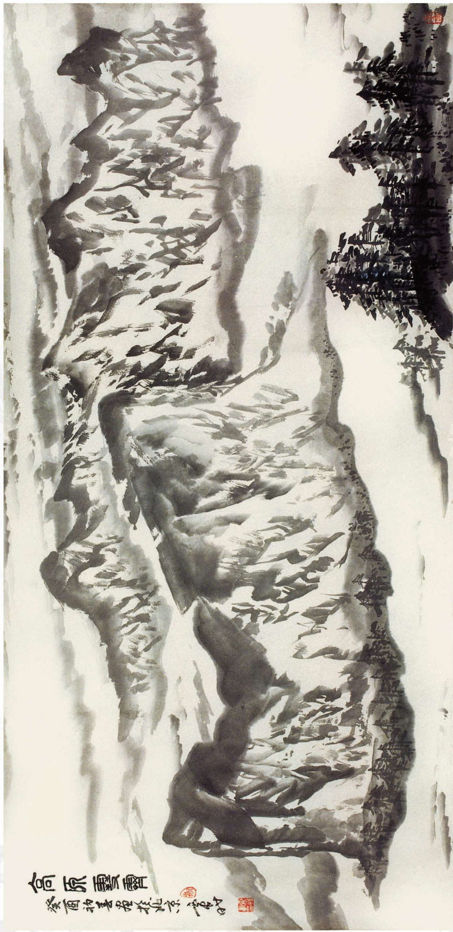
高原雪霁 1993年 68cm x 136cm