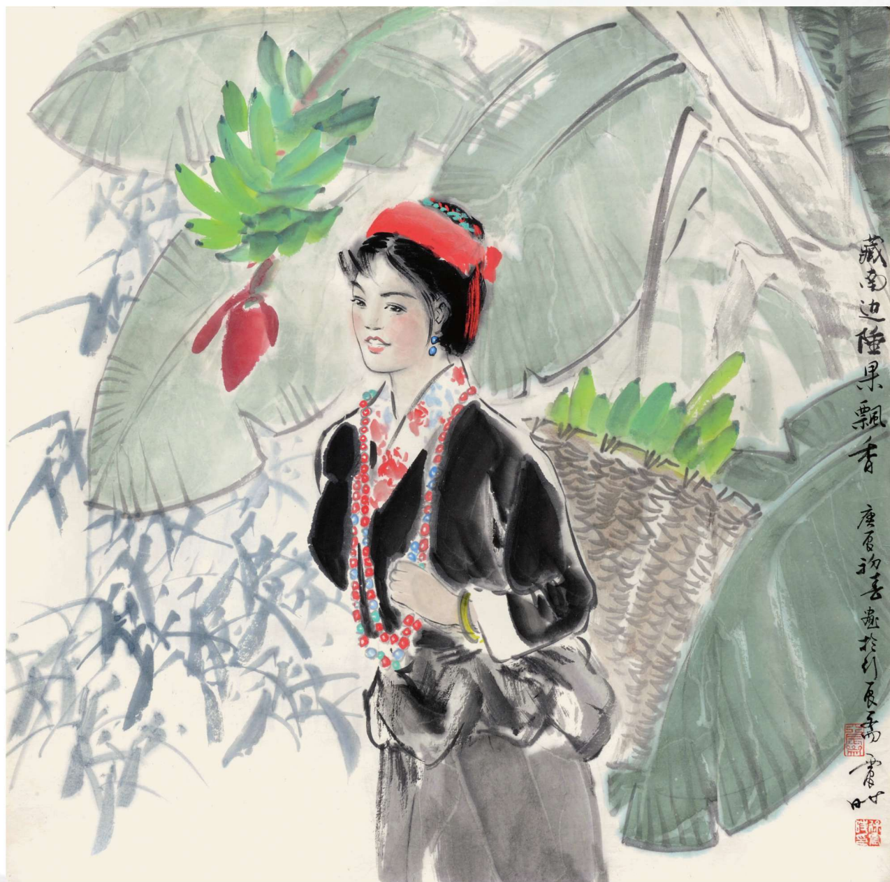
藏南边陲果飘香 2000年 69cm×69cm