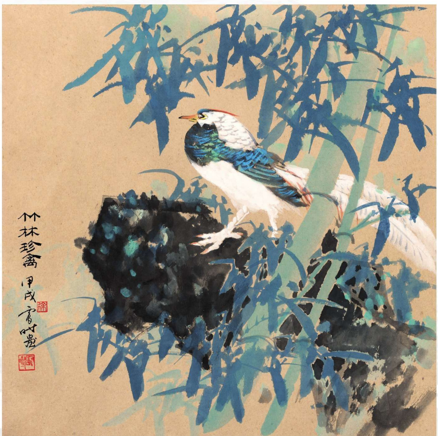
竹林珍禽 1994年 69cm X 69cm