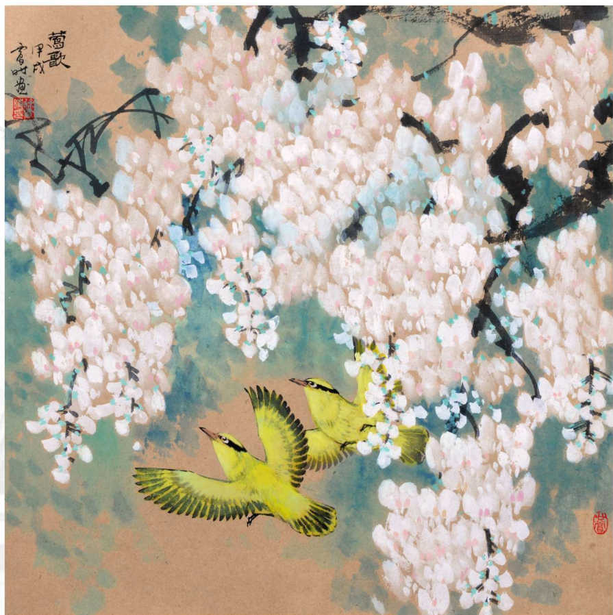
莺歌 1994年 69cm X 69cm