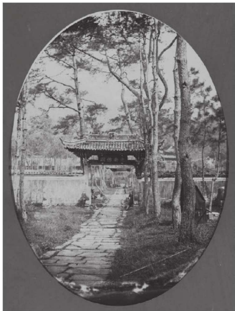
■ 阿育王寺旧影——山门