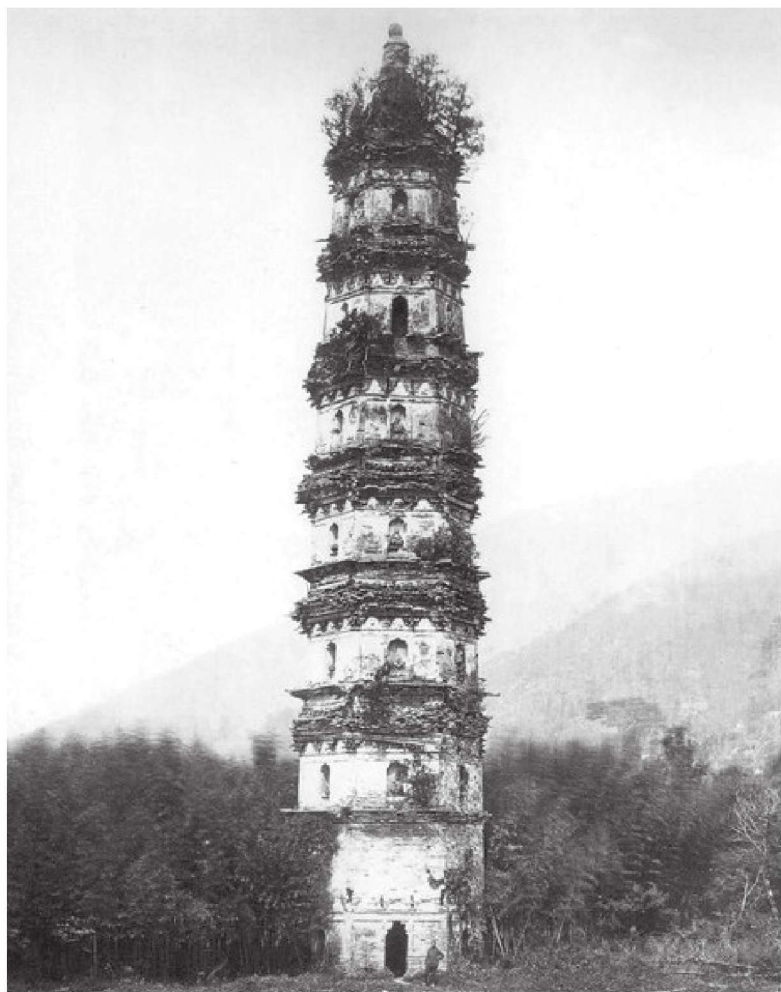
■ 阿育王寺旧影——西塔

贸易港口城市，又与临安（杭州）相近。怀琏南下的消息被明州郡守获知，而此时明州阿育王山广利寺（即宁波阿育王寺）正缺少住持。郡守慕其名，希望他能前来住持。