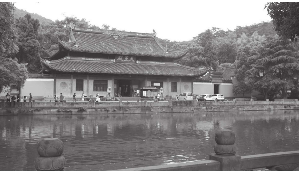
■ 阿育王寺放生池及天王殿

阿育王寺坐北朝南,依山势而建,总占地面积约124100平方米,建筑面积约23400平方米,拥有殿堂楼阁、禅房客堂700余间。中轴线依次为山门、