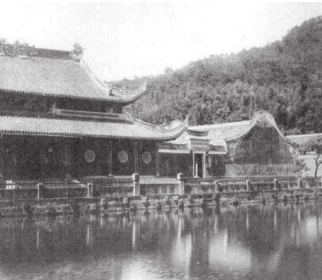
■ 阿育王寺旧影——放生池、天王殿及钟楼

色衣,以瓦铁食,此钵非法。” ① 就将钵焚烧。仁宗知道后,感叹不已,不但没有加罪于他,而且更加敬重怀琏禅师,也更舍不得怀琏离开京城。怀琏禅师先后几次请辞都未能获准。