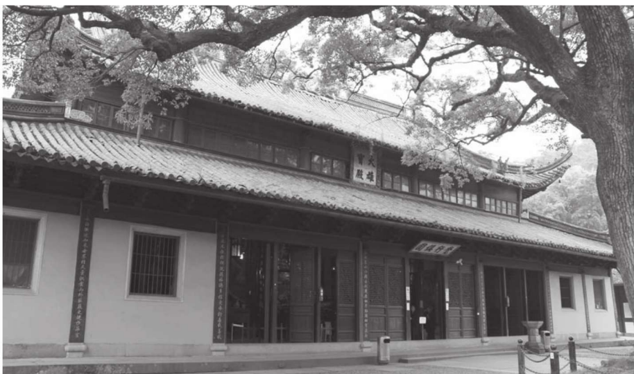
■ 阿育王寺大雄宝殿

二山门、放生池、天王殿、大雄宝殿、舍利殿、法堂和藏经楼。西侧有云水堂、鄮峰草堂、拾翠楼、祖师殿、承恩堂、方丈殿、宸奎阁、寮房等，东侧有松光斋、钟楼、舍利单、先觉堂、大悲阁等。四周还分布着养心堂、退居室、文物陈列室、引堂寮、朴青阁、白云竹院、普同塔院等殿堂楼阁，多为1979年起按清代风貌陆续维修、复建。寺院整个建筑群规模宏大、结构古朴，楼阁轩榭、飞檐雕梁，与山顶的上塔、寺院左右两侧的下塔和东塔相映成趣，共同构成了一座较为严谨的伽蓝式布局寺院。1983年4月9日，阿育王寺被列为国务院公布的汉族地区佛道教全国重点寺观之一。2006年5月25日，阿育王寺被国务院公布为第六批全国重点文物保护单位。