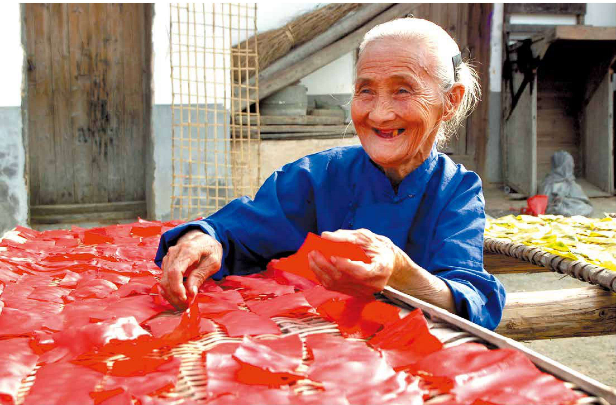
《日子越过越红火》