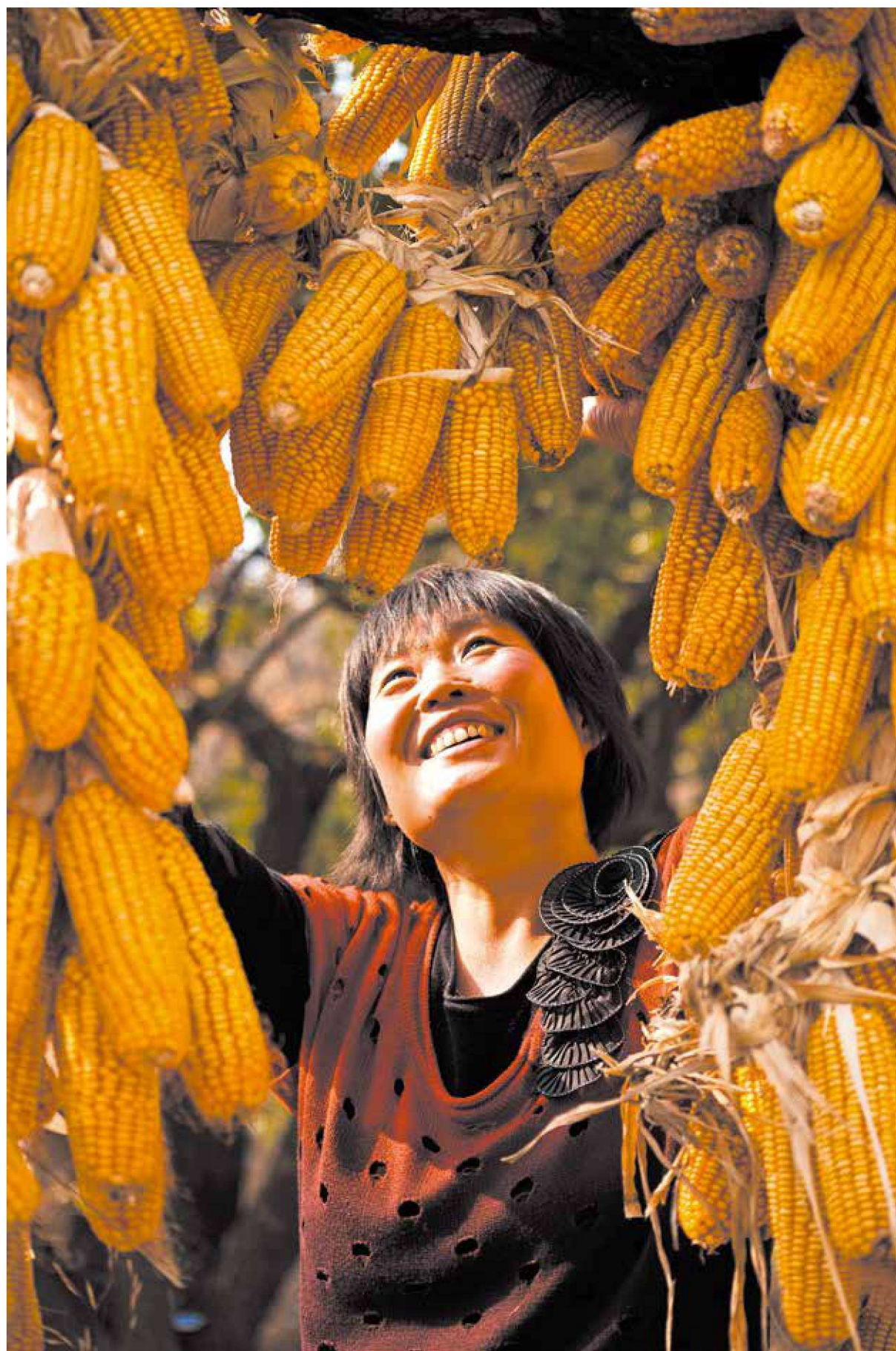
《丰收的喜悦》