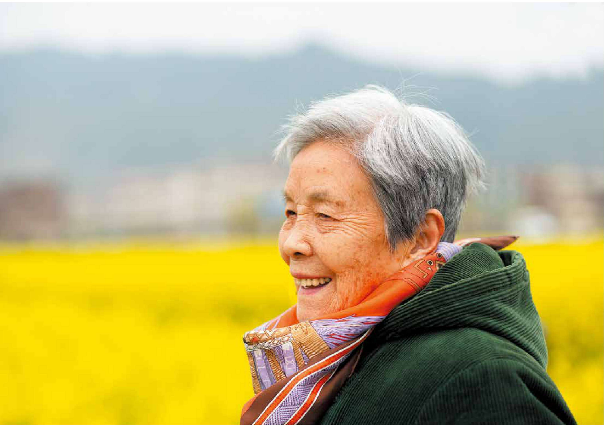
《共产党员学习的榜样——龚全珍》