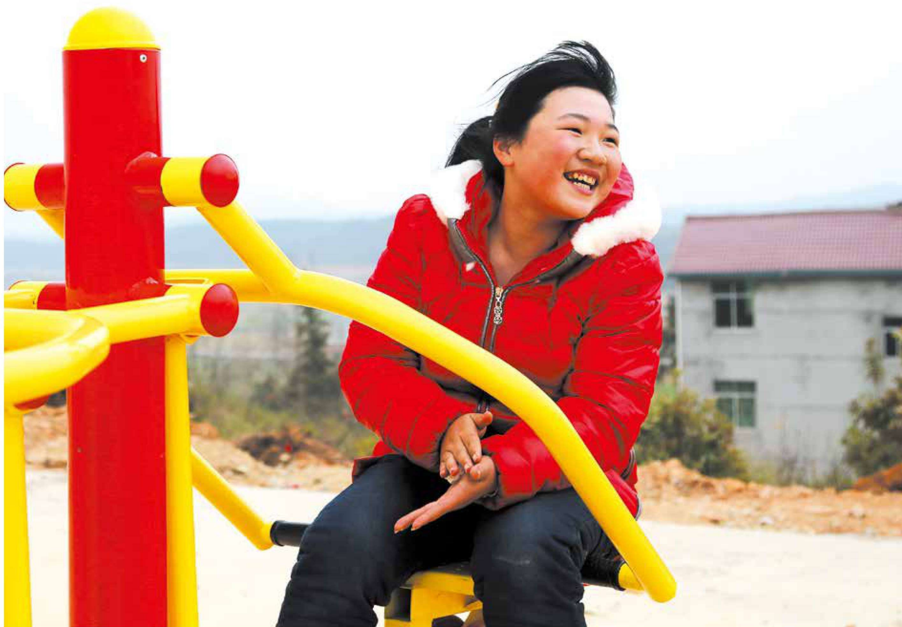
《欢快的村姑》