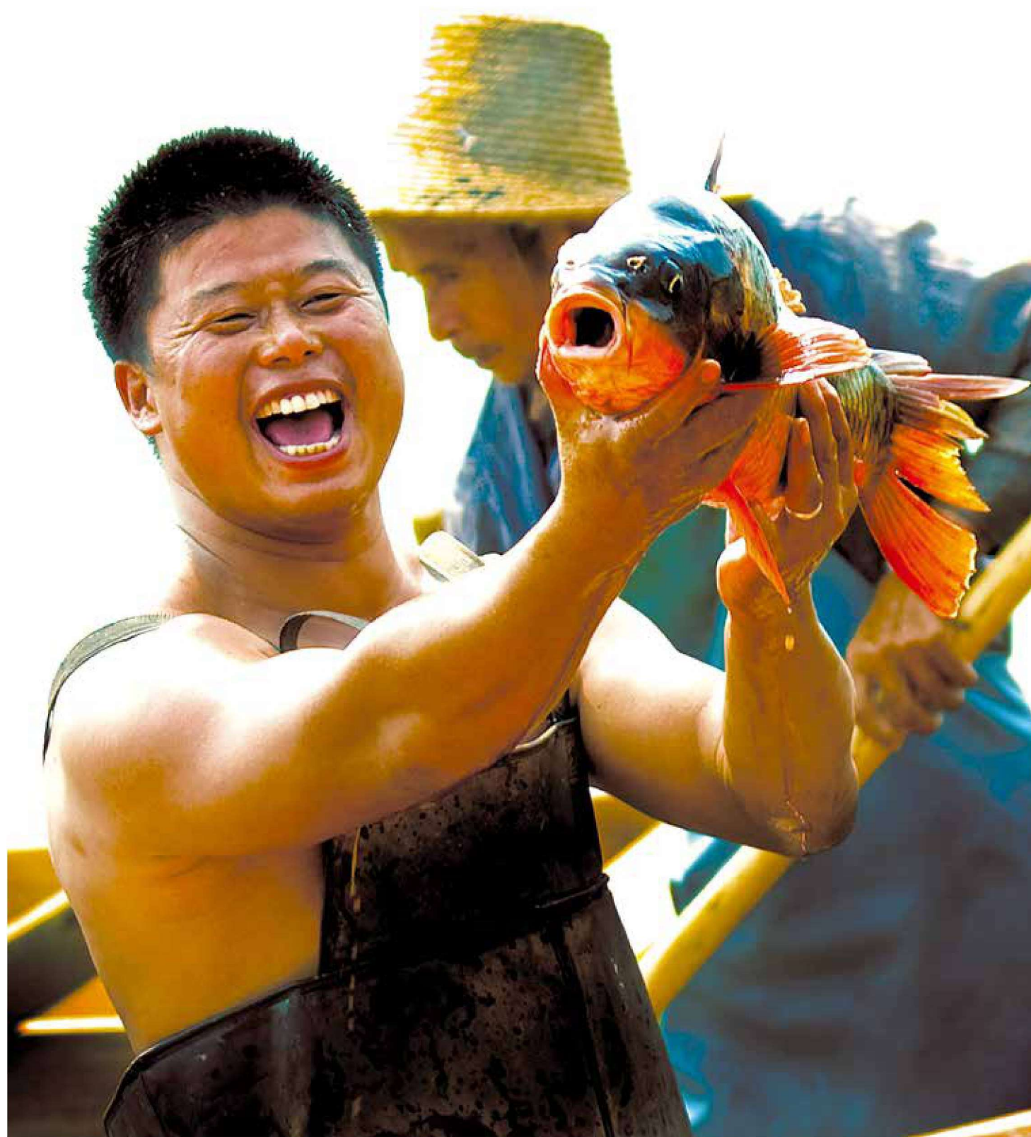
《喜悦》 李毅弋 摄