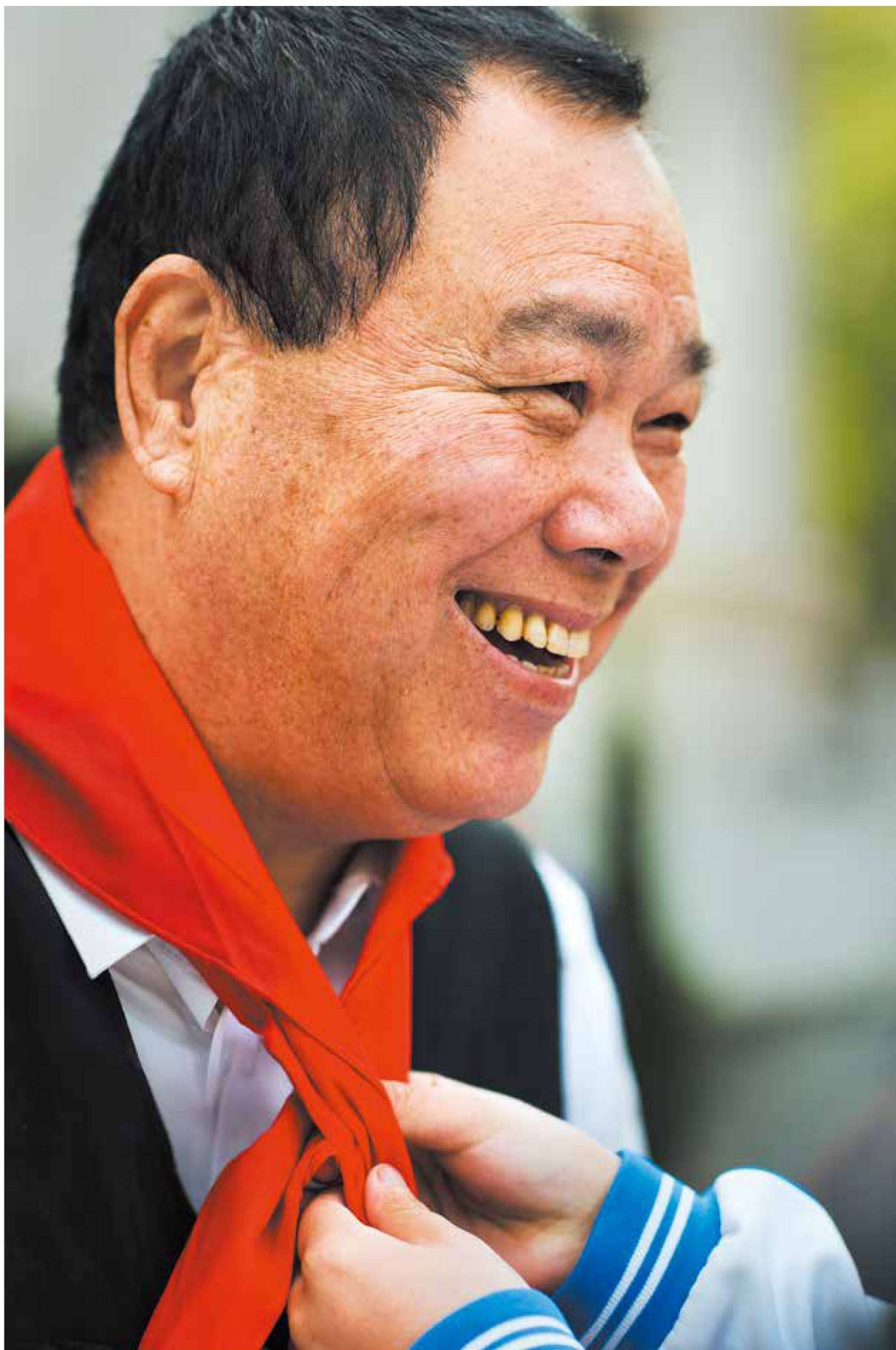
《全国公安一级英模——邱娥国》