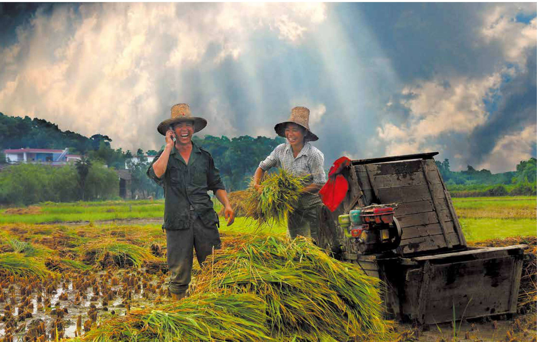
《丰收传喜讯》