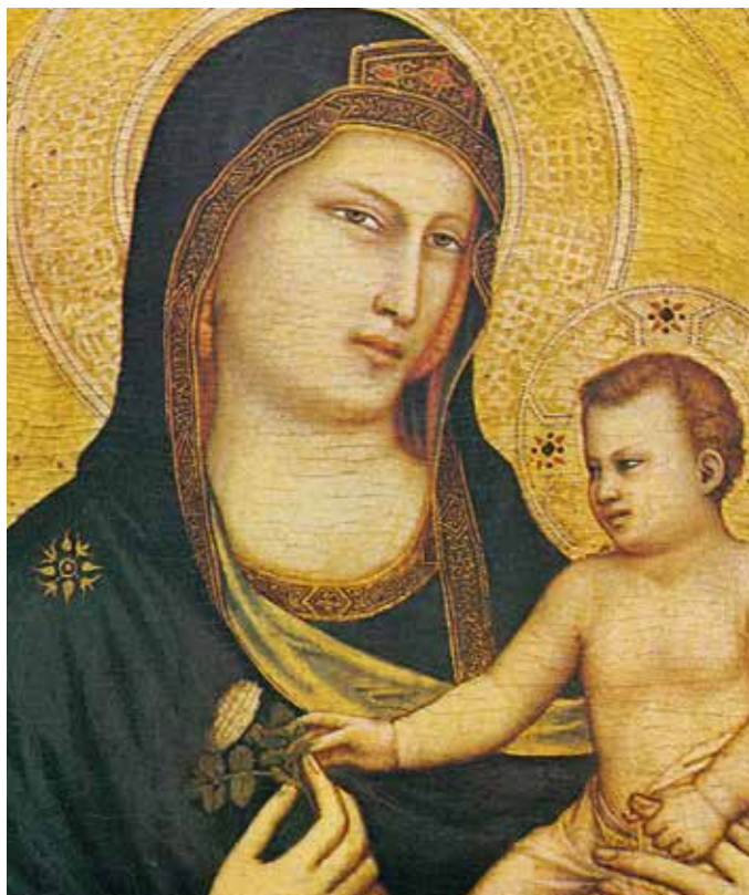
乔托，《带着圣婴的圣母》(局部)，1320—1330

它能够代表欧洲艺术的最高水平，从拜占庭时代到18世纪末，但是现在目的对于他来说变得清楚了：即应该使尚不存在一座国家美术馆的华盛顿具有一个巨大的国家美术馆，以被人欣赏和被造访的伦敦国家美术馆为榜样。于是事情也就这样发生了，甚至可以说，这仅仅是开端。梅隆的珍贵收藏从这位大金融家的年轻时就已经开始了。他为了它，进行了多次在欧洲的旅行，以便与那些最重要的古董商保持接触，并且实施购买，这些购买都被发现是属于最有威信的，这一切也要感谢他的朋友克莱·亨利·弗里克的鼓励与支持。作为古董商克诺德勒公司的热心顾客，他通过他们的中介作用，变成圣彼得堡修道院博物馆的二十一件杰出画作的产权所有者，当时这批艺术品的产权已转让给了亚美尼亚的亿万富翁古尔本金安。借助这种确实是轰动性的（它被视为拿破仑朝代以来的最大的打击）和在一九三〇年和一九三一年间结束在购买：拉斐尔的杰作如《圣乔治与龙》和《黎明圣母》，维罗奈塞的《摩西被发现》，弗朗德勒人凡·埃克的《天使报知》，桑德罗·波提切利的辉煌的《三王朝拜》，另外还有提香的几件作品，凡·戴克的四件作品和伦勃朗的五幅油