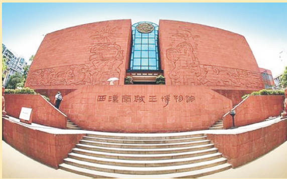
西汉南越王博物馆

西汉南越王博物馆是广州两千多年悠久历史的见证者。它是以南越王墓为中心建造的一座新型遗址博物馆，是中国政府依据《威尼斯宪章》采取的保护文物、利用文物的一个成功范例。它以保存完好的古墓原址，内涵丰富的汉代文物，典雅气派的建筑而闻名于世。