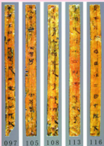
南越王宫竹木简档案