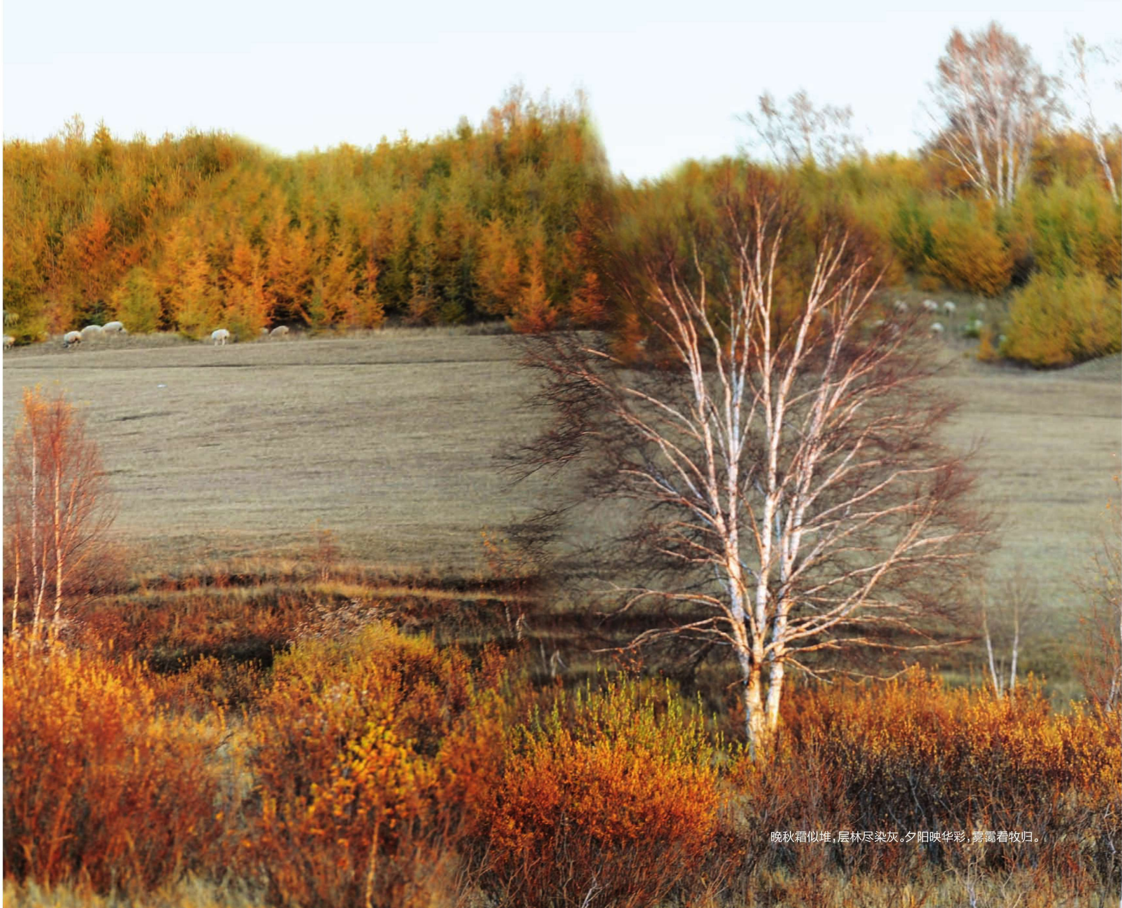
晚秋霜似堆，层林尽染灰。夕阳映华彩，雾霭着牧归。