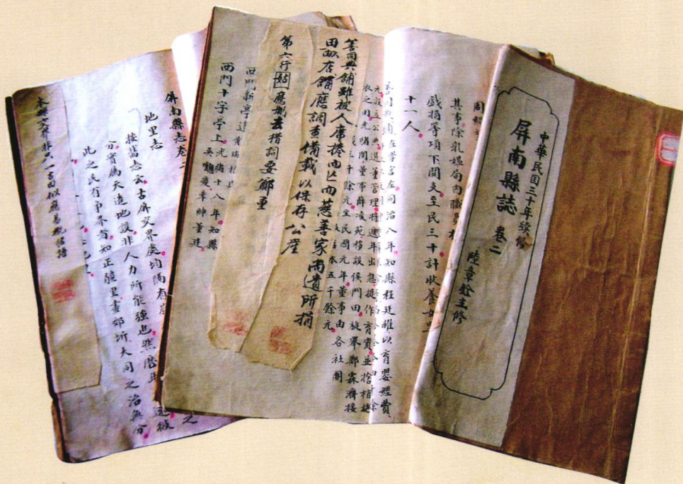
民国修《屏南县志》稿本(屏南县档案馆藏)