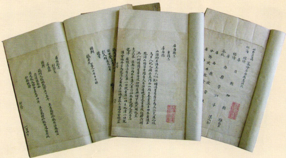
道光九年修《屏南县志》稿本(福建省图书馆藏)