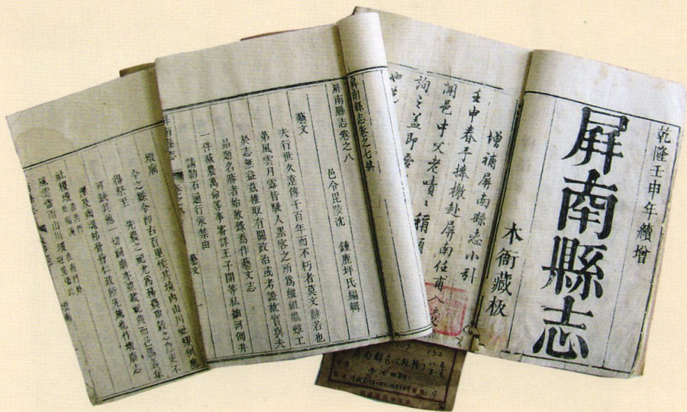
乾隆十七年沈宗良补刊本《屏南县志》(福建省图书馆藏)