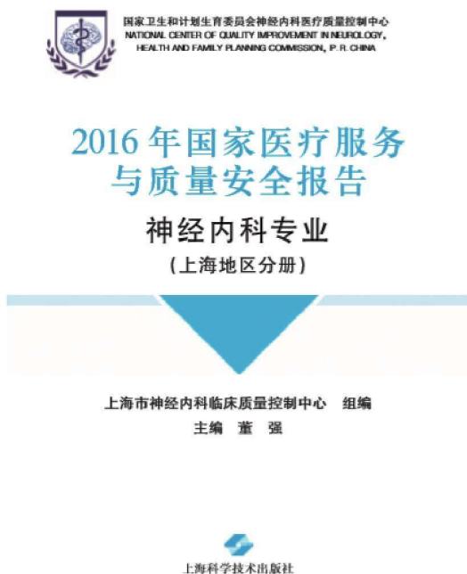
图 1-1 2016 年上海医疗服务与质量安全报告 神经内科专业(上海地区分册)

病种质控白皮书(图 1-1)。另外,上海在 2017 年新增监测哨点医院 3 家,由专人对其临床质量控制数据进行持续上报至数据平台。