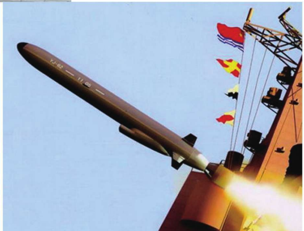
鹰击-62远程反舰型巡航导弹 ○