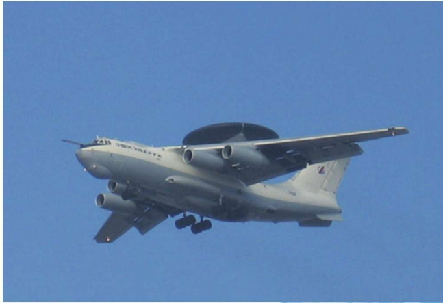
○ “空警2000” 预警机